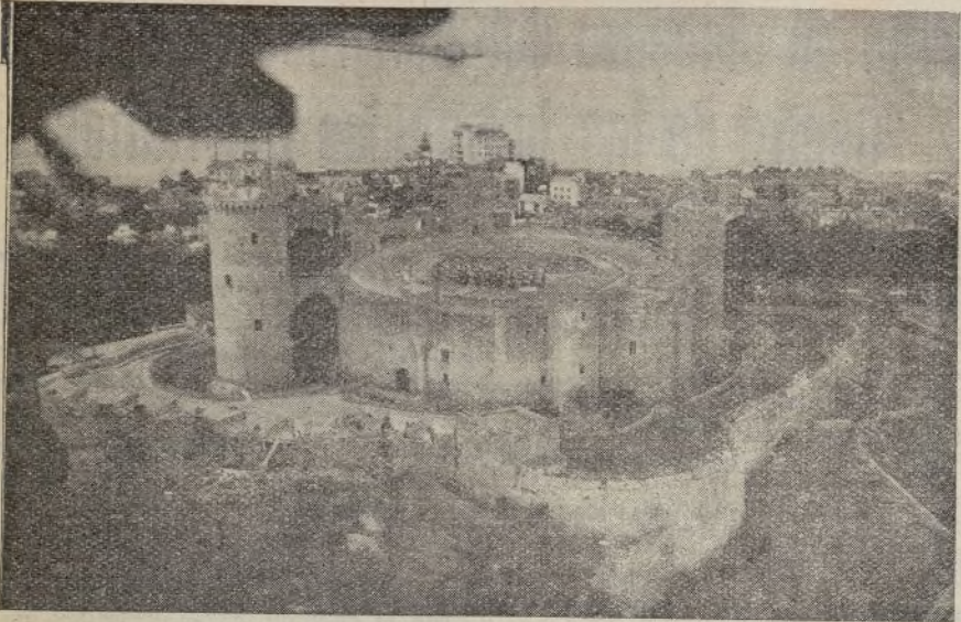
Castillo de Bellver, en Palma de Mallorca, donde están detenidos todos los hombres de izquierda por los facciosos.