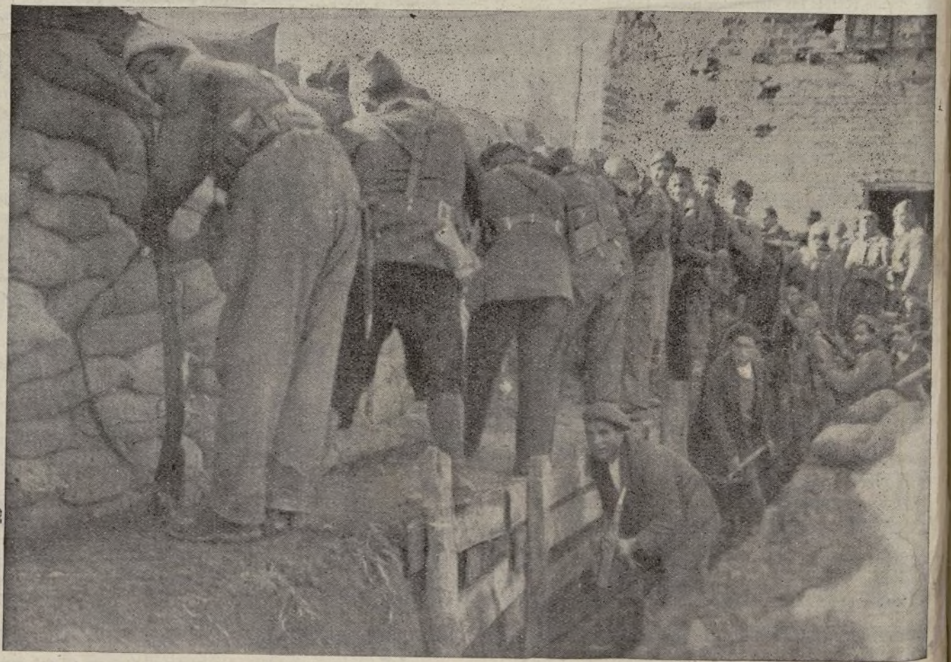
En las trincheras, nuestros heroicos milicianos defienden la cultura y la libertad del mundo. No temen a la muerte. Para ellos, es más grande, más hermosa, la muerte por la libertad, que la vida bajo la esclavitud.

Hay Hospitales de Sangre que carecen de coches para desarrollar su humanitaria labor.