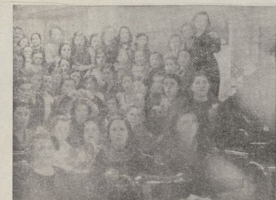
Las muchachas, durante la comida.

—¡Oh! ¡Muchos! Este taller es sólo el principio de nuestra labor. Pensamos ir intensificando la creación de estos talleres, hasta llegar, por la mejor calidad del trabajo y por su economía en los pre-