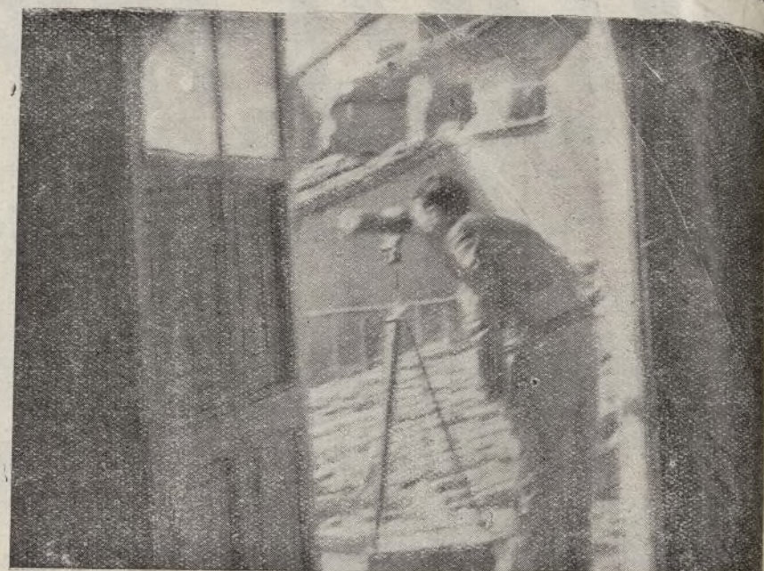
Jefe de artillería tomando la distancia telemétrica del Gobierno Militar de Huesca desde el casco de la población, en nuestro poder, momentos antes de iniciar el bombardeo de dicho objetivo militar.

Por la Federación Ibérica de Juventudes Libertarias EL COMITE PENINSULAR