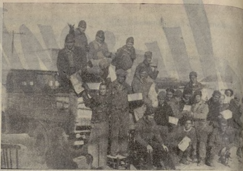
Reparto de donativos a los milicianos que defienden Madrid.