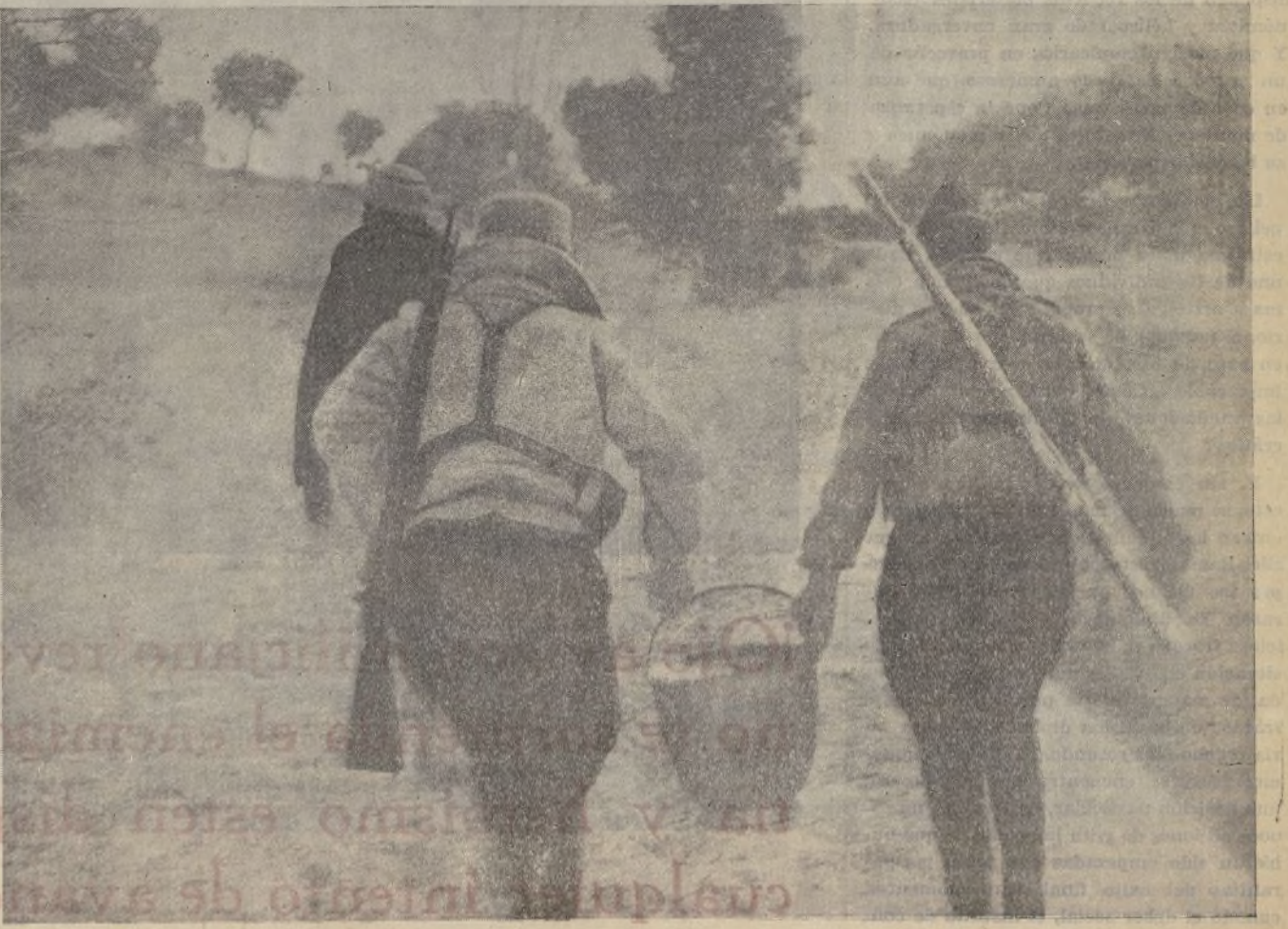
Llevando la comida a las primeras líneas de fuego.

Redacción y Administración: Ibiza, 11.-Tel. 52022 Correspondencia: Aportado 12085