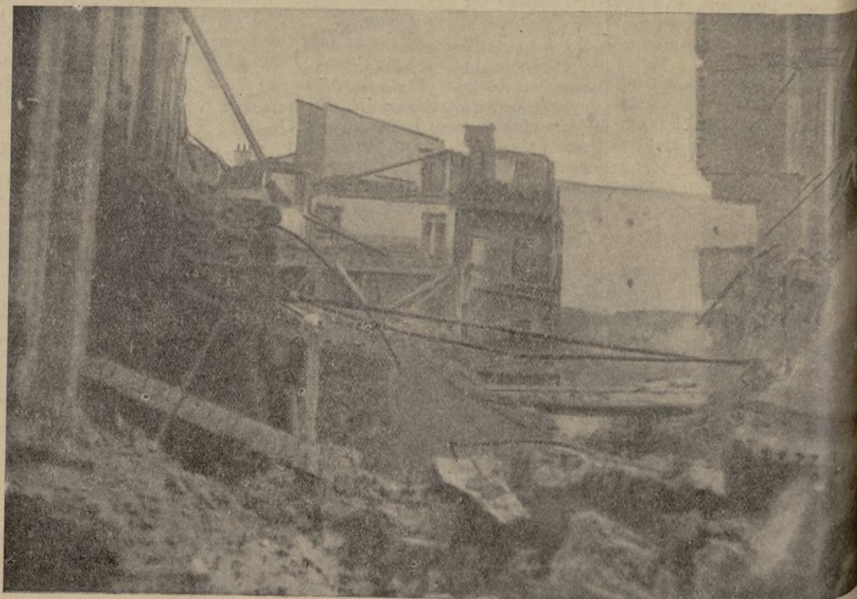
Barbarie, crimen, y, sobre ello, el sádico placer del fascismo al destruir lo que no puede ser suyo.