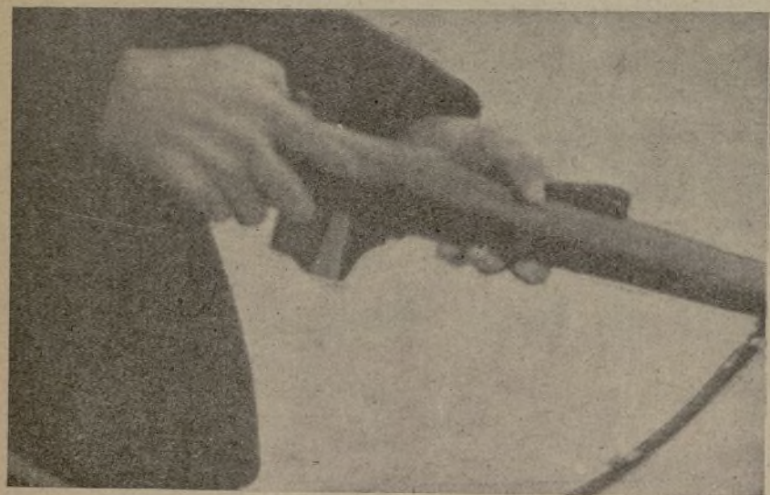
Las manos firmes en el fusil. ¡Ahí está la victoria!