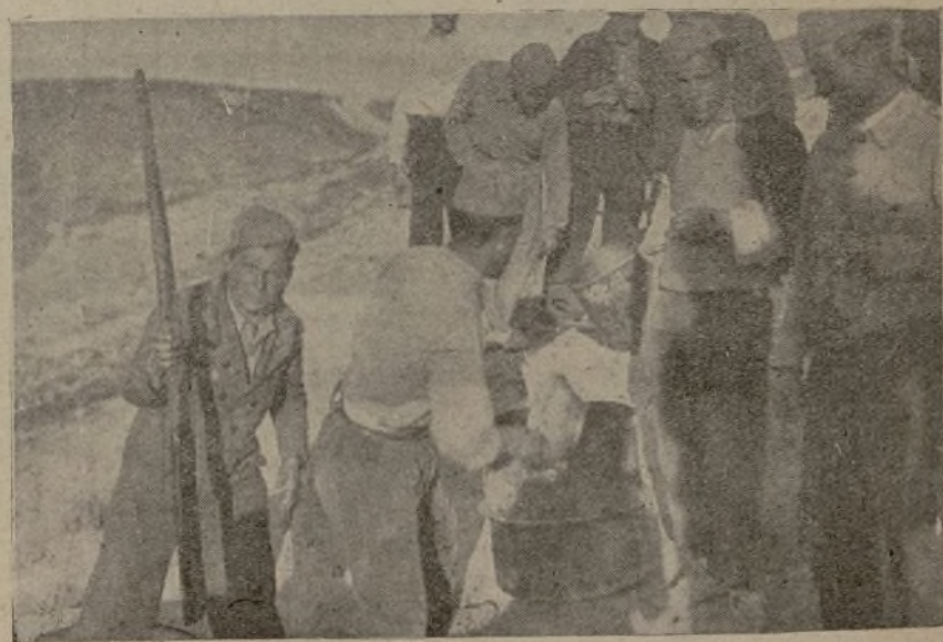
Ha terminado el reparto de la comida a los hijos del pueblo que luchan en las trincheras.