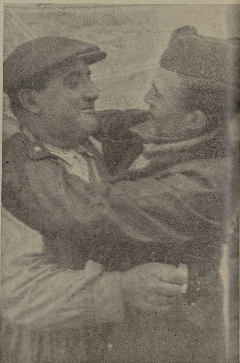
La vuelta al lugar en disfrute de permiso. El hijo es recibido con la natural alegría.