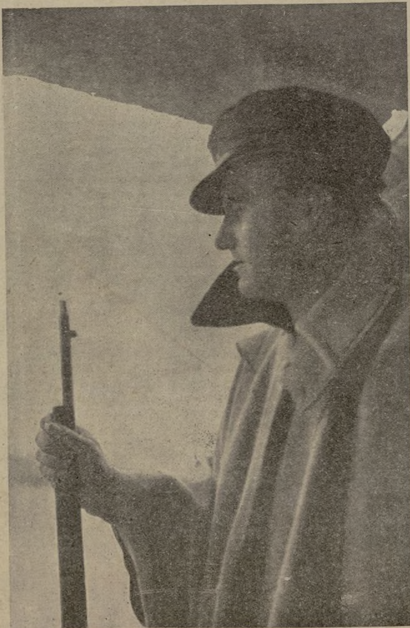
Vigilantes contra el enemigo. Firmes frente a las consignas contrarrevolucionarias. Su pensamiento: Frente de la Juventud Revolucionaria.

De un lado, la Revolución; del otro, la contrarrevolución. Frente a frente. La España proletaria se ha inclinado ya hacia la Revolución. Silencio, pues. Las trincheras y las fábricas son la garantía de que la Revolución triunfa.