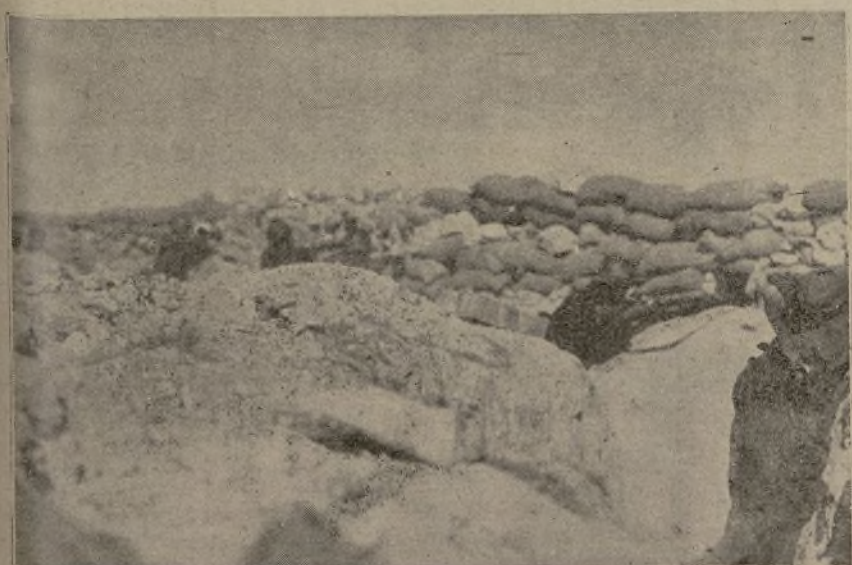
Uno de los parapetos desde el cual se frenan rápidamente todas las furias de los invasores.