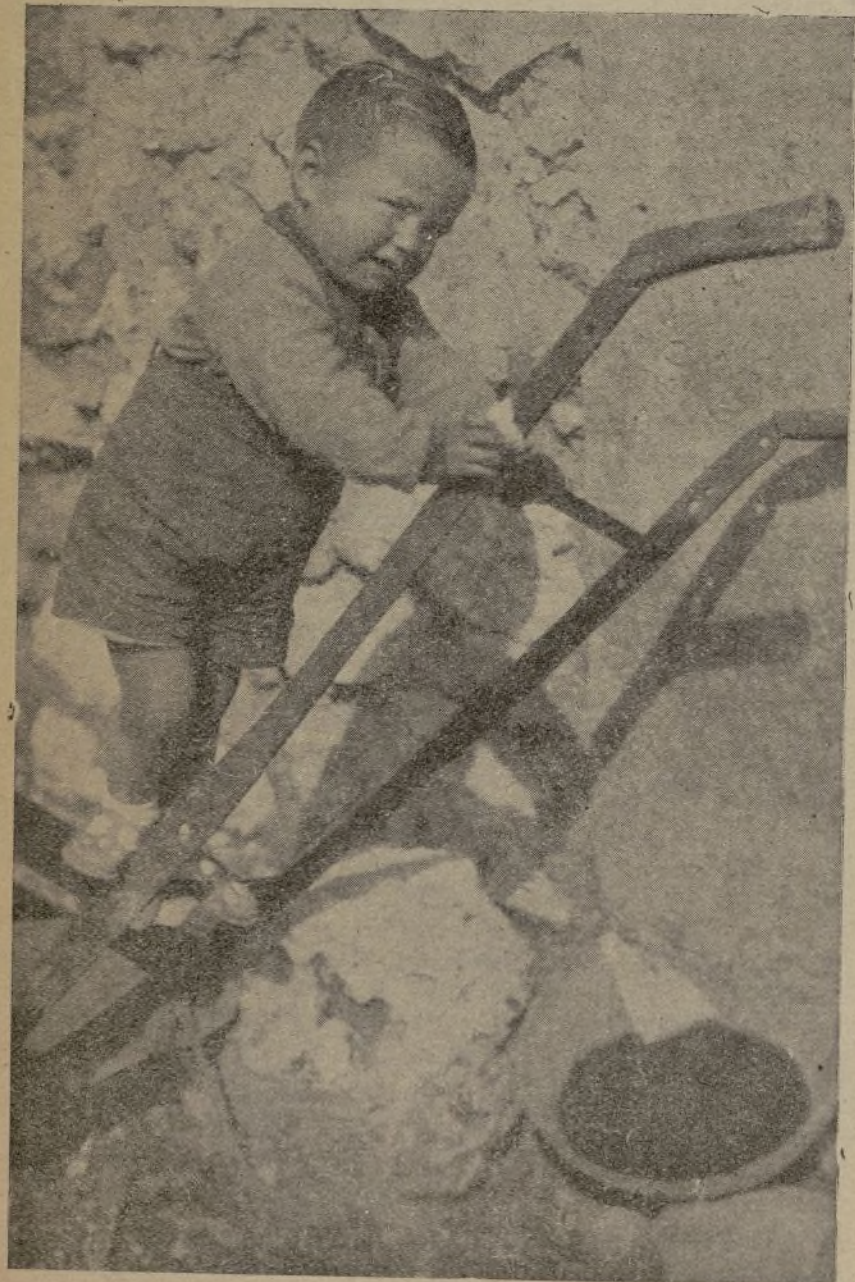
Objetivos del fascismo: niños. Seres inocentes, víctimas del sadismo fascista, ajenos al peligro, y seres inmolados en aras de la barbarie capitalista.

Todas estas consignas que propongo pueden condensarse y sintetizarse en una: ENERGIA INDOMABLE PARA DEFENDER LA REVOLUCION, SIN MIEDO ALGUNO A LAS CONSECUENCIAS. ENERGIA FULMINANTE DEL PROLETARIADO PARA APLASTAR DE UNA VEZ A LA BURGUESIA Y A QUIENES LA DEFENDEN.