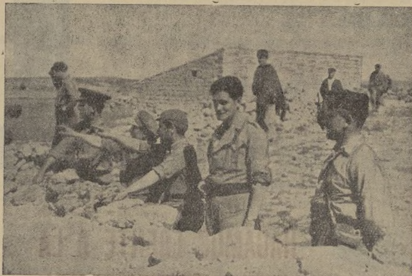
Los jefes del batallón que intervino en la toma de Espiegares.

nes político-burgueses tenga un curso distinto si se empeñan en hipotecarnos nuestras costumbres y nuestra manera de pensar.