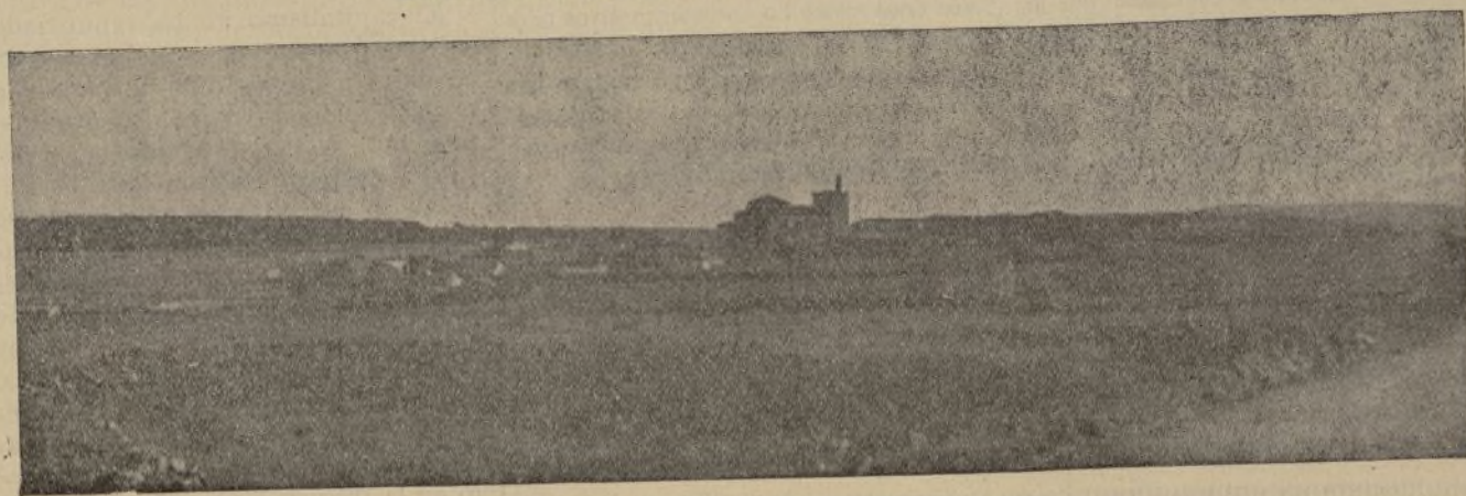
Una división: la 14. Un jefe: Mera. Un pueblo: Sacecorbo.