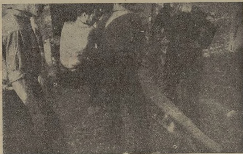
El "Pequeño F. A. I." dispara incesantemente sobre las posiciones italianas.