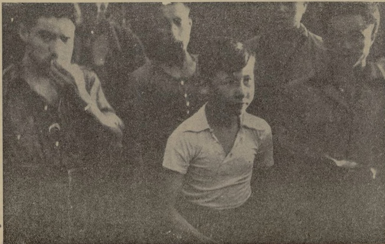
Héroes de la 14 División. La mascota del batallón, junto a sus compañeros, escucha, atento, los consejos del comisario.

toria netamente obrera han pasado a ser valedores del capitalismo