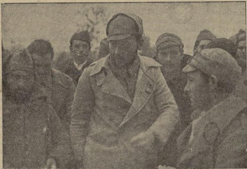
La obediencia ciega del antiguo Ejército no existe en los soldados del pueblo. La disciplina impuesta por la guerra no impide que soldados y jefes sean amigos y charlen fraternalmente.

Las Juventudes Libertarias quieren y exigen la unidad de toda la juventud. Pero piden que la unidad se realice democráticamente, por la base, mediante la convocatoria de un Congreso extraordinario de todos los jóvenes libertarios y socialistas unificados. ¿Por qué no ha aceptado la Ejecutiva Nacional de las Juventudes