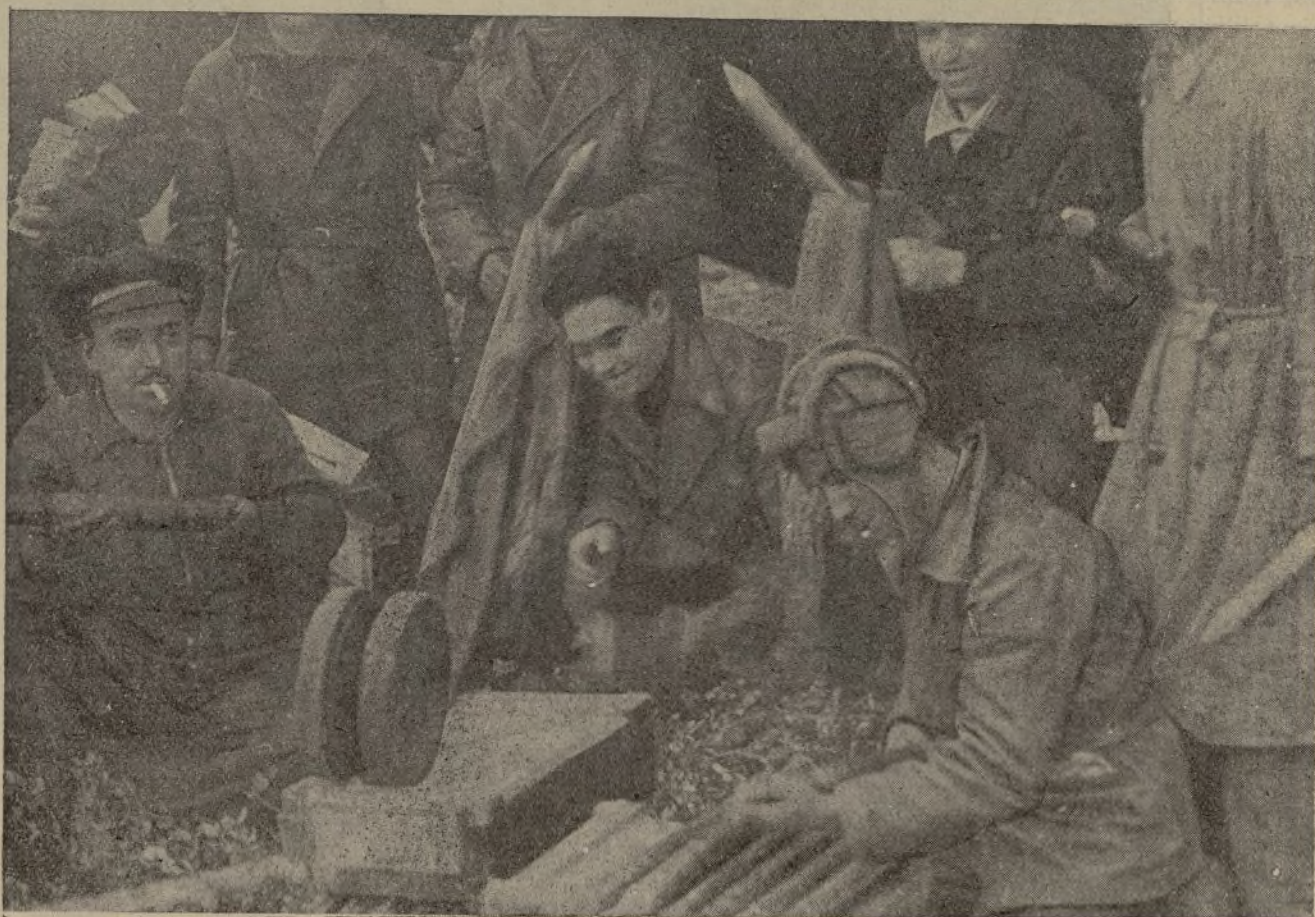
Soldados del frente de Pozoblanco, en un momento de descanso, limpian las piezas de Artillería, que más tarde segarán las filas enemigas.

ESTE NUMERO HA SIDO VISADO POR LA CENSURA