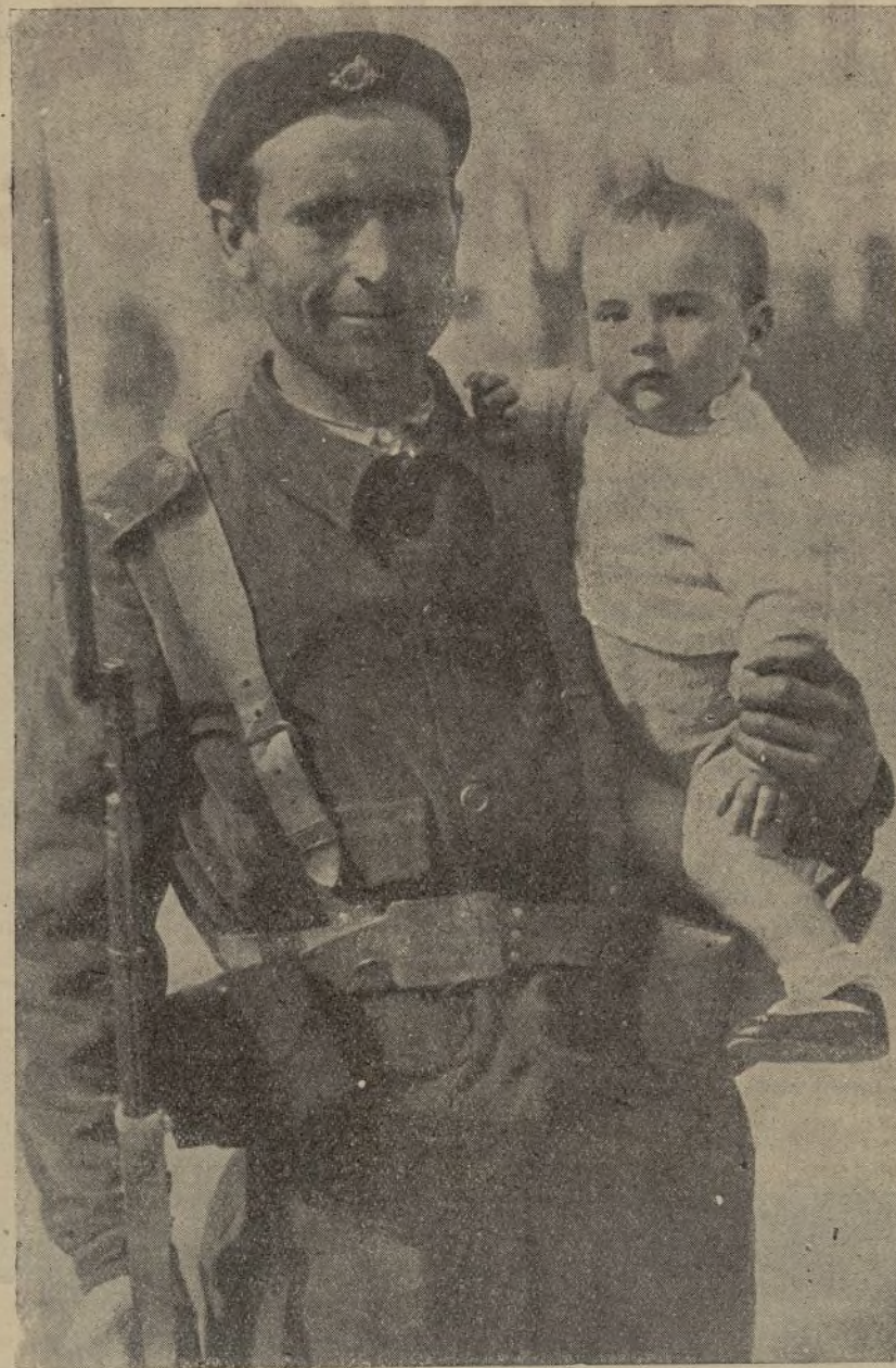
El soldado del pueblo, después de luchar con ardor en las trincheras, ha tenido unos días de descanso. Heo aquí, mostrando con orgullo a su pequeñuelo.