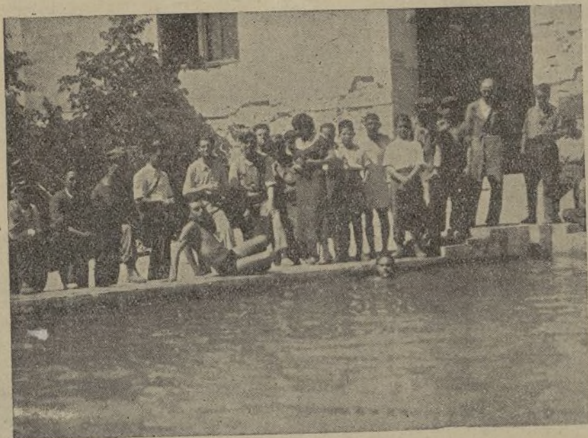
La piscina del Hogar del Soldado de la 14 División. Nuestra redactora conversando con el comandante del cuarto batallón de la 70 Brigada Mixta.

—Nos han producido—nos dicen—una gran emoción estos heroicos compañeros, que después de tanto tiempo alejados de sus familias siguen con un maravilloso entusiasmo esta obra comenzada por to-