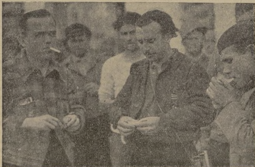
En las horas de paz, los jefes del Ejército Revolucionario charlan y fuman tranquilamente.

Ellos están acostumbrados, como cuervos que son, a carne humana. Ellos no satisfacen sus apetitos con otra clase de alimentación, y nosotros, comprendiendo lo que son, hemos de redimir el paroxismo de sus locuras depravadas, enviándoles un digestivo que podemos y debíamos haberles suministrado ya: ¡METRALLA!