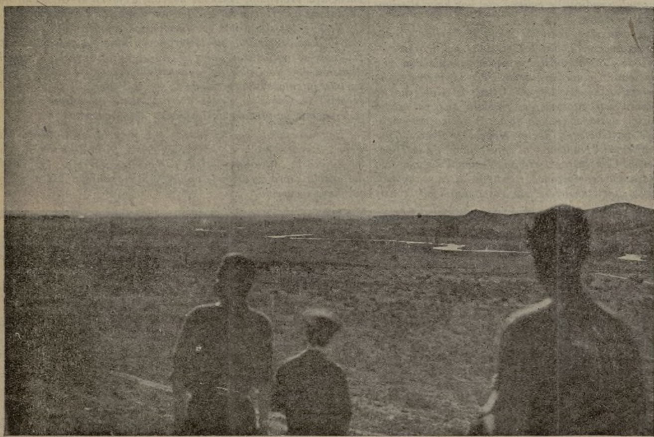
El Manzanares. Junto a sus aguas se está librando la batalla del progreso contra el oscurantismo. Al fondo, el Cerro Rojo. Nuestros soldados contemplan el Cerro, símbolo de la reacción.

ESTE NUMERO HA SIDO VISADO POR LA CENSURA