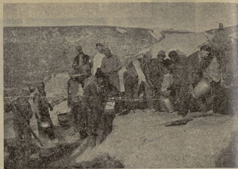
La cocina al aire libre. Los cocineros preparan la comida para los combatientes.

Por encima de tópicos y sofismas nosotros afirmamos: "No somos religiosos. Actuamos como revolucionarios que usan del eclecticismo de sus concepciones para adaptarlas. Pero en un plano de eficacia. No consagrando nuestra dictadura interna y menos negándonos a acep-