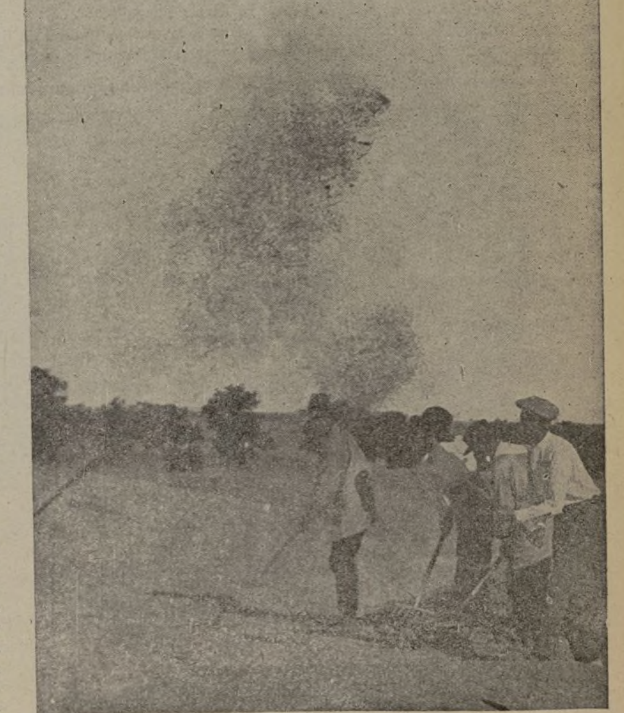
Trabajo, hambre, sacrificios infinitos les ha costado a nuestros campesinos la magnífica cosecha que dora los campos. Hoy, satisfecho, mira alegre y con fiado el porvenir.