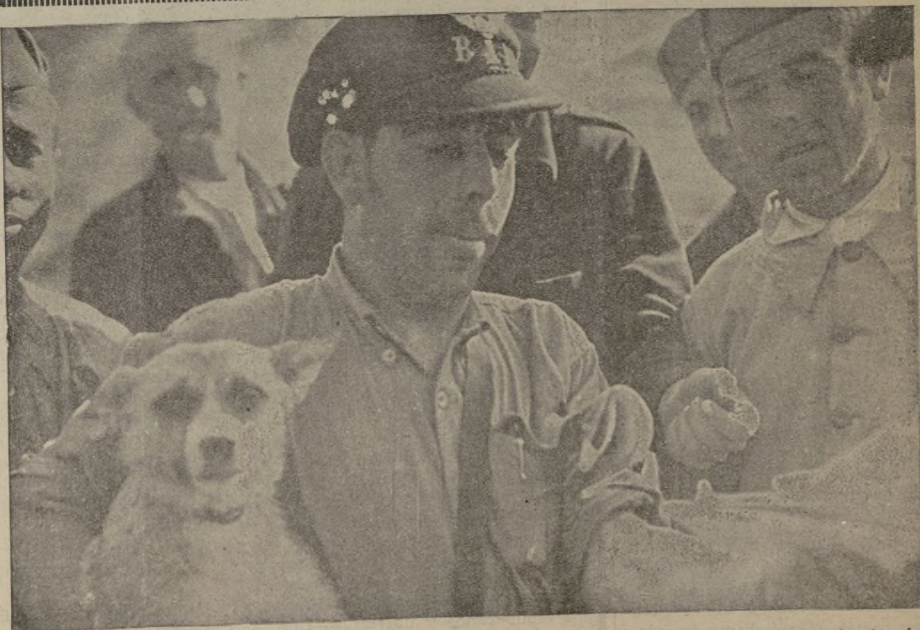
Ha llegado el correo. Los soldados corren a recibir la carta de sus padres, sus hermanos o su novia, que les traerá unas horas de alegría.