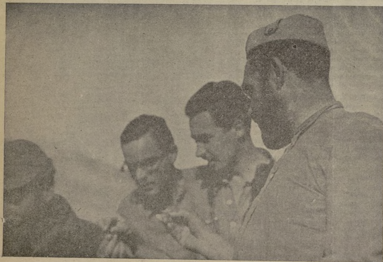
También hay africanos antifascistas, que valerosamente combaten al lado de las tropas leales. He aquí a un moro —pecho fuerte y barba espesa— conversando amigablemente con los soldados de la Revolución.

para deshacer los equívocos fomentados en torno a nuestra actuación por elementos mal intencionados. Las Juventudes Libertarias, Organización juvenil con millares de afiliados en el frente aragonés e igualmente en otros frentes, han de poner de manifiesto todo cuanto han dado y dan a la guerra de independencia que contra el fascismo sostenemos. Las Juventudes Libertarias explícitamente declaran que no