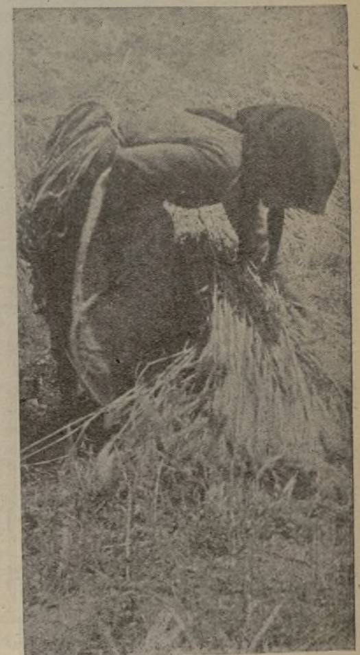
¡Soberbia estampa castellana! La campesina recoge amorosamente el trigo, que dará la victoria a los soldados de la Revolución.

—Tenemos confianza en el porvenir de España. Esperamos hacer una labor grande. Tenemos técnicos y ganas de trabajar. Muy pronto la Federación Regional de Campesinos de Castilla y la Federación de Trabajadores de la Tierra, estrechamente unidas, controlarán a la totalidad de los campesinos de la región castellana. Demostraremos a España y al mundo entero que los campesinos están capacitados para superar la producción en todos los aspectos y darse un régimen de igualdad y de justicia.