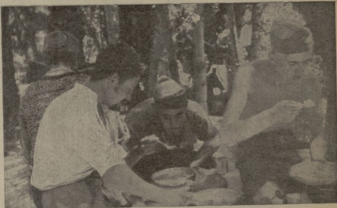
Soldados del Ejército Popular Revolucionario, después de luchar valientemente contra el fascismo, comen en franca camaradería.