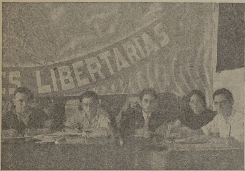
La presidencia del Congreso Provincial de Cuenca.

Se trataron puntos de interés provincial y nacional para las juventudes, y entre ellos destacaremos el que en toda la provincia se abra una suscripción con des-