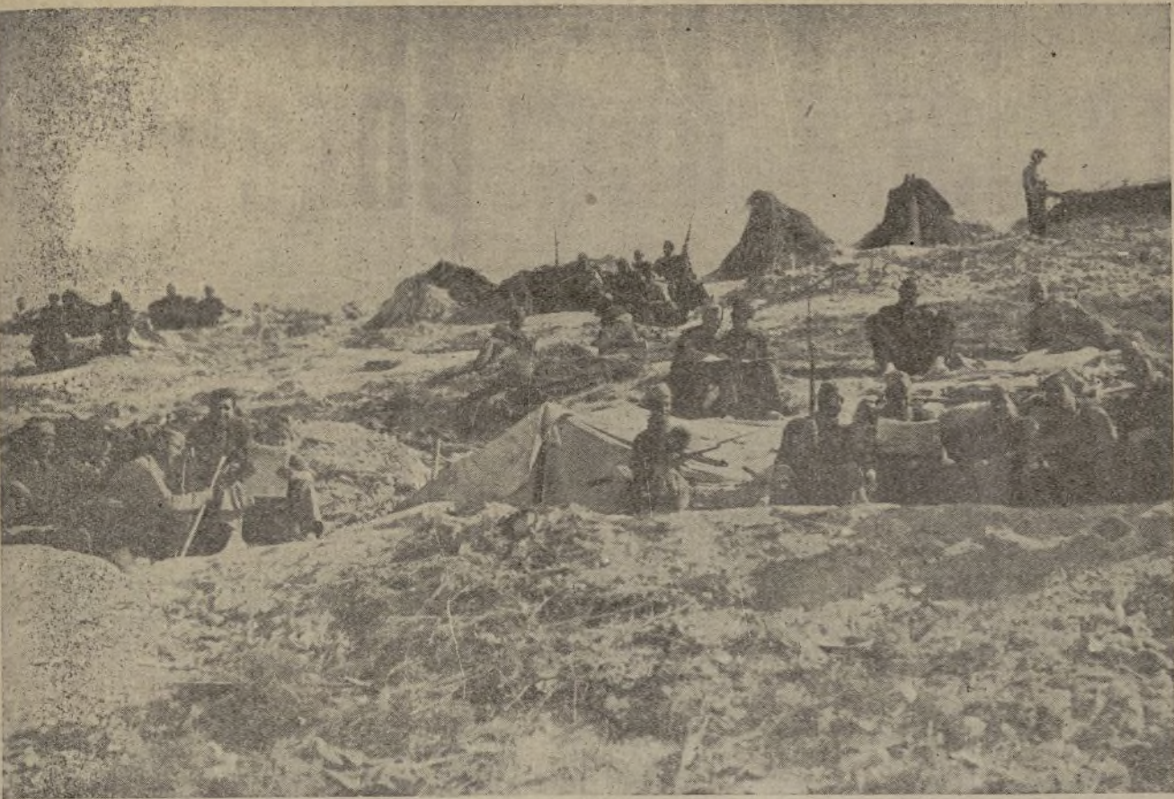
En las trincheras. Los soldados del pueblo luchan con tesón por la Libertad.