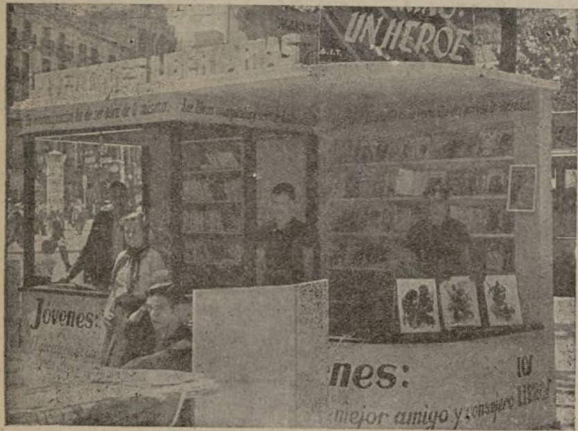
Las Juventudes Libertarias no sólo se dedican a luchar contra el fascismo. También luchan contra la incultura. He aquí un puesto de libros establecido por las Juventudes Libertarias de Barcelona.

ESTE NUMERO HA SIDO VISADO POR LA CENSURA