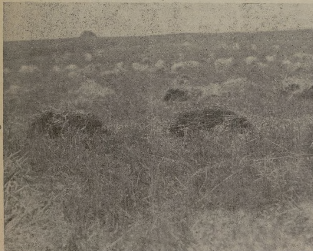
Los trabajadores del agro y la Federación Regional de Campesinos han trabajado de firme para sacar adelante la cosecha. La Naturaleza, generosa, ha sabido premiar sus enormes sacrificios, entregándonos esos inmensos mares de espigas doradas.