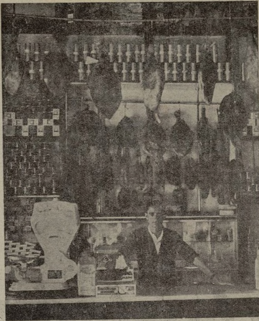
Madrid pasa hambre. En tanto, los que le abandonaron en sus horas de angustia, se "sacrifican" ante esta vista.