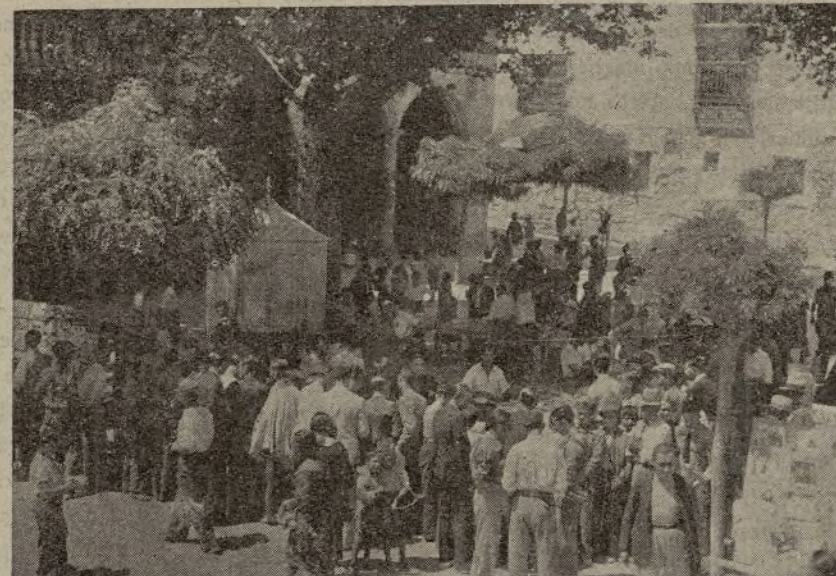
El pueblo se agolpa para adquirir libros.

giones en su exilio trágico y forzado. Contados camaradas, pues, llevan actualmente el peso de las labores de la Organización. Mas, a pesar de esto, nuestro movimiento resurge. No con la celeridad vertiginosa que nosotros deseáramos, pero sí de