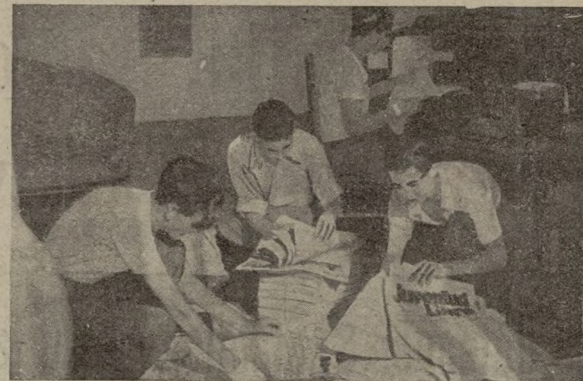
Compañeros encargados de la distribución de JUVENTUD LIBRE

pañeros conversando sobre la labor cotidiana. Unos letrados que sirven de guía indicando el trabajo que cada departamento realiza: "SECRETARÍA GENERAL", "PRENSA Y PROPAGANDA", "ORGANIZACIÓN", "SECCION MILITAR", "CULTURA", etc.