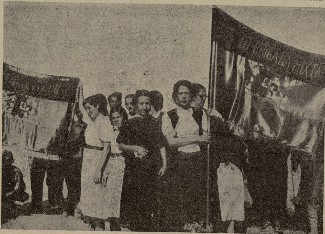
"Mujeres Libres" ha entregado a los heroicos combatientes de la 70 brigada mixta una bandera. ¡Estos son nuestros héroes! ¡Viva la 70 brigada!