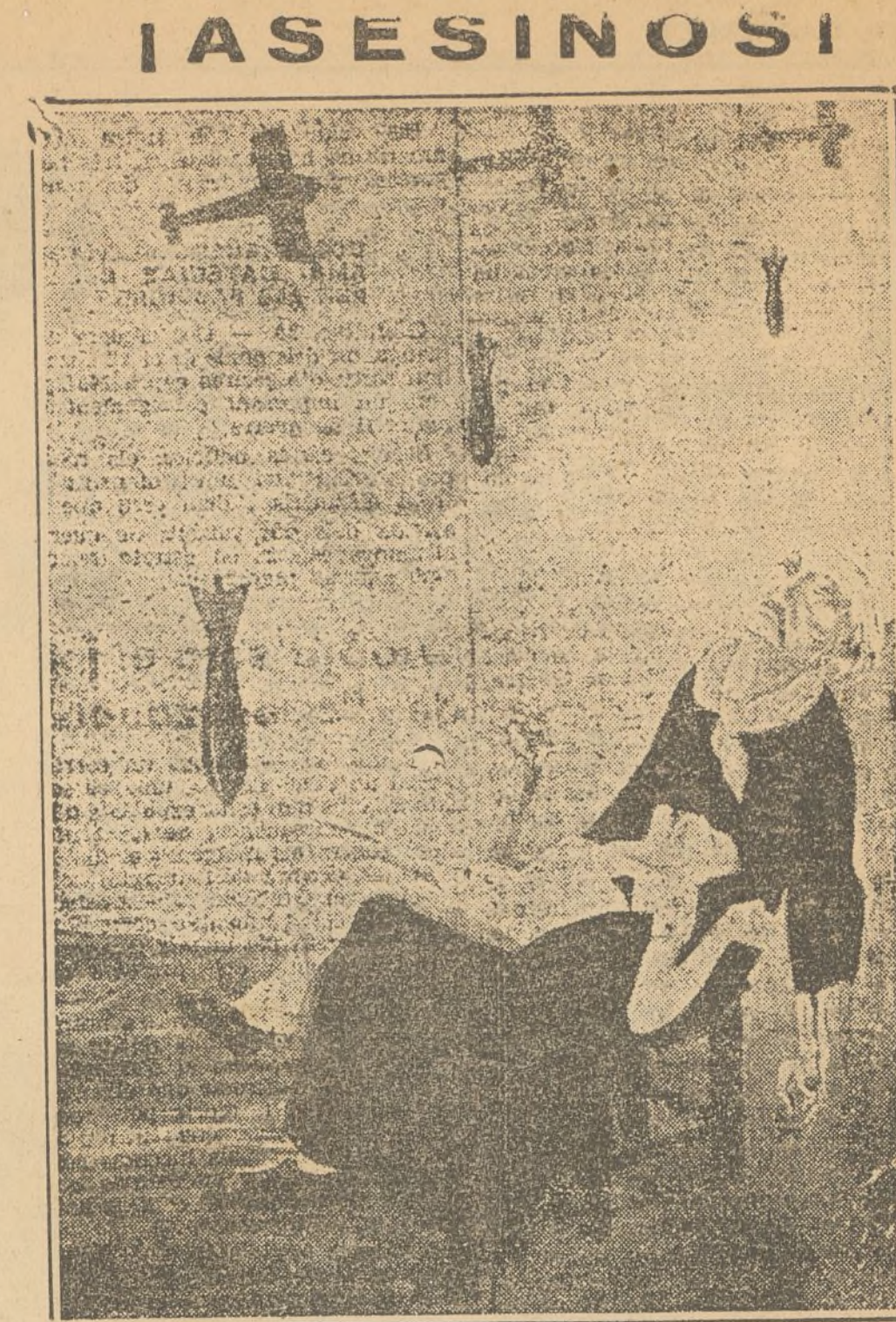
Reproducción de un cartel, de cinco metros de altura, colocado en Barcelona, obra del dibujante Dan-son. El artista catalán ha recogido ciertamente un momento de la acción "humanitaria" y "patriótica" de los fascistas.