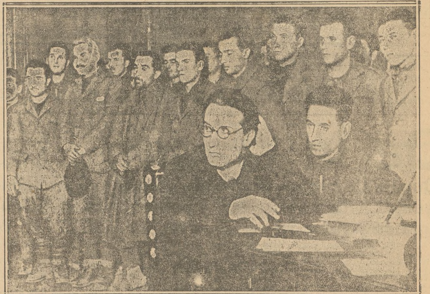
Grupo de soldados italianos hechos prisioneros en el Centro, escuchando una alocución del general Miaja.

LA TARDE EN LOS FRENTES DE MADRID. Madrid.—Persistió la calma durante la tarde en los sectores de la capital. Continúa el mal tiempo, aunque esto no tiene relación alguna con la paralización de las operaciones, que dura desde hace unos días. Ha habido tiroteos en las avanzadas y algunos duelos de artillería sin consecuencias. La artillería fasciosa ha vuelto a tirar sobre la población, aunque con menos intensidad que otras veces, pero causando daños y víctimas. Siguen pasándose al ejército leal soldados fugitivos de los frentes rebeldes.