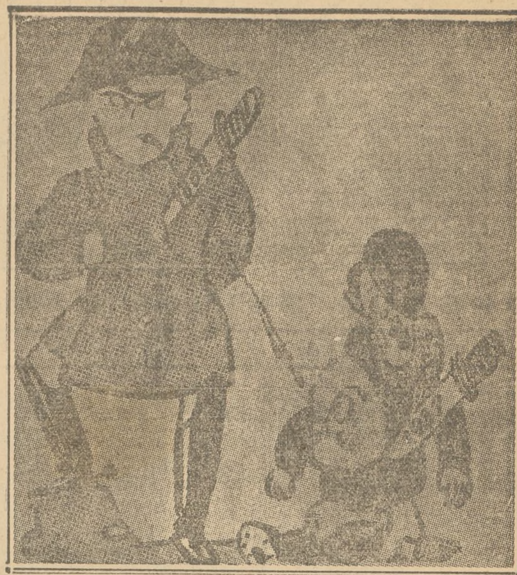
NAPOLEON: No merecís más que mi mayor desprecio.

UNA BUENA FORTIFICACION, ES LA SEGURIDAD DE QUE EL FASCISMO CRIMINAL NO PASARA. CON EL CUERPO PEGADO A LA TIERRA QUE TE VIO NACER Y LA MIRADA ALERTA, PROCURA, GUDARI, DAR A TUS MUNICIONES LA DIRECCION QUE ROMPA EL CORAZON DEL ENEMIGO SIN ENTRANAS.