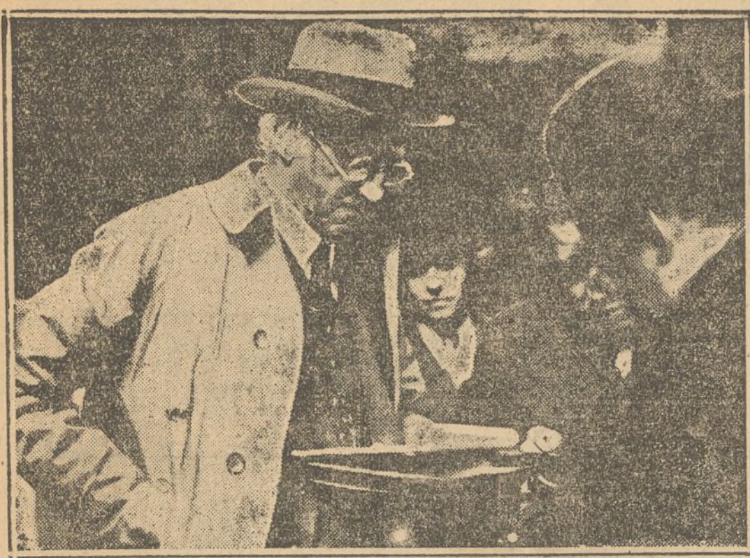
Después de su viaje por la Península, el Dean de Canterbury ha hecho manifestaciones sobre el proceder criminal de los fascistas, que han causado sensación. Aquí lo vemos hablando con los periodistas, al llegar a París.

SOLIDARIO: PIENSA CUANDO ESCRIMES LA PALA O EL PICO QUE DEL SUDOR DE TU ESFUERZO YA NO SE APROVECHA TU EXPLOTADOR, EL CAPITALISTA. TU PATRON ES EUZKADI Y EL FRUTO DE TU RENDIMIENTO TU PROPIO BENEFICIO ES.