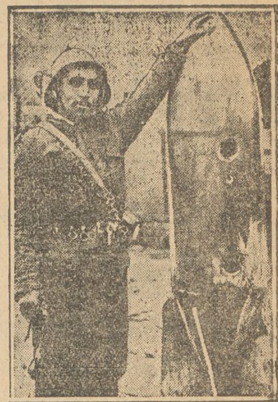
Bomba de doscientos kilos de fabricación alemana, de las que emplean los aviadores "nacionales" en su obra de "engrandecimiento" patrio.

ANTES DE CRISTO. — Hasta la aparición de Cristo, dos esfuerzos principales existieron por humanizar esta dura condición. La escuela de Grecia, de origen filosófico, empeñada en dulcificar lo más posible la suerte del esclavo interesándose en los negocios comerciales y favoreciendo su manutención y la escuela judía, de origen religioso, que limitando la propiedad privada (inviolabilidad de la herencia, rebaja periódica de las deudas, prohibición