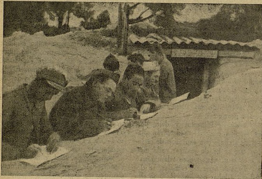
Soldados de nuestro Ejército escribiendo en la misma trinchera. Esto es obra de Milicias de la Cultura.