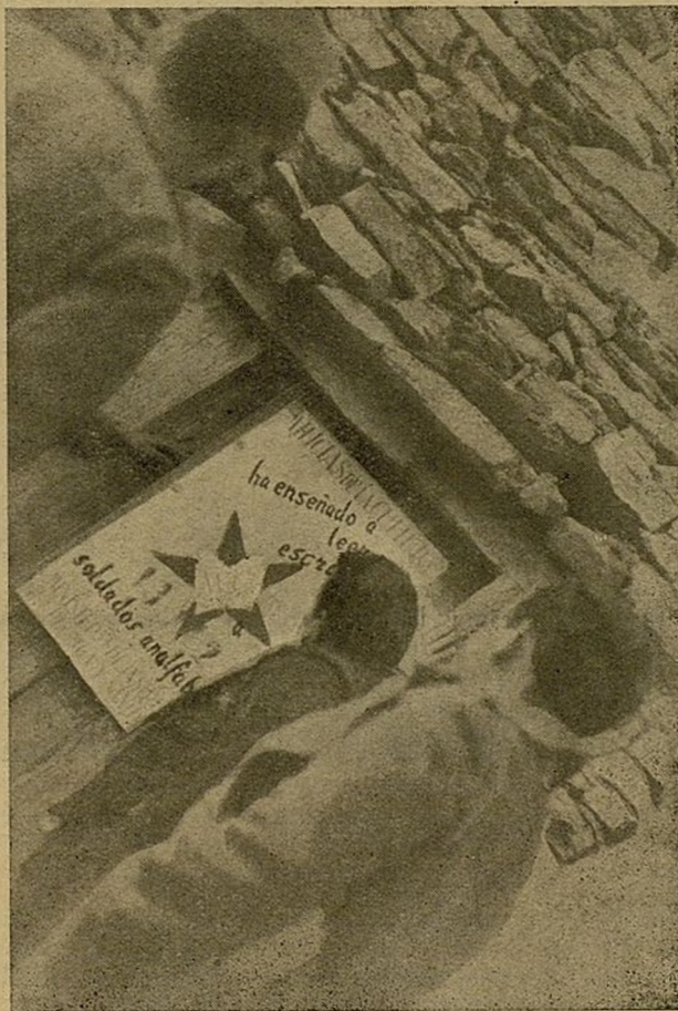
En las trincheras los soldados leen los cartiles puestos por Milicias de la Cultura.

tado treinta películas distribuidas en seis sesiones, habiendo habido cintas instructivas, industriales, científicas y recreativas. En estas sesiones de cine, y aprovechando el asunto de las películas, se dieron charlas que fueron aprovechadas por los cursillistas para ampliar los conocimientos que durante las clases se les daban».