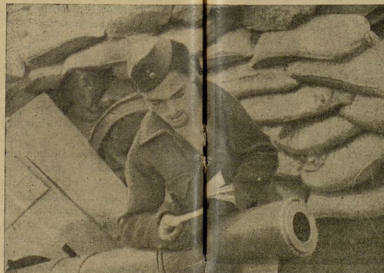
Un artillero leyendo al pie del cañón. Esto es obra de Milicias de la Cultura.