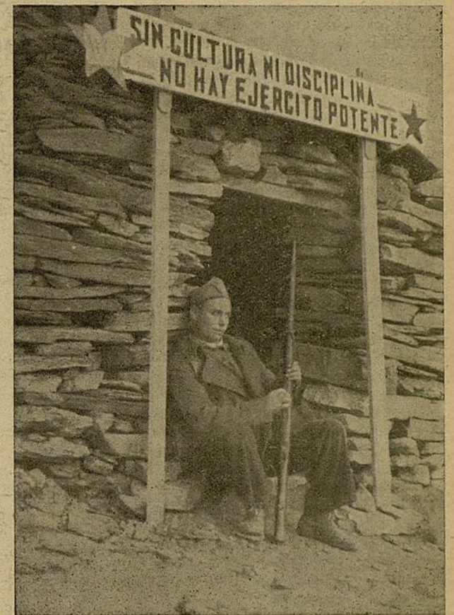
Un refugio en cuya entrada se ve una consigna de Milicias de la Cultura.

Milicias de la Cultura también ha escrito centenares de artículos en la prensa del frente, dirigen también y colaboran en todos los periódicos murales de los batallones. Ha organizado y dirige las bibliotecas que existen casi en las mismas trincheras y también las que hay en los cuarteles y hogares de los combatientes. Las Milicias de la Cultura toman una parte muy activa en todos los rincones de cultura.