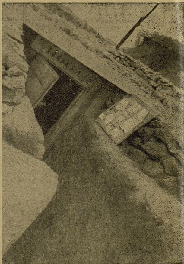
Las Milicias de la Cultura han creado hogares como este, en las mismas trincheras.

Milicias de la Cultura proyectó un internado para oficiales. Esta idea ha merecido no sólo la aprobación, sino también el auxilio del Comisariado de Guerra. Esta idea de gran transcendencia ha comenzado a ponerse en práctica en la 65 División, perteneciente al 2.º Cuerpo de Ejército de nuestro frente. El Director de estu-