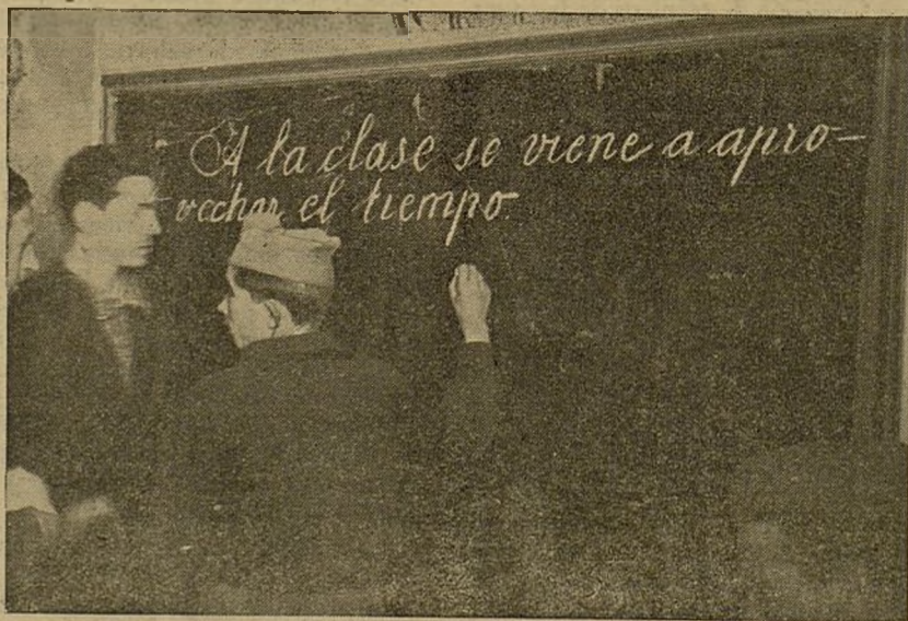
Un Miliciano de la Cultura en la clase.