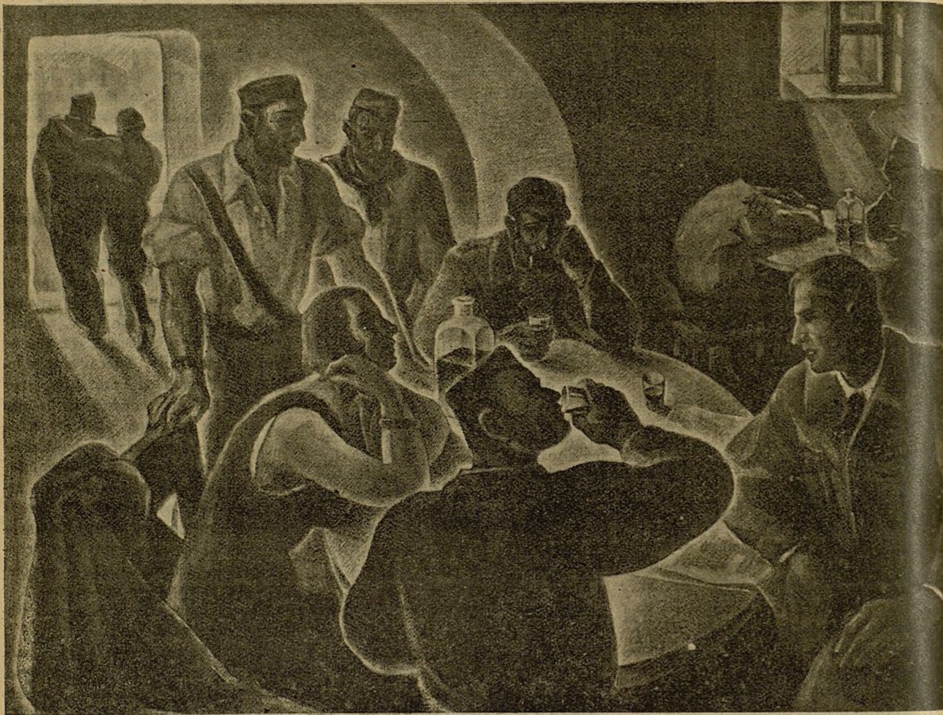
Los maestros de la F. E. T. E. fueron a los sitios donde estaban los milicianos para instruirlos

Hace un año, por estos días, todavía teníamos la impresión de satisfacción y de inquietud que nos había dejado la lectura de un suelto que vimos impreso en las columnas de casi todos los periódicos. Nuestra sensación de satisfacción era porque nuestra gloriosa F. E. T. E. ponía en marcha una obra que estimábamos necesaria; nuestra inquietud nacía de que si la realización cumpliría, llenaría la grandiosidad del propósito. Y hemos de decir lo que entonces, también entre fríos, oyendo también los disparos crueles de la artillería invasora leímos en un periódico. Era «Mundo Obrero» del 29 de diciembre de 1936, decía, como otros muchos periódicos del día, esto: