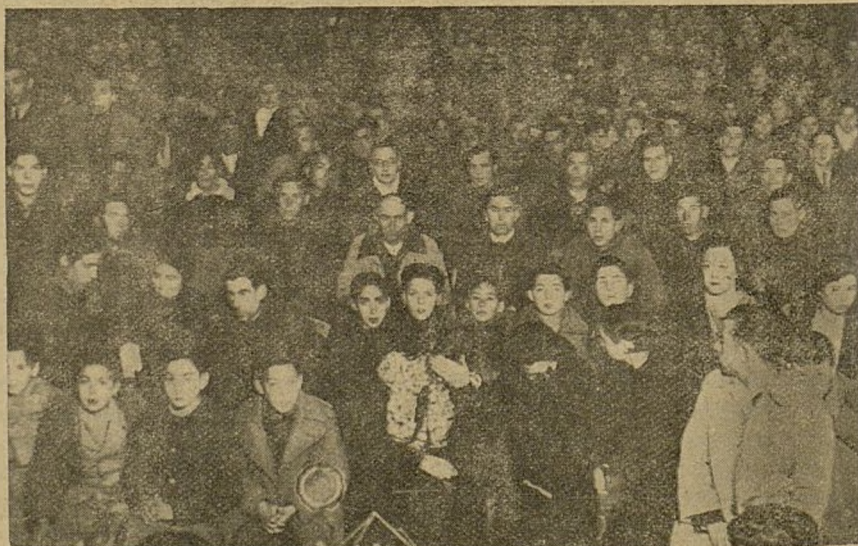
Una vista de la sala en el acto de homenaje al Ejército.