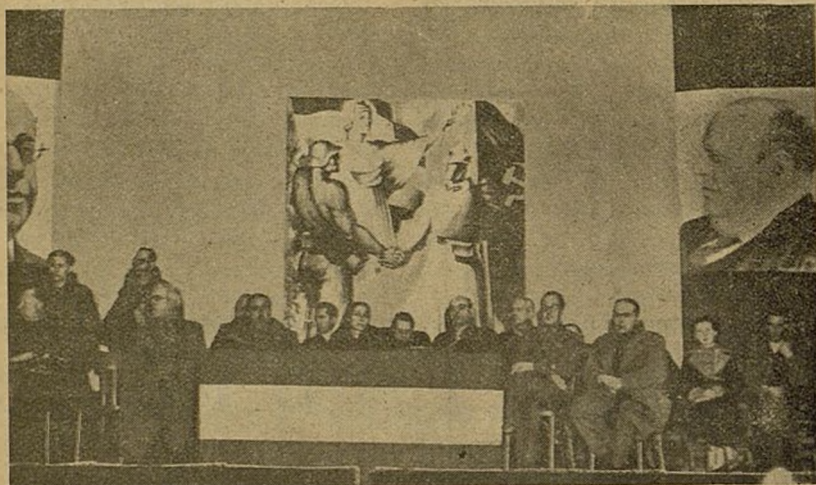
La presidencia del acto de Homenaje al Ejército dedicado por los maestros de Madrid.