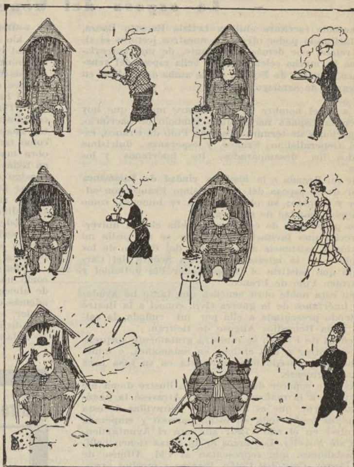
El portero y los vecinos excesivamente obsequiosos

Los hombres sinceros son tanto más dignos cuanto más alta y poderosa es la persona ante la cual deben expresarse.