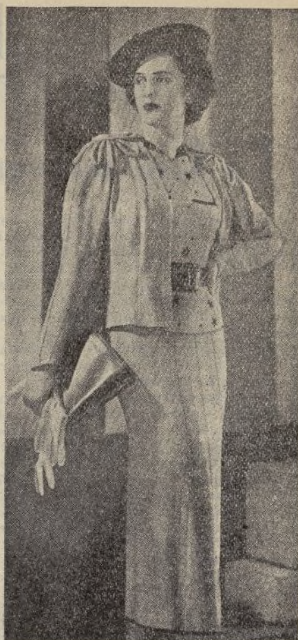
He aquí un elegante modelo presentado por KURBIN, de Berlín.