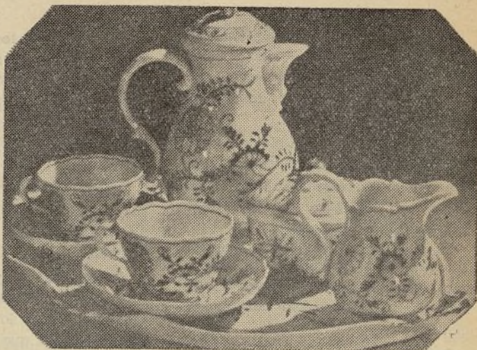
Juego café, porcelana Sajonia, de gusto austero y delicado

El valor nutritivo de un huevo fresco equivale a 40 gramos de carne, y es un alimento sano, digestivo y agradable y se presta a la variación. Por el azufre y el fósforo que contiene constituye un elemento reparador de las células cerebrales. No es recomendable, sin embargo, para las personas que sufren del hígado, y, sobre todo, deben prescindir de él las que padecen cólicos hepáticos. La coleslerina de la yema se acumula en la vesícula y provoca los famosos cálculos de la coleslerina, que, llegando a veces a tamaño de una castaña, se encuentran con mucha frecuencia en dicha víscera. Así resulta que ciertas personas basta que beban algunos huevos para que sufran automáticamente un terrible cólico hepático.