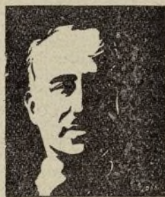
FRANCO, forjador de la nueva España, protegerá a la familia.