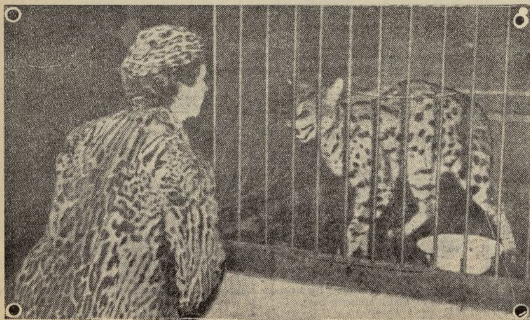
LA MODELO Y SU ORIGINAL

Los abrigos de piel de pantera o de leopardo y en general de todos los felinos de estas especies, están ahora muy en boga. He aquí un modelo de abrigo y de gorrito presentado en París para esta temporada. La señorita maniquí tuvo la honorada de visitar el Parque Zoológico, y a juzgar por la actitud del felino no le satisfizo mucho la visita de quien llevaba una piel, quizá de algún hermano suyo.