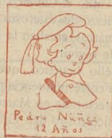
Colegio P.P. Misioneros Segovia