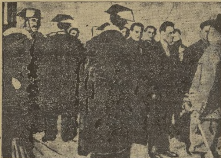
Los procesados por los sucesos de Bujalance al llegar ante el Tribunal de guerra para ser juzgados