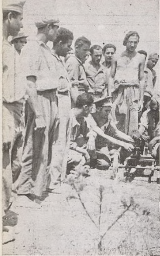
Camino de las trincheras.

Calor asfixiante. Diríase que todo queda paralizado con este sol agotador que enerva los sentidos. Camino de las trincheras, nadie diría que atravesamos "el teatro de la guerra". No se oye un tiro, todo respira calma. Ciertamente que con este sol hasta los fusiles deben agotarse y reclamar inactividad. Campos de trigo, segado ya--labor de la República, colaboración entusiasta de sus soldados--no se piensa en que a menos de un kilómetro se encuentran las fuerzas de la traición.