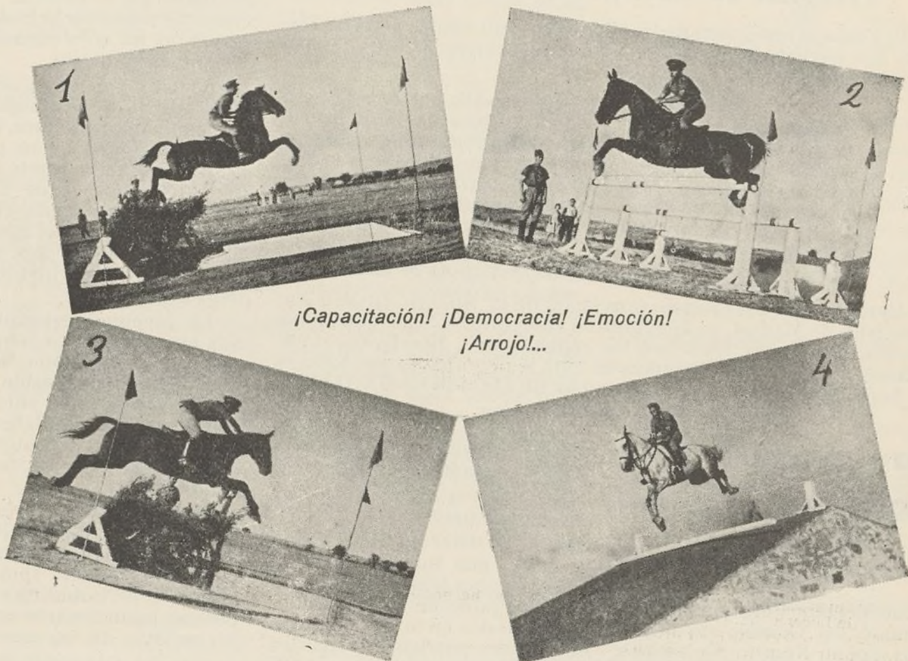
¡Capacitación! ¡Democracia! ¡Emoción! ¡Arrojo!...

No queremos cerrar estas líneas sin saludar con toda cordialidad y fervor