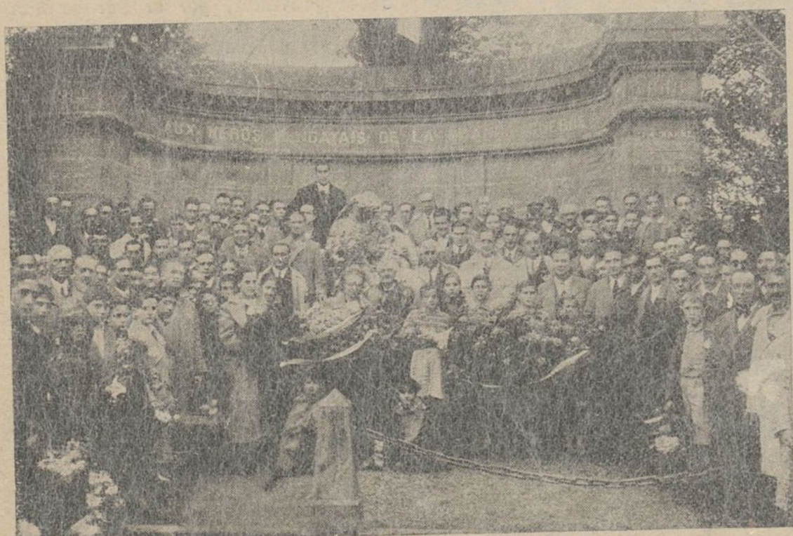
EN HENDAYA — A los héroes franceses de La Gran Guerra, el 11 de Noviembre del corriente año, este núcleo de antifascistas iruneses, han rendido el homenaje de su admiración a la par que conmemoraban el levantamiento del asedio de Irún durante la anterior carlistada.