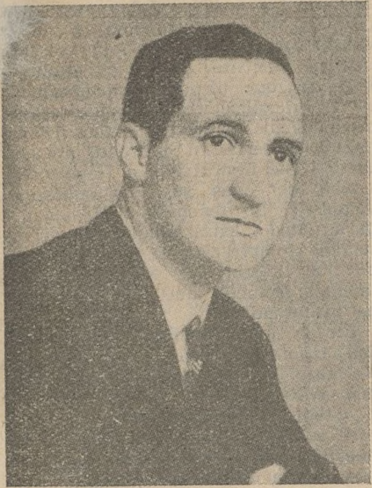
José Antonio de Aguirre

Euzkadi, una vez más, reitera ante la confederación de pueblos ibéricos, el ejemplo de su democracia, innata y esencial.