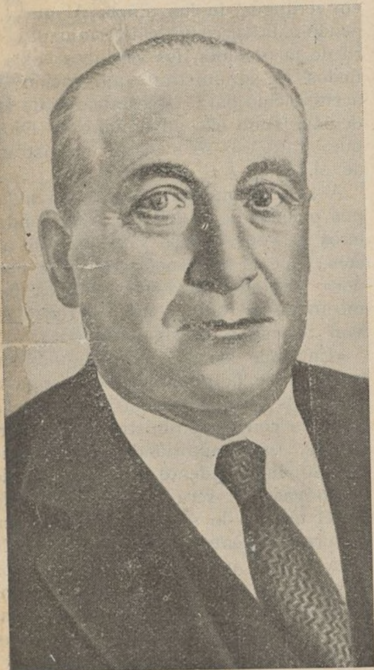
Francisco Largo Caballero

Ha monopolizado y acaparado, en mayor proporción que nadie, el odio burgués. ¡A su mayor gloria revolucionaria!