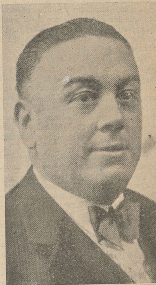
Diego Martínez Barrio

¡Todavía la ralea fascista ensucia y emporca el sagrado suelo de Euzkadi esclavizada!