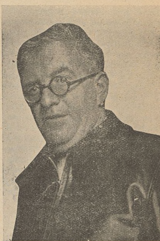
Julio Alvarez del Vayo

Amigos franceses de esta España coaligada; aquellos que aspiráis a un porvenir más luminoso y feliz; los que anheláis un régimen de más libertad humana y mayor justicia social; vosotros, los que sentís en vuestro espíritu y en vuestra carne nuestro dolor y la solidaridad de nuestras trágicas congojas y de nuestra miseria; ¡hermanos franceses, sabed desde ahora que si el fascismo internacional nos aplastase y masacrare, los Pirineos dejarían de ser una consagración de paz y fraternidad a través de los cuales os tendemos con viril amor los brazos desarmados para apretar vuestras manos y saludaros, para convertirse en unas foscas y tenebrosas posiciones erizadas de ametralladoras y cañones teutónicos a