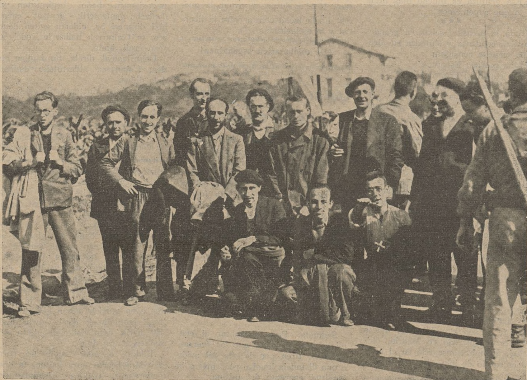
Esta fotografía, obtenida para el «New-York Times» y «conquistada» en Tolouse por Campón, dice en su pie original: «Rehenes "nacionalistas" fugados del fuerte gubernamental de Guadalupe, fotografiados en Irún, delgados, cansados, pero sonrientes.»

Esta falange, sonriente, de traidores no se fugó —¡mentira!— de Guadalupe. Fueron libertados por exceso de sentimentalismo y falso concepto de caballerosidad, por nosotros mismos. ¡Así paga el diablo a quien bien le sirve!