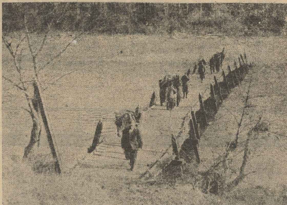
He aquí el puente que las fuerzas vascas tendieron en Asturias sobre el Nalón para que los batallones de este sector realizaran una fecunda labor. Lo construyeron los del batallón de Euzko-Indarra

¡Cuántos se lanzarían a atravesar Bidasoa!