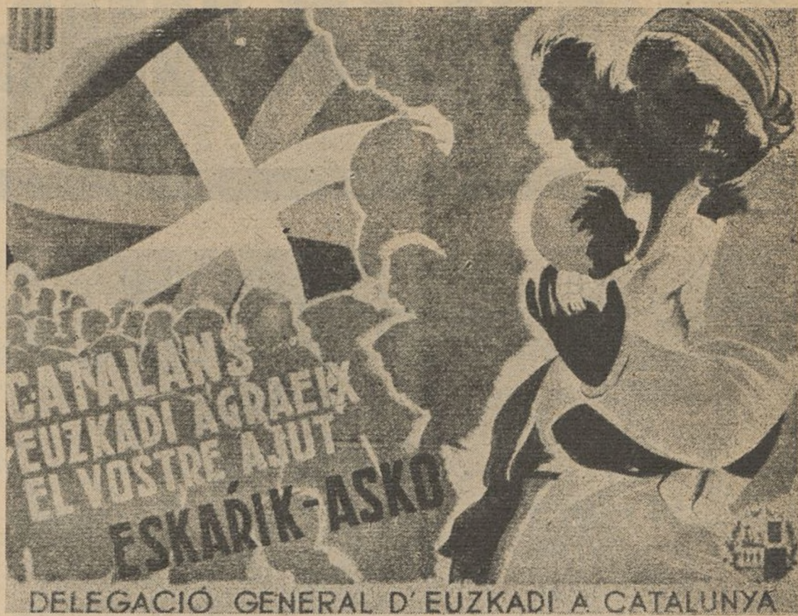
Cartel editado por la Delegación General de Euzkadi expresando el reconocimiento de nuestro querido pueblo a Cataluña