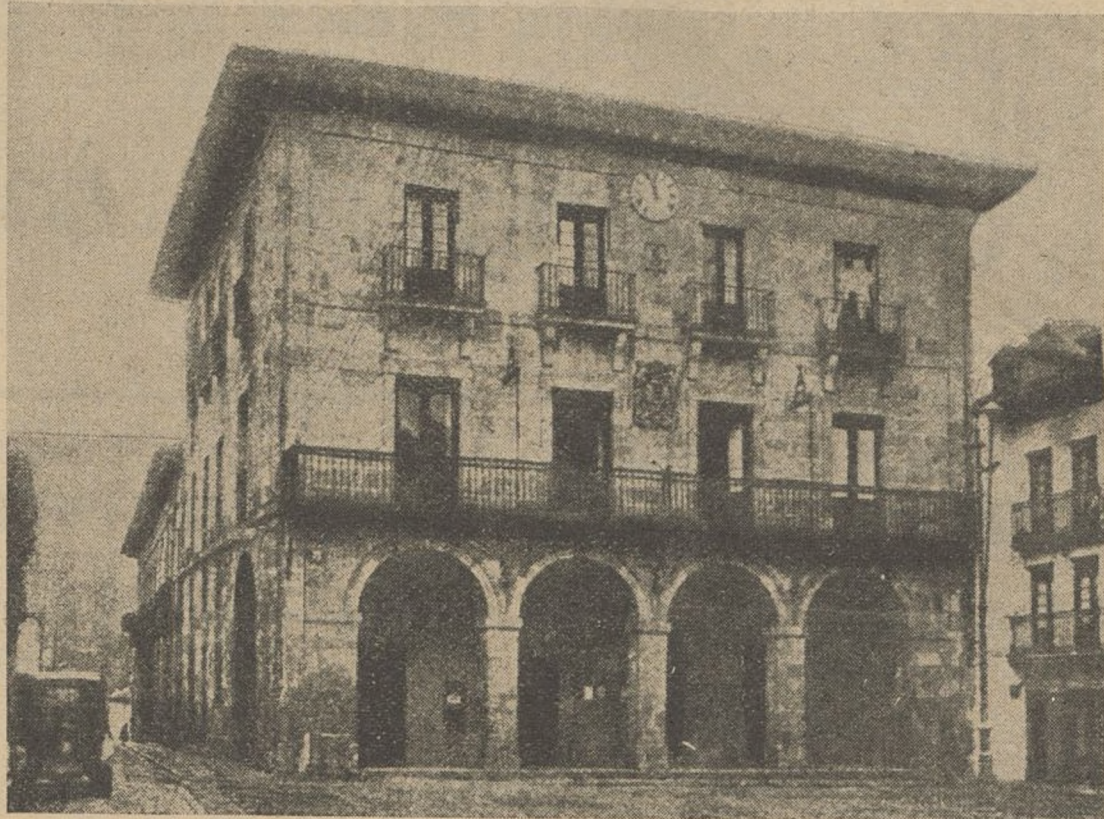
Esta fotografía representa a la Casa Consistorial de Guernica antes de ser destruida por los aviones criminales del fascismo internacional. Son hechos que deshonran a los traidores. ¿Quién dijo en el extranjero si existía Guernica? Ahí lo tiene, triste y melancólico ante la maldad de de unos hombres sin entrañas.

Todos los sectores antifascistas proclaman en sus órganos de expresión su adhesión y acatamiento a las consignas que determina el momento histórico en que luchamos y que postula el Gobierno: mando único, disciplina, acatamiento al Gobierno, respeto y estimación recíprocos, tregua en las luchas políticas, unidad sindical.