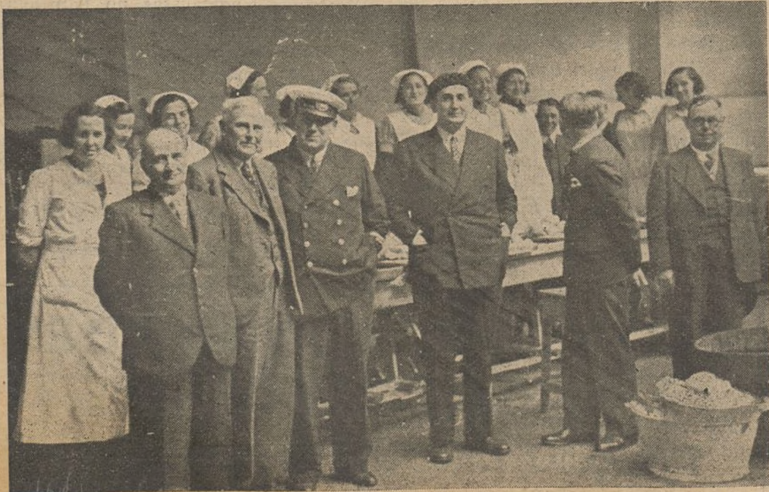
El ministro de Comercio y Abastecimientos Ramón M. a Alda, del «Seven Seas Spray» visita diversos centros oficiales. La fusión de las autoridades de Euzkadi con los que han roto el bluff «del bloqueo de Bilbao» condición de las desvalidas masas vascas privadas de la penuria de substancias alimenticias, inenarrable el martirio, inenarrable el sacrificio de los vascos extranjeros.