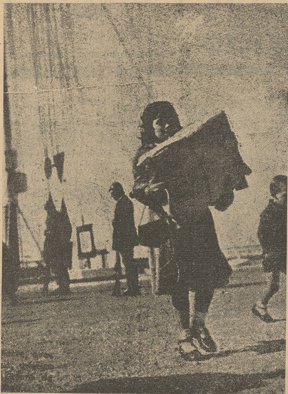
Los muelles de la capital del Midi en Francia, son testigos del éxodo de mujeres y niños que se ven precisados a evacuar la capital de Vizcaya. ¡Pobres niños, que en tan tierna edad se ven precisados a abandonar su patria por culpa de las hordas destructoras del fascismo!