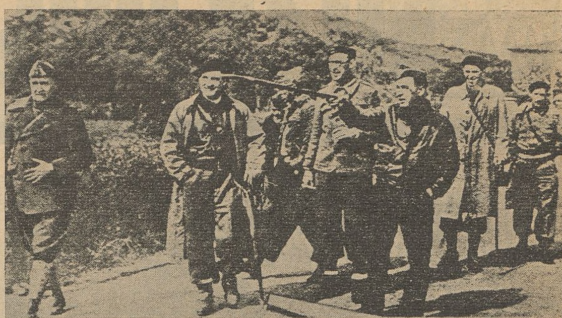
Los frentes de Euzkadi, entre las verdes montañas, son visitados continuamente por el Presidente del Gobierno regional, José Antonio de Aguirre con su Estado Mayor. Es la mejor forma de cerciorarse de su estado. Así son los gobernantes eúskaros.

¡Bien por los norteamericanos! ¡Duro contra los «gangsters»!