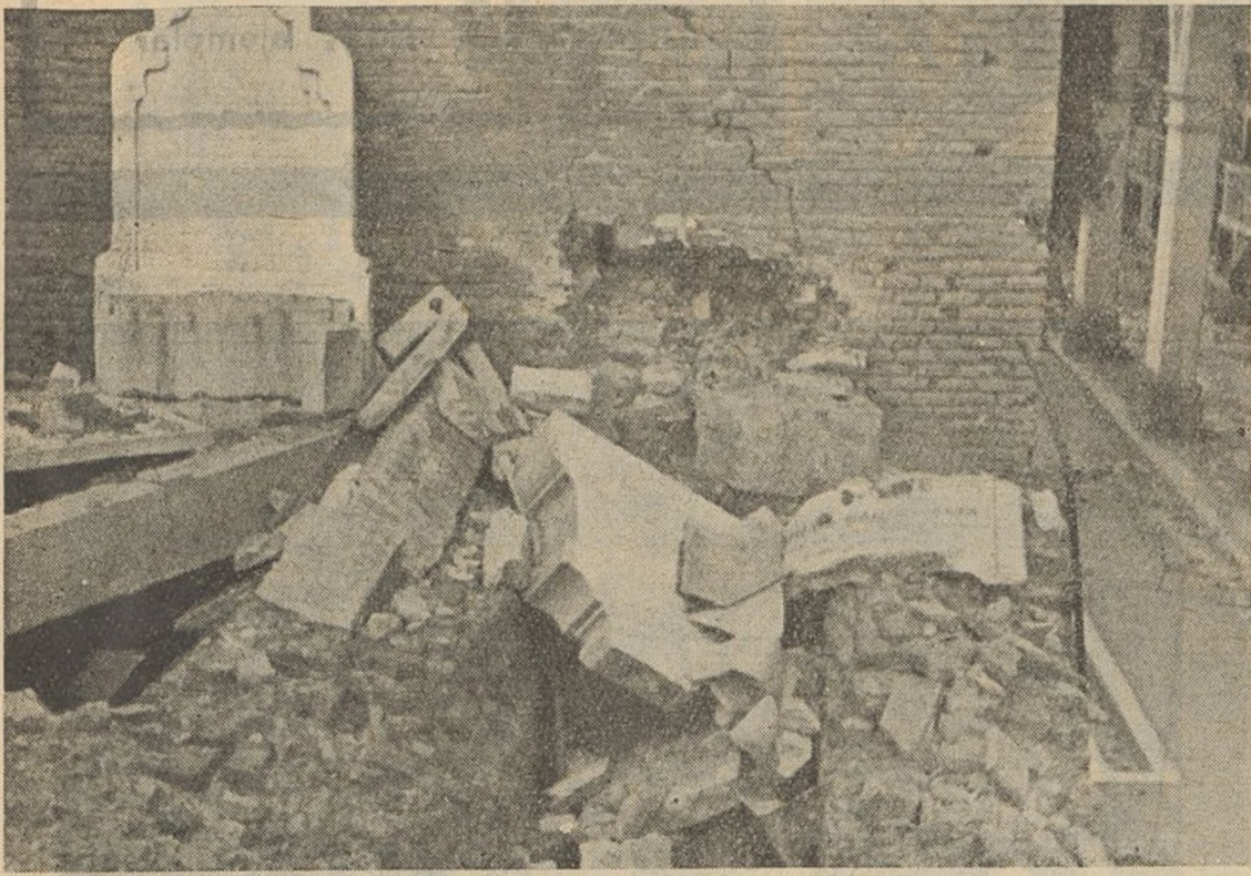
¡Cruel civilización nazi! Estas tumbas del recinto sagrado del cementerio de San Isidro, de Madrid, han sido destruidas por la aviación negra alemana e italiana. ¡Dejad a los muertos en paz en su sueño eterno!—hemos dicho muchas veces—. Los invasores, sin corazón y sin sentimientos han destruido dichas moradas.