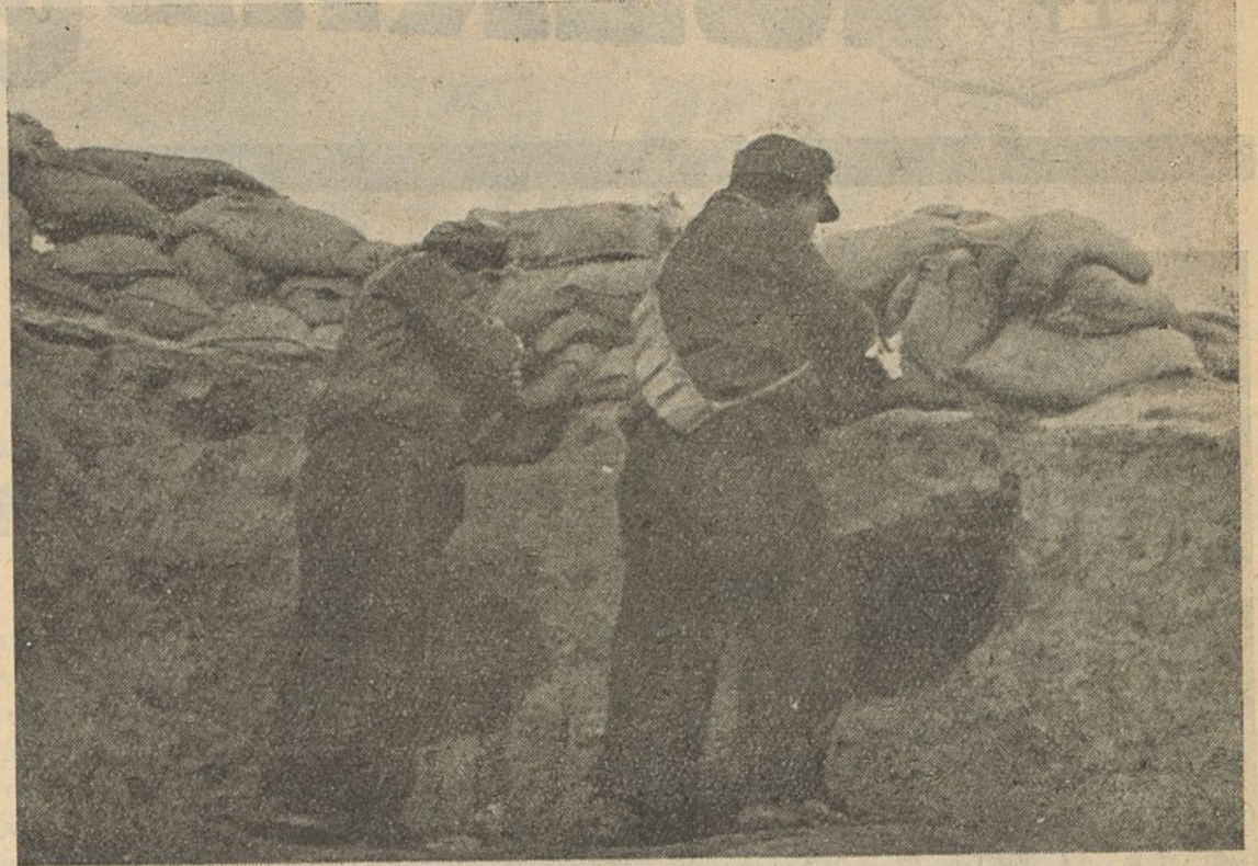
Parapetos en la carretera de Extremadura, en Madrid. Nuestros milicianos convertidos ya en Ejército Regular, disparan sus fusiles contra las posiciones enemigas.