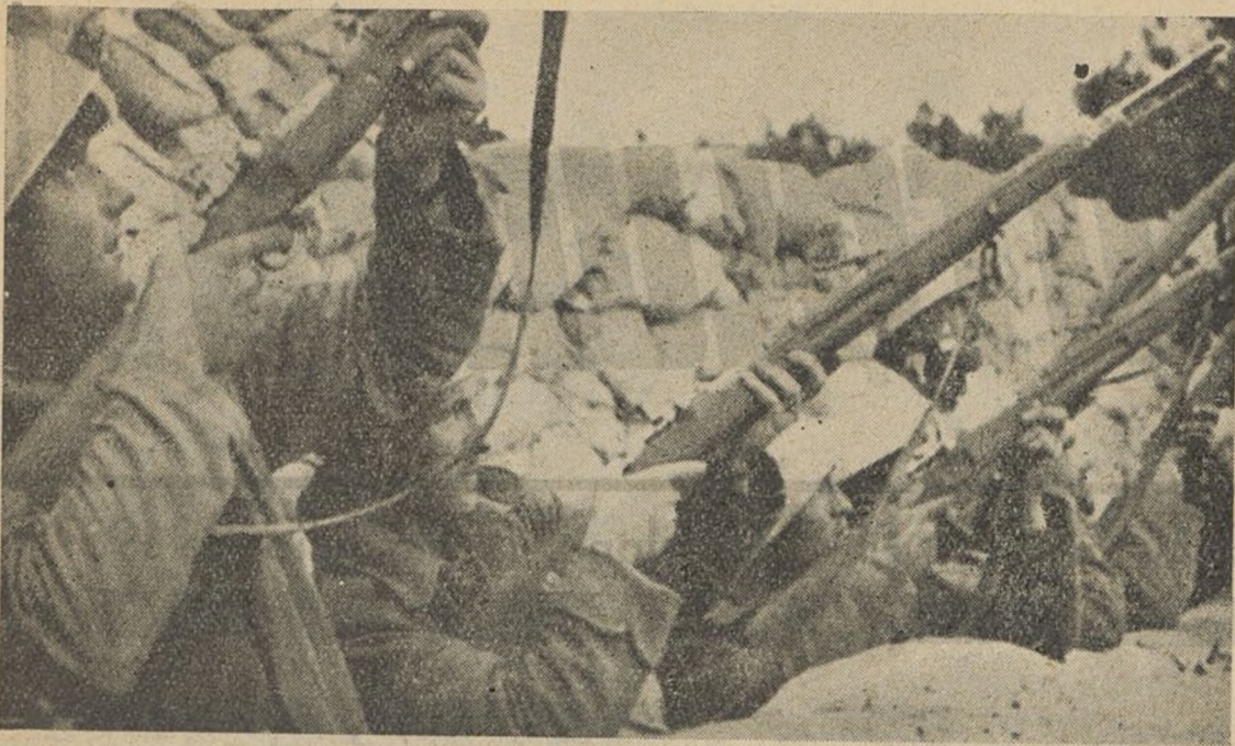
Estos soldados de Euzkadi enfilan sus fusiles contra los aviones destructores del pueblo vasco. La cantidad de aviones que bombardearon todas las posiciones defendidas por nuestros soldados, que ante aquel alarde de elementos destructores, no pudieron rendir cuanto se esperaba. Cumplieron su cometido con creces y se portaron como buenos soldados.