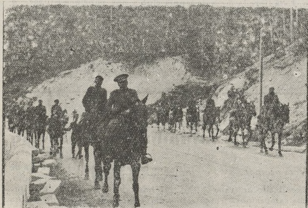
La caballería republicana. Al paso, en descubierta

Cuando la Aviación faciosa se acerca, tendeos en el suelo o buscad el refugio de una roca. Permaneced inmóviles mientras vuele encima de vuestras posiciones, y no corráis nunca, porque así os descubriríais, haciendo además el mejor blanco para la ametralladora y las bombas de mano del aparato enemigo.