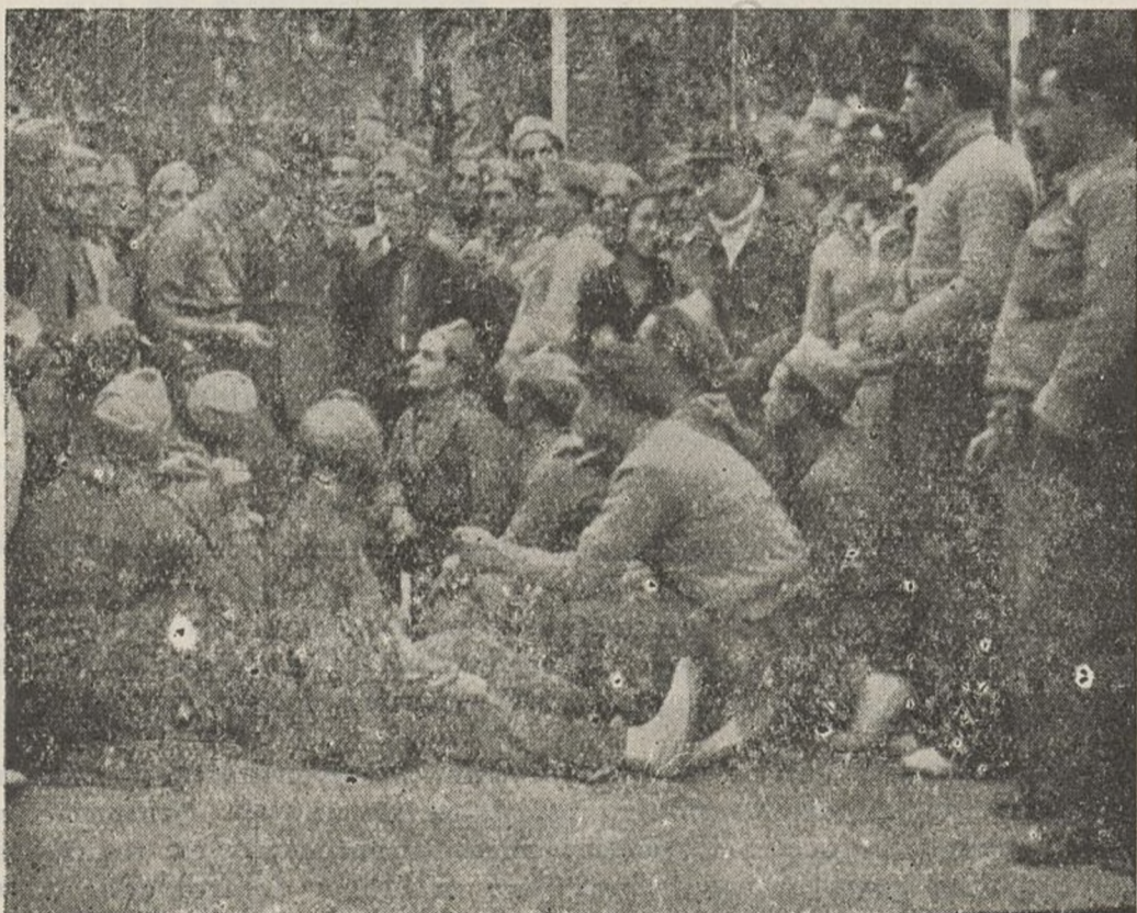
En un momento de descanso, aprovechando cualquier ocasión, el comisario habla con sus soldados

nista, sino simplemente trabajar de sol a sol y no interesarse más que de sus bancales de trigo, para el sustento de los suyos, nosotros hemos empezado un trabajo de acercamiento y al mismo tiempo que les ayudamos material-