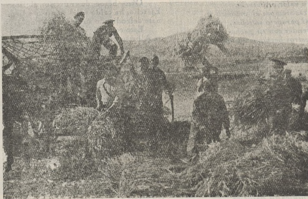
Los trabajos de la siega están casi acabando en nuestro sector. Magnífico ejemplo el de nuestros soldados. En nuestras columnas vamos recogiendo los datos de esta labor de guerra. En el número próximo hablaremos de las tareas de los soldados de Ametralladoras

La vanguardia debe exigir a la retaguardia el máximo esfuerzo para atender a las necesidades de la guerra.