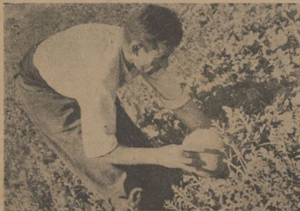
¿Estará encanada? Hoy que evitar el error, pues son para los compañeros de la trinchera, y a ellos debe ir lo mejor de nuestros productos...

productivo, creando esta magnífica huerta, como asimismo la de nuestra División, hemos de resaltar al mismo tiempo, la meritoria ayuda que ha encontrado en el Comisario de su unidad, como igualmente en