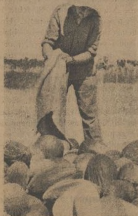
¡Duros y dulces! Nacieron bajo la caricia de los proletarios de la 34, y por ellos, que hoy combaten por la Independencia, han de ser consumidos.

Como dicen que prevenir es gobernar, un buen día, observando que próximos a donde se halla establecida nuestra Intendencia existían unos terrenos cultivables, comunicó a su Comisario esta nueva para ver la forma de cultivarlos en beneficio de la Brigada y bajo su inmediato patrocinio. El Comisario, estrechamente compenetrado con su Capitán, vió el acierto de tan magnífica idea y previa autorización del Jefe y Comisario de la Brigada, quedó el asunto aprobado para su realización. ¡Ya tenía tierra la Brigada de donde, cultivándola, podría sacar ubérrimos frutos para sus soldados! Mas hete ahí que esto planteaba un problema no fácil de resolver: el de la semilla para los primeros frutos.