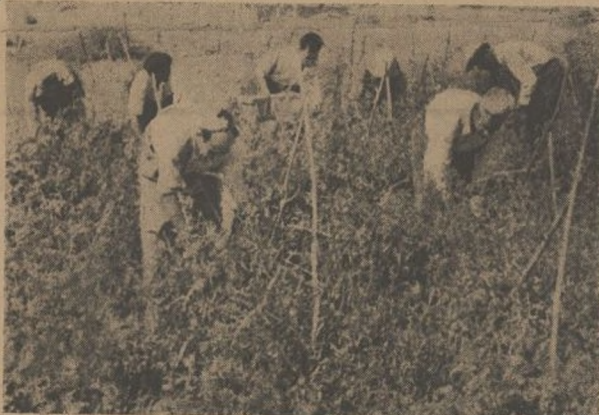
Merced al entusiasmo y la fe de nuestros huertanos, la cosecha ha sido exuberante.