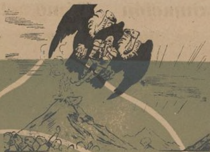
EL SERMON DE LA MONTAÑA A Hitler lo que es de Hitler y el algo sobra en el mundo, hay que dárselo también.

La risa sana sólo es posible en un físico sano y en una moral honrada como la del pueblo antifascista.