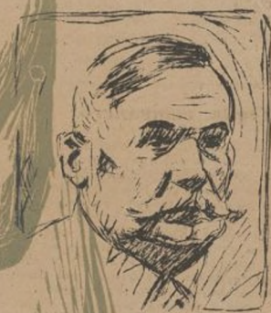
Benito Pérez Galdós

Han pasado ciento treinta años de aquellas acciones que el gran