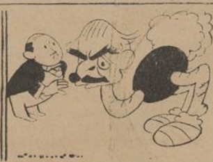
—Señor Chamberlain, ya está aprobado el retiro de los voluntarios. —¡Estupendo! Entonces sólo espero que progrese Franco para ponerlo en práctica.

La risa es el espejo fiel del carácter del hombre. Nuestros soldados ríen francamente por que saben luchar por una vida feliz y alegre.