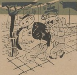
EN ALEMANIA Y después exigiémos la devolución a Alemania, de América del Norte.

En el número anterior de nuestra Revista dimos comienzo a la publicación del Suplemento Artístico de «Escucha», con una serie de retratos de nuestras figuras destacadas del Ejército y el Gobierno. Este esfuerzo tipográfico con otros mejores que observareis en nuestra Revista, responden al deseo de hacer del órgano de la unidad el auténtico portavoz de nuestra brigada que responda y satisfaga en absoluto, tratando de mejorar nuestro portavoz en lo político, militar y cultural.