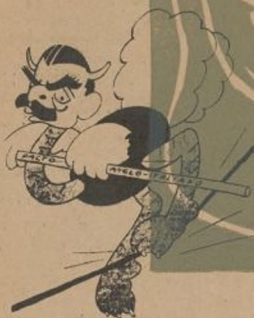
EN LA CUERDA FLOJA CHAMBERLAIN.—Si no fuera por este patito, me partiría la crisma.

La risa sana sólo es posible en un físico sano y en una moral honrada como la del pueblo antifascista.