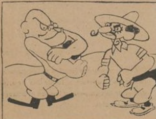
—¿Qué te pareció mi discurso? —Oh, duce, que tiene usted unos brazos magníficos para segar.