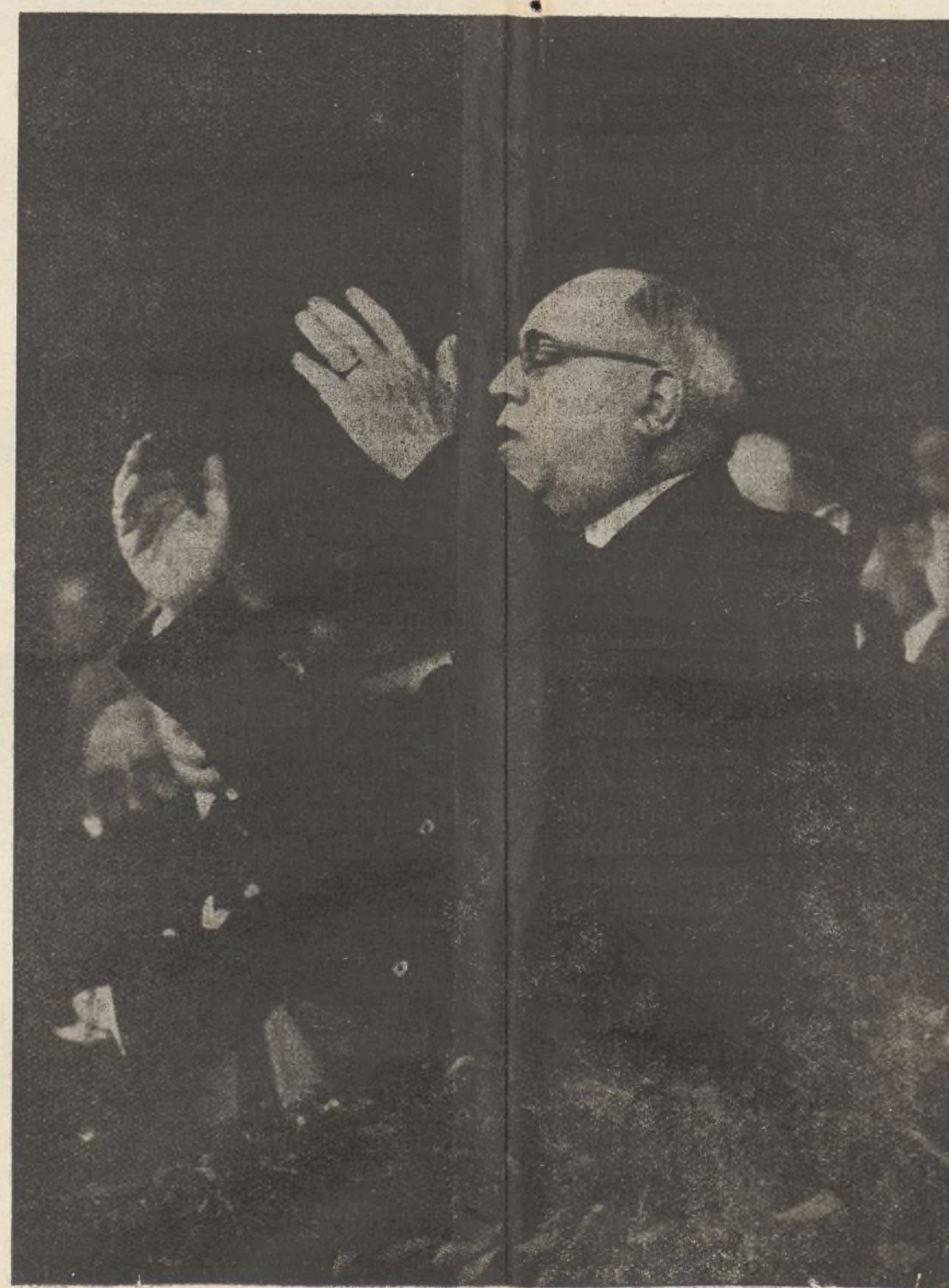
MANUEL AZAÑA Presidente de la República