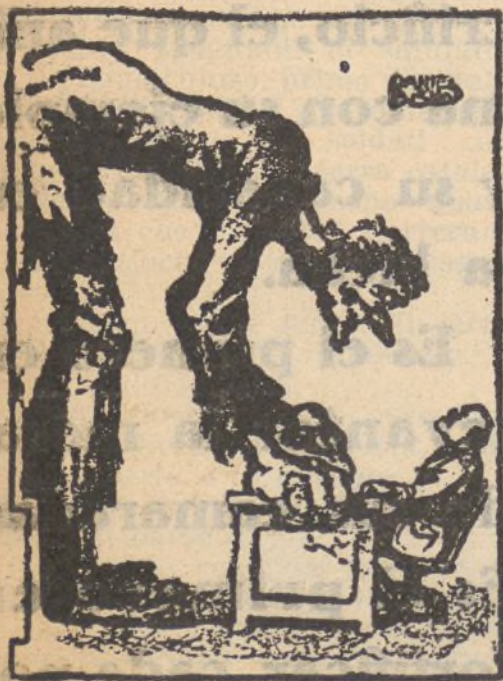
La miseria a Mussolini: Eccomi!