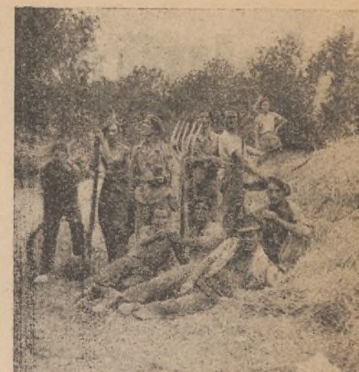
Después de la cosecha, un poco de descanso, y una "pose" para EL VOLUNTARIO