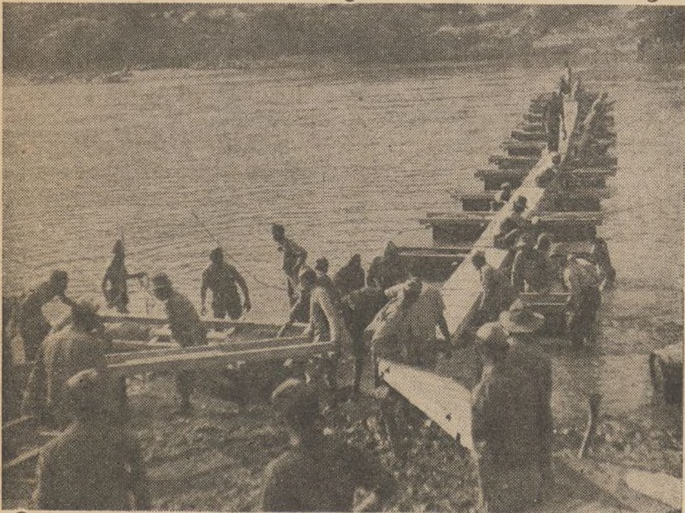
Los heroicos fontoneros reparan los puentes con la misma rapidez con que son destruidos por las bombas enemigas

En los momentos que atravesamos, tenemos que capacitarnos, ser cada día más disciplinados y que no se oiga ya nunca más estas discusiones por futilidades y tonterías que no merecen la menor importancia.