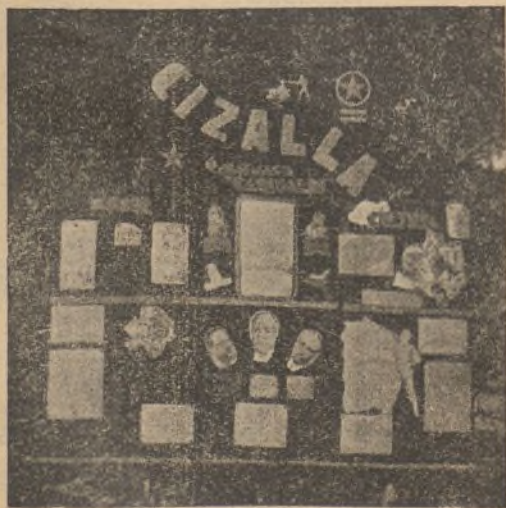
Un magnífico periódico mural del 1.º Batallón

Camaradas: Escribir mucho, escribir con simplicidad y espontaneidad, escribir artículos cortos. He comprobado que muchos camaradas no colaboran en nuestros periódicos porque no se creen capaces para escribir un artículo.