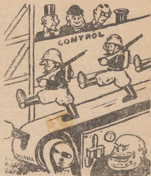
Pequeño método de Mussolini, o los progresos de la mecánica