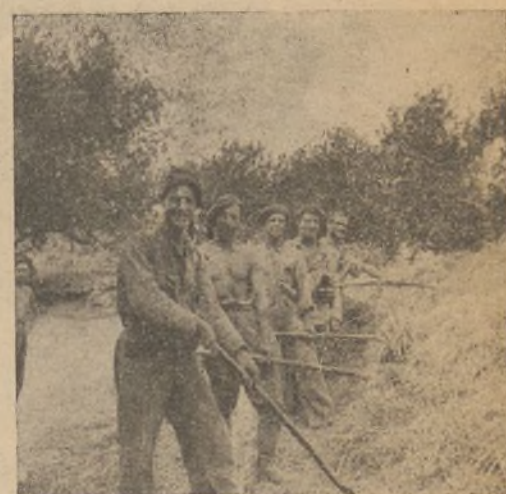
Nuestros voluntarios sonríen pensando en el grano salvado