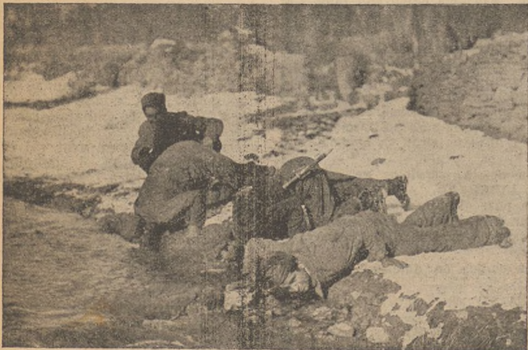
¡Atención! ¡No bebas agua sucia! Agua sucia que puede estar infectada

Honremos al literato insigne; entonemos alabanzas en honor del poeta; glorifiquemos al escritor que buscó en sus cuartillas la solución inmediata a los problemas de nuestras almas; estudiemos al sociólogo, e imitemos, en fin, al hombre que supo consagrar su vida a la concepción de un mundo mejor, regido por la Paz y por la Justicia.