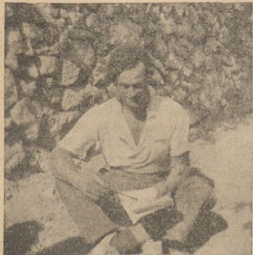
Después del trabajo de fortificación, el estudio

11. Establecimiento de los puestos de Mando a la distancia y lugar reglamentarios. Camuflaje y construcción de refugios en los mismos.