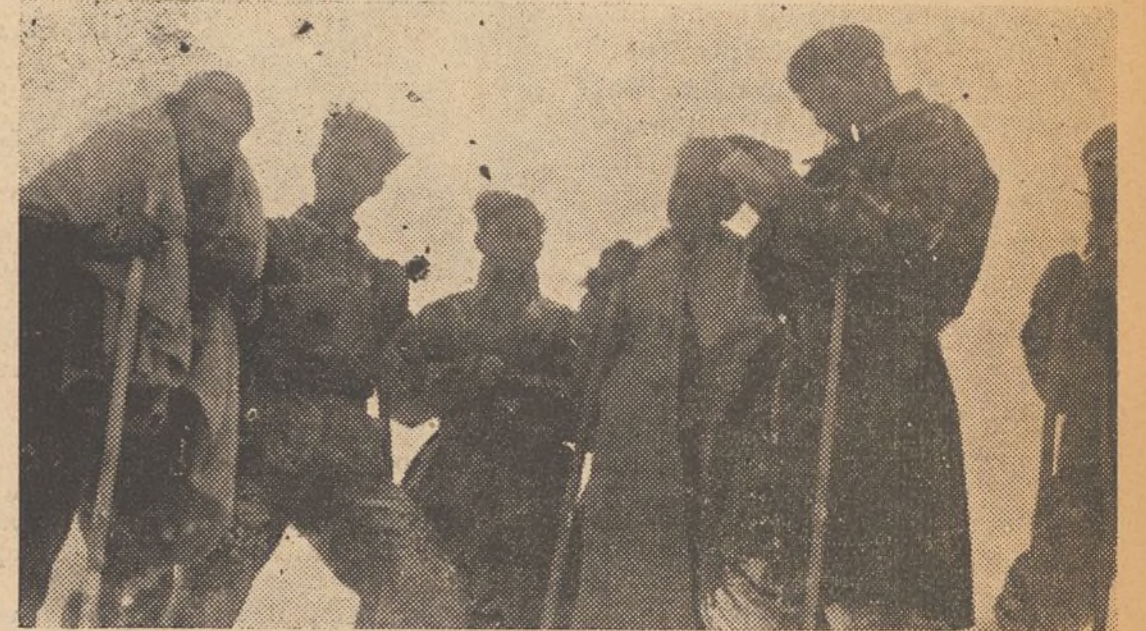
Jefes y soldados de la heroica «43 División»

«Siete ammirabili, eroi spagnoli!» — giunge una notte da Londra. Ed