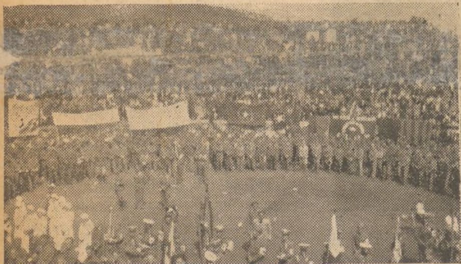
El pueblo catalán ap'aua a los bravos combatientes de las Brigadas Internacionales

Las cálidas tierras andaluzas fueron testigos de una epopeya más. Esos asturianos viven hoy libres ya, entre sus hermanos de otras regiones, felices al verse libres del invasor y a ello podrán unir la íntima satisfacción de ver que toda España ha vivido y vive su epopeya gloriosa, que su rescate es un motivo de profunda alegría para todos. Los que han realizado tan magnánimo acto de liberar a sus compañeros, tienen, como premio de su heroísmo, la felicitación de España entera y a la vez el fraternal abrazo de otros héroes, que nunca podrán olvidar a quienes jugaron su vida para devolverles la libertad.