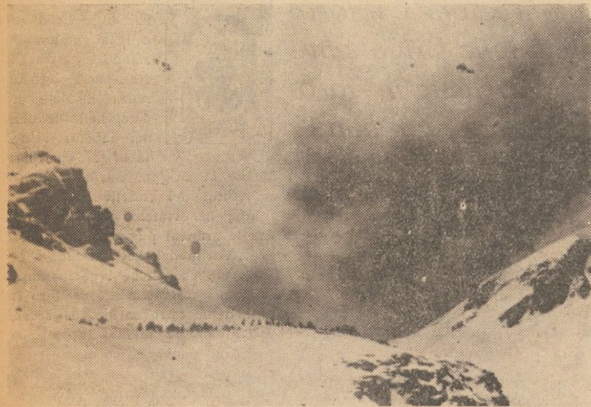
Las montañas defendidas por la «43 División»