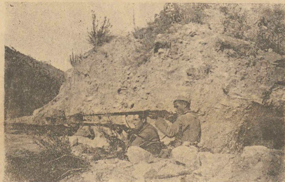
LOS BRAVOS FORTIFICADORES DE «LA GLORIOSA» (2.ª Comp. del 11.º Batallón «Garibaldi».)

Ed il nemico dovette rimanere sulle sue posizioni, senza fare un sol passo in avanti, furente di fronte a questo pugno di eroi che, inchiodati alla loro terra ed alle loro montagne, avevano giurato di morire piuttosto che cedere.