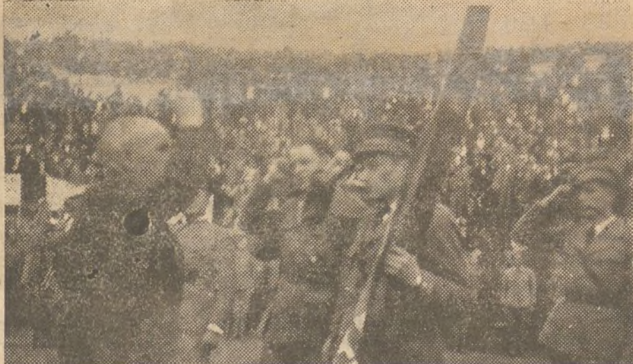
El alcalde de un pueblo de Cataluña entrega una bandera a las Brigadas Internacionales