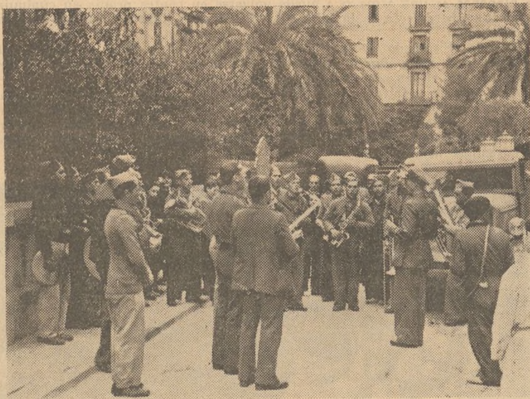
La banda de la «Garibaldi» ha ottenuto un gran éxito en su concierto de Barcelona

La Spagna repubblicana con la sua invincibile resistenza affretterà il processo di disgregazione della retroguardia faziosa.