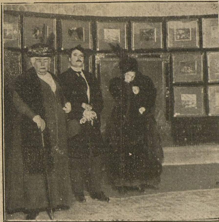
S. A. la Infanta Isabel con el notable pintor Federico Beltrán, visitando la Exposición de este.

La Real orden del ministerio de Fomento para fijar el precio y las existencias del carbón, dice: