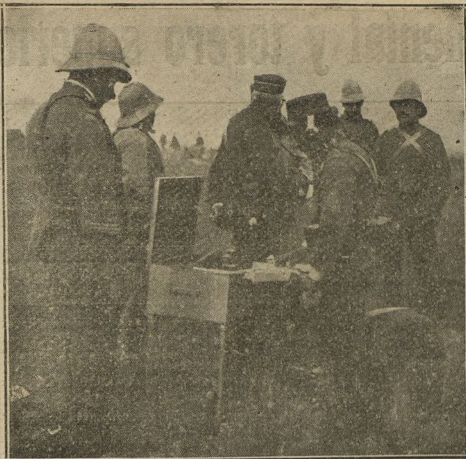
NUESTRAS TROPAS EN AFRICA.—Estación telefónica, instalada en la nueva posición del Zila, poco después de su ocupación, para comunicarse con la columna del general Aizpuru.

dad y cortesía, que siempre fueron patrimonio del público madrileño, se olviden en esta ocasión. No; la afición cortesana sabrá guardar todos los respetos y atenciones á los forasteros. Tiene confianza completa en su equipo y no acude á malas artes para conseguir éxitos y engañosas victorias.