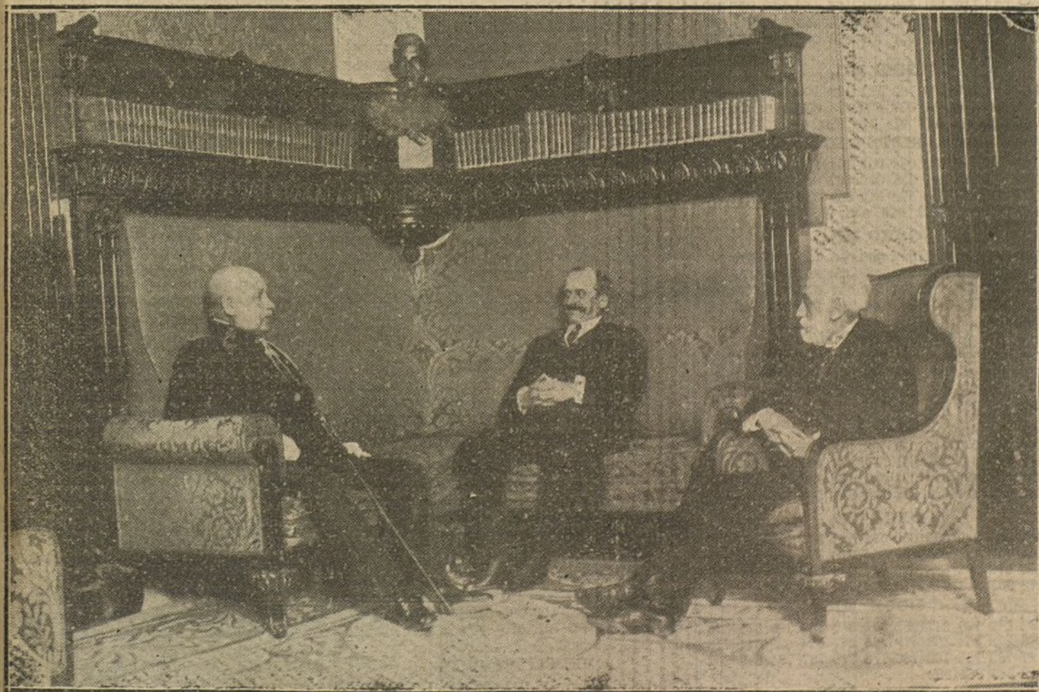
El general Jordana, el presidente del Consejo y el ministro de la Guerra, durante la conferencia que celebraron ayer tarde en el ministerio de Estado.

La noticia ha producido entre ellos el natural júbilo.