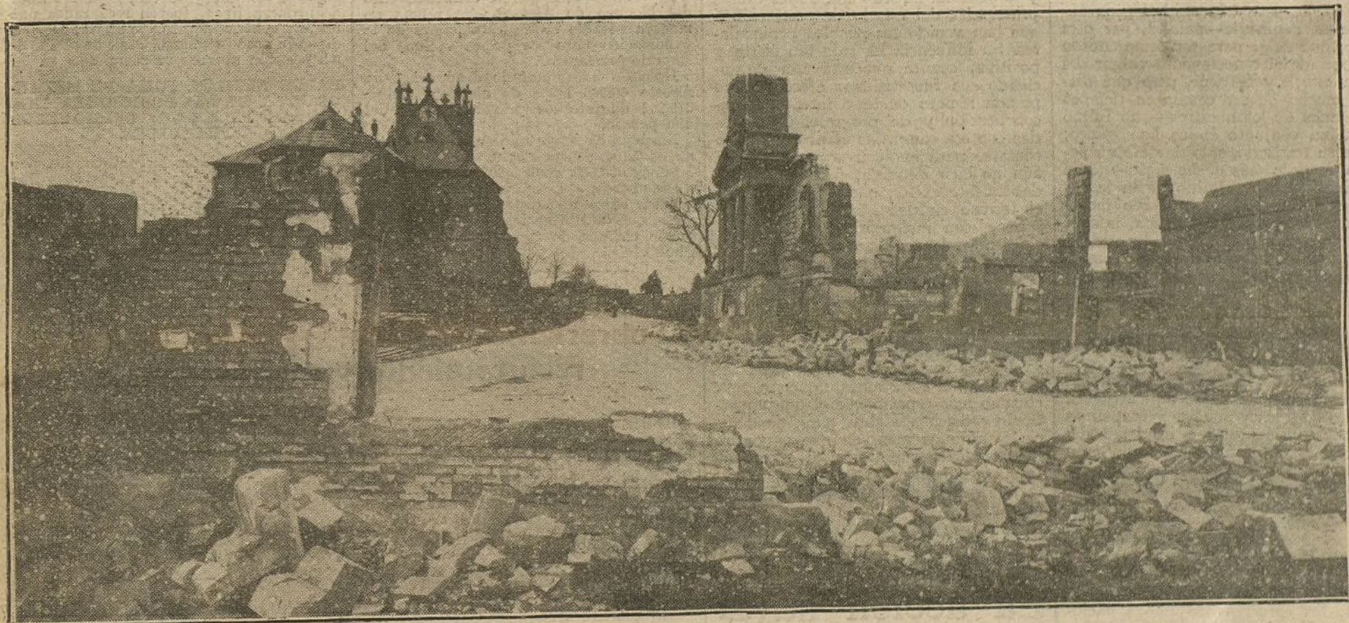
Estado en que han quedado la iglesia y el palacio municipal de Sommeilles (Marne) después de los bombardeos de ambos ejércitos beligerantes.