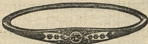
Núm. 203/81.—Pulsera oro de ley con platino, siete brillantes y diamantes. Ptas. 400.