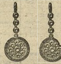
Núm. 200/59.—Pendientes veinticuatro brillantes y rubíes ó zafiros, Ptas. 350.

Del 42 absolutamente irrompibles son los preservativos que va de La Mascota, Gato, 4. (Fundada en 1895). Catálogo gratis enviando sello.