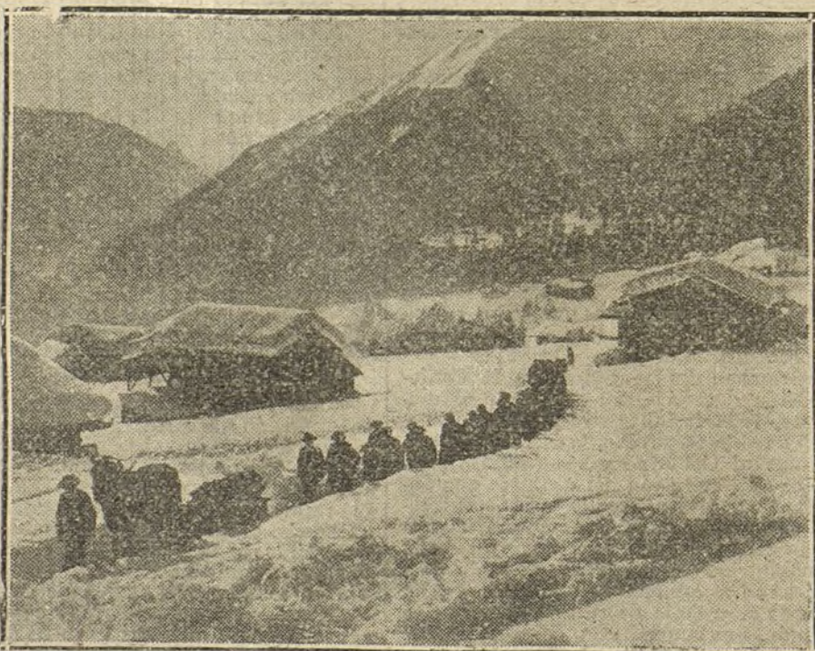
Interesante cortejo fúnebre, desfilando por las nevadas montañas de Suiza.

Ha habido también una guerra anterior á la guerra actual. Inglaterra construía sus dreadnoughts y sus superdreadnoughts fija la vista en su enemigo. Francia reservaba su odio para el momento cruel de la «revanche». Alemania, en sus fábricas y talleres afilaba sus armas de ataque y de defensa. La guerra diplomática era un hecho consagrado que seguía las fórmulas eternas: «Fortiter in modo, suaviter in re.» Mano de hierro y guante de terciopelo. He aquí la guerra anterior á la actual guerra, y he aquí su única justificación. Los pueblos se cansan de mirarse unos á otros con recelo, de esperar una lucha imprescindible y necesaria, y lo que ocultaba la diplomacia, esa representante oficial de la mentira, aparece sin rebozo al descubierta. La guerra continúa. Son los procedimientos la única variante. «Suaviter in modo, fortiter in re.»