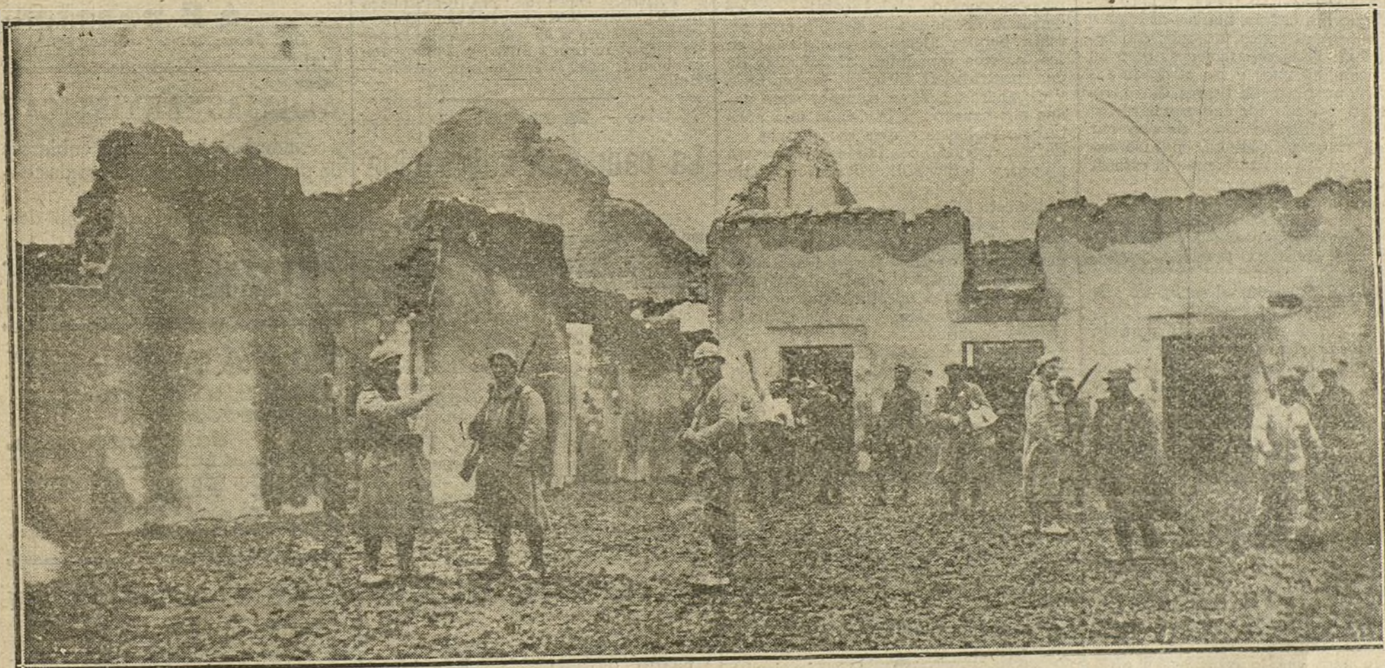
Un destacamento de tropas francesas en las ruinas de una localidad del Marne.

EN INGLATERRA E ITALIA CONTINUAN LAS DIMISIONES Y LOS RELEVOS.—ALEMANIA Y SU ACCION NA- VAL.—BARCOS TORPEDEADOS.—LA GUERRA SUBMARINA.—A PROPOSITO DEL DISCURSO DEL CANCELLER ALEMAN.—LOS INGLESES EN MESOPOTAMIA.—PARTES OFICIALES DE LOS BELIGERANTES.—UNA DECI- SION DEL GOBIERNO DE ATENAS