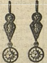
Núm. 200/44.—Pendientes ocho brillantes sobre platino, Ptas. 275.