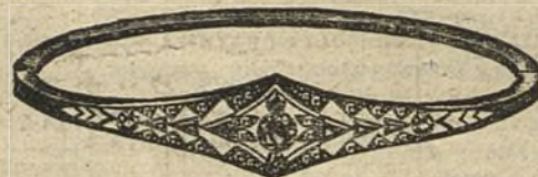
Núm. 203/82.—Pulsera oro de ley con platino, tres brillantes, diamantes y rubíes. Ptas. 425.