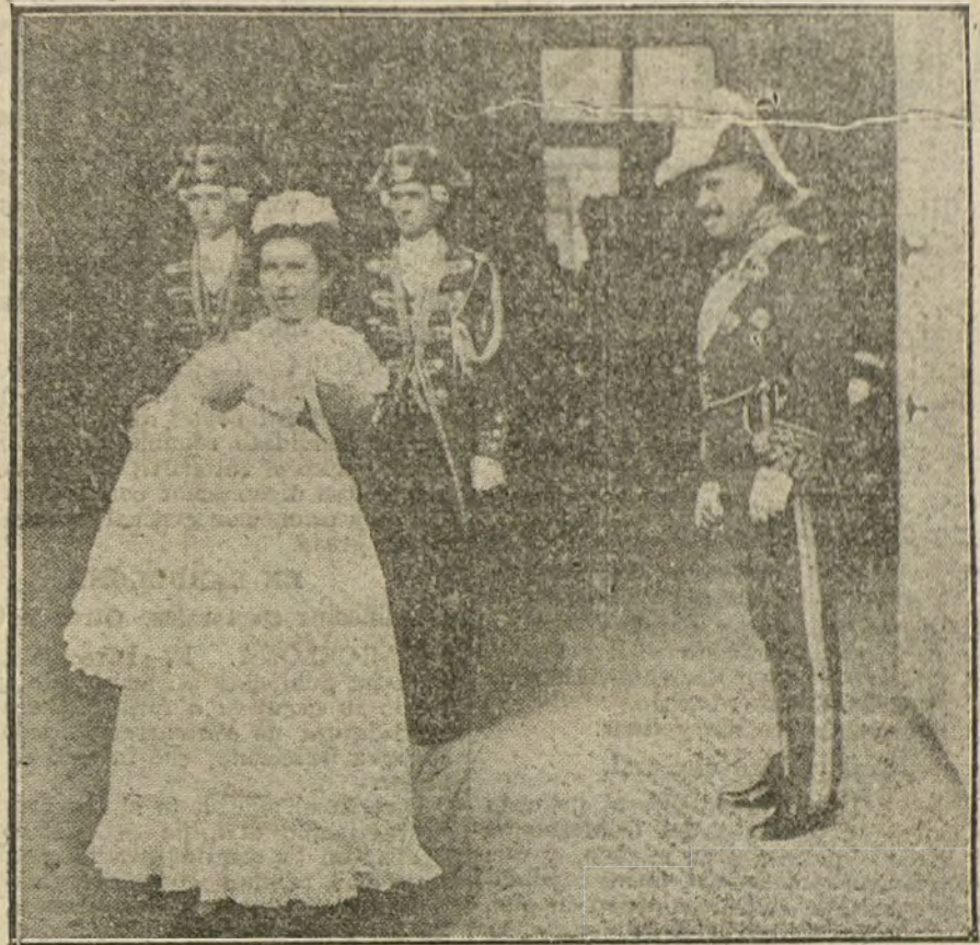
Bautizo de la hija de los duques de la Unión de Cuba, acto verificado esta mañana en la regia cámara.

Frente italiano.—La Artillería italiana demostró durante la tarde bastante actividad, dirigiendo un intenso fuego contra la cabeza de puente de Tolmein. El enemigo cañoneó nuevamente, con obu-