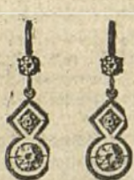
Núm. 200/43.—Pendientes seis brillantes sobre platino, Ptas. 250.