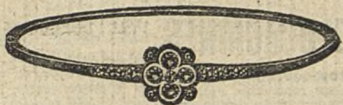
Núm. 203/80.—Pulsera oro de ley con platino, cinco brillantes y diamantes. Ptas. 350.