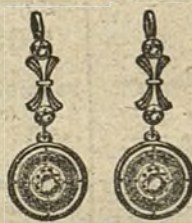
Núm. 200/52.—Pendientes seis brillantes y rubíes ó zafiros, Ptas. 300.