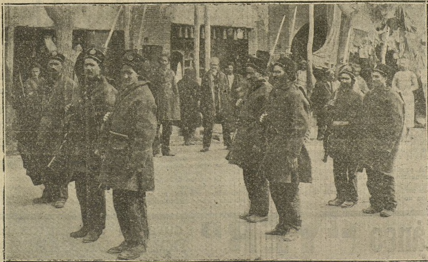
Soldados peras dispuestos para marchar al campo de operaciones.

LA TAREA DE DEVOLVER TODOS LOS TRABAJOS QUE NO PUBLICAMOS SERIA ABRUMADORA, Y PARA EVITARLA, COMO PARA PREVENIR RECLAMACIONES, QUE RESULTARIA IMPOSIBLE ATENDER, RECORDAMOS QUE NO SE DEVUELVEN LOS ORIGINALES