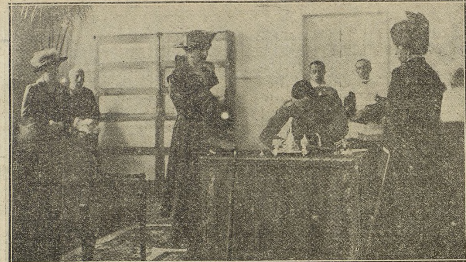
S. M. el Rey firmando el acta de inauguración del Colegio de Santa Cristina.

«Ya habrán visto ustedes que los escrutinios se han verificado sin incidentes