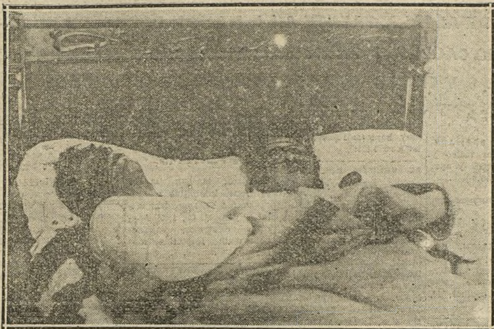
Las víctimas del suceso, momentos después de salir el Juzgado de la casa del crimen.

En las primeras horas de esta tarde se ha descubierto en una casa de mala nota de la calle de Santa Agueda un sangriento suceso, del que han sido protagonistas dos jóvenes enamorados.