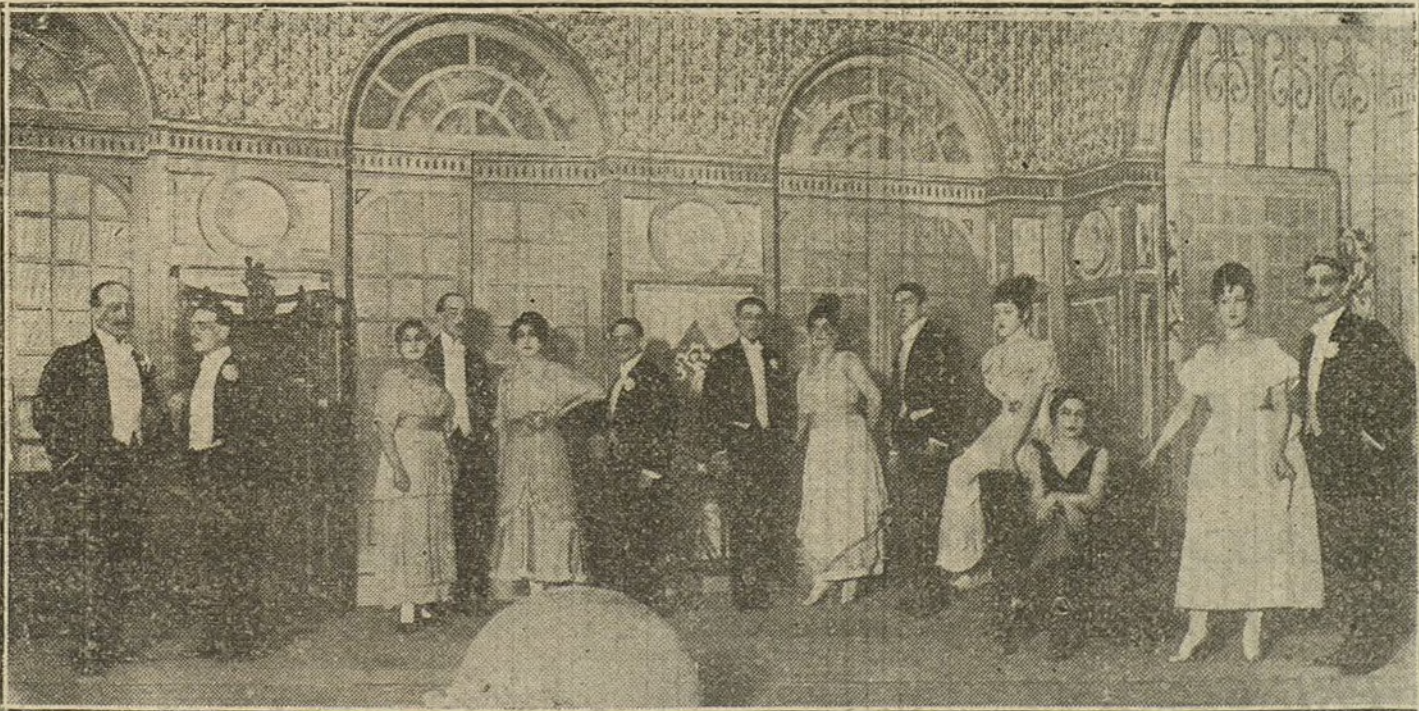
Una escena de «Los trovadores», obra estrenada anoche con feliz éxito en el teatro de Eslava.

Los prisioneros austriacos seguirán el mismo orden y trayecto en sentido inverso. El transporte se efectuará en trenes sanitarios de la Cruz Roja suiza; el canje de prisioneros comenzará en los primeros días de Mayo.