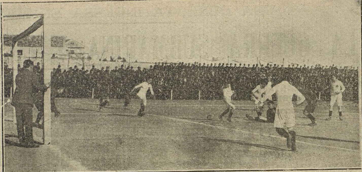
Uno de los momentos más curiosos del emocionante partido de foot-ball jugado ayer tarde entre el Madrid F. C. y el Barcelona.

Sabemos que el 24 de Marzo fué alcanzado por un submarino en medio del canal una larga embarcación negra, sin pabellón, con una chimenea gris y un puente del mismo color; pero el comandante alemán tiene la convicción absoluta de que se encontraba en presencia de un navío que colocaba minas, del nuevo tipo del inglés «Arabis». Por eso le atacó, á las tres y treinta y cinco minutos de la tarde. El torpedo produjo en la proa una explosión tan violenta, que adquirió la certidumbre de que el buque trans-