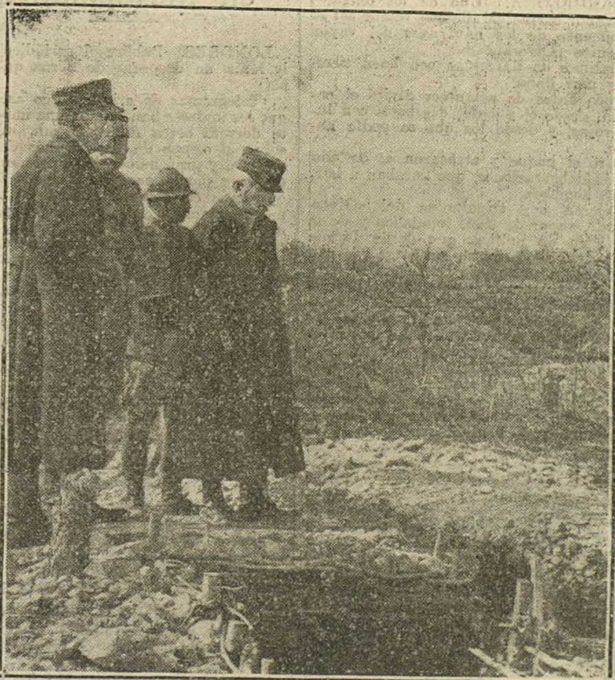
LOS COMBATES DE VERDUN.—El general italiano Cadorna visitando los campos atrinchados de Verdun.

LONDRES. (Radiograma.) Se ha publicado la correspondencia entre sir Edward Grey y el embajador americano con relación al comercio con el enemigo. El