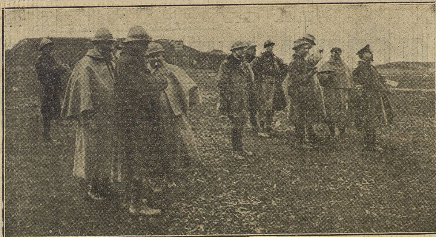
Oficiales del Ejército francés y corresponsales de periódicos extranjeros en un alto de la línea de fuego, cerca de Verdun, presenciando las operaciones militares.

Mr. Houston, miembro del Parlamento y armador, ha declarado que desde el principio de la guerra han sido destruidos o capturados 950 buques ingleses.