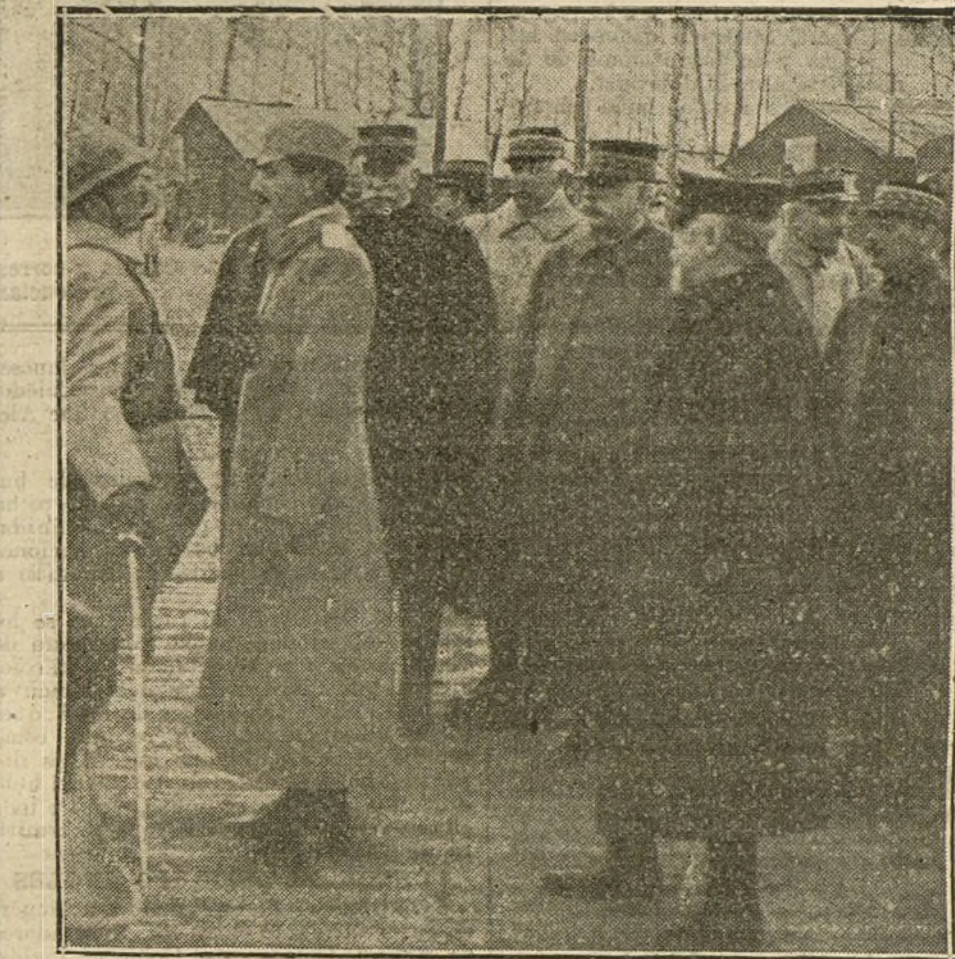
El Príncipe Alejandro de Servia durante su visita al frente francés, acompañado del Presidente de la República y los generales Joffre y Humbert.

¿Cuánto darían los aliados que esto propalan, si realmente pudieran sen-