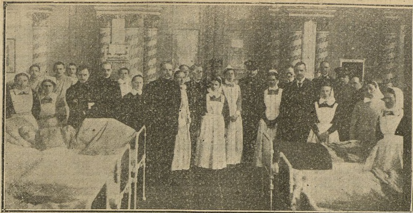
Personal sanitario de la ambulancia de la Cruz Roja holandesa, que presta servicio en el hospital militar de Glewitz, en Silesia.

do el servicio militar para casados y solteros.