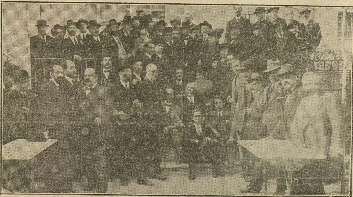
El rector de la Universidad de Granada, después del banquete con que fué obsequiado por la Escuela de Bellas Artes y otros Centros docentes de Málaga, con motivo de su visita a dicha ciudad.