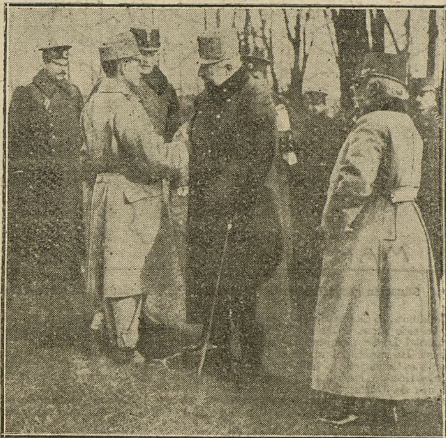
El Zar de Bulgaria, durante su visita al Cuartel general austrohúngaro, felicitando á un heroico soldado austriaco.