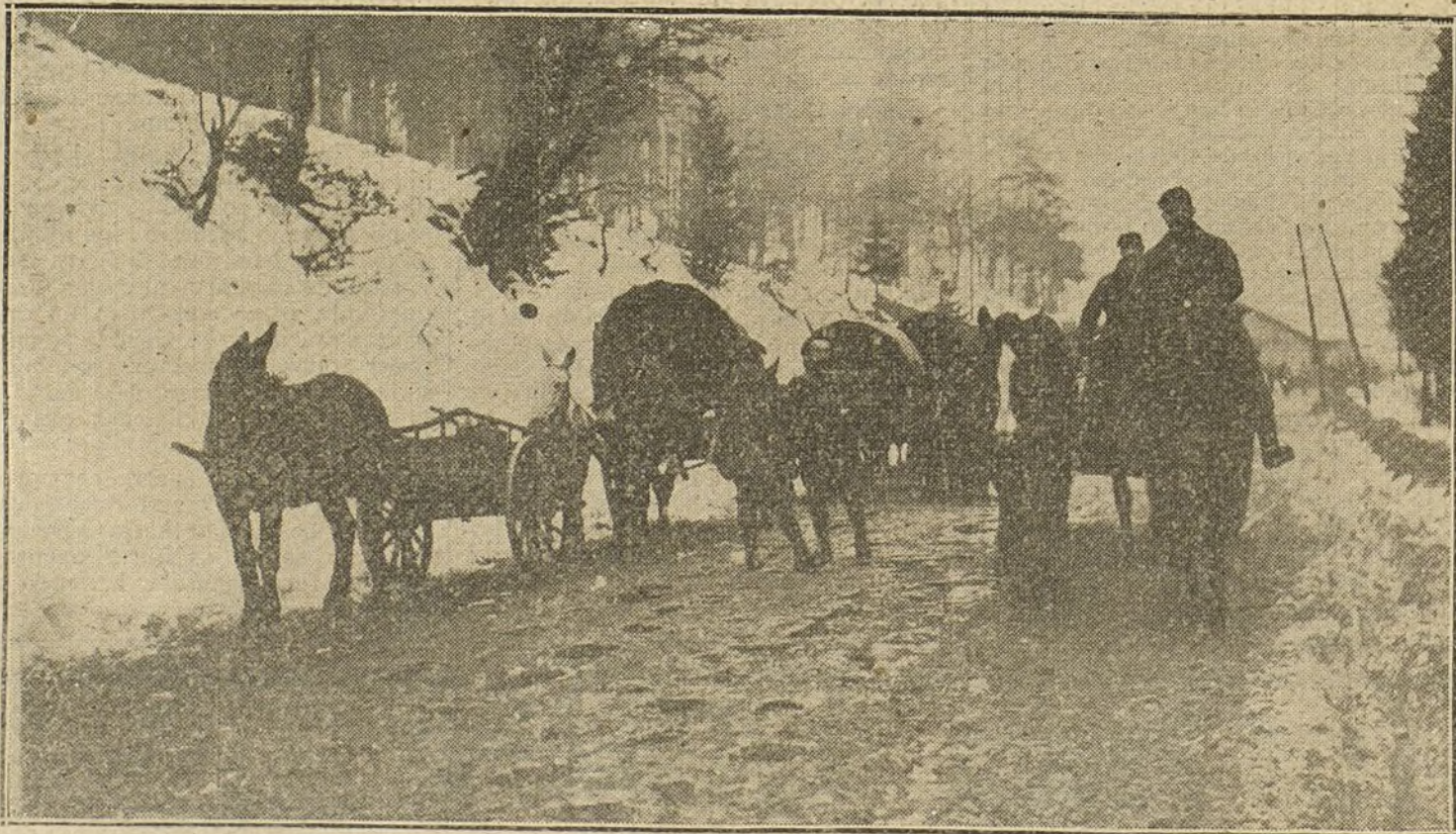
Convoy francés de municiones, dirigiéndose al frente de batalla por un paisaje de los Vosgos.

Tampoco está la Cámara dispuesta a aprobar la proposición de Carson pidiendo