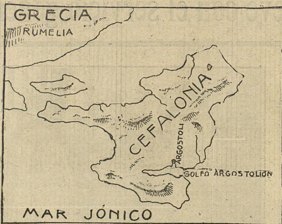
Situación geográfica de la isla de Cefalonia, ocupada por los aliados.

la casualidad de que los Imperios centrales fabrican las municiones más de prisa, volvemos a las andadas, es decir, a una inferioridad manifiesta en organización, en el sentido más amplio de la palabra. «Las grandes cosas se preparan con lentitud»—dice Insúa, al hablar de la unidad de acción.