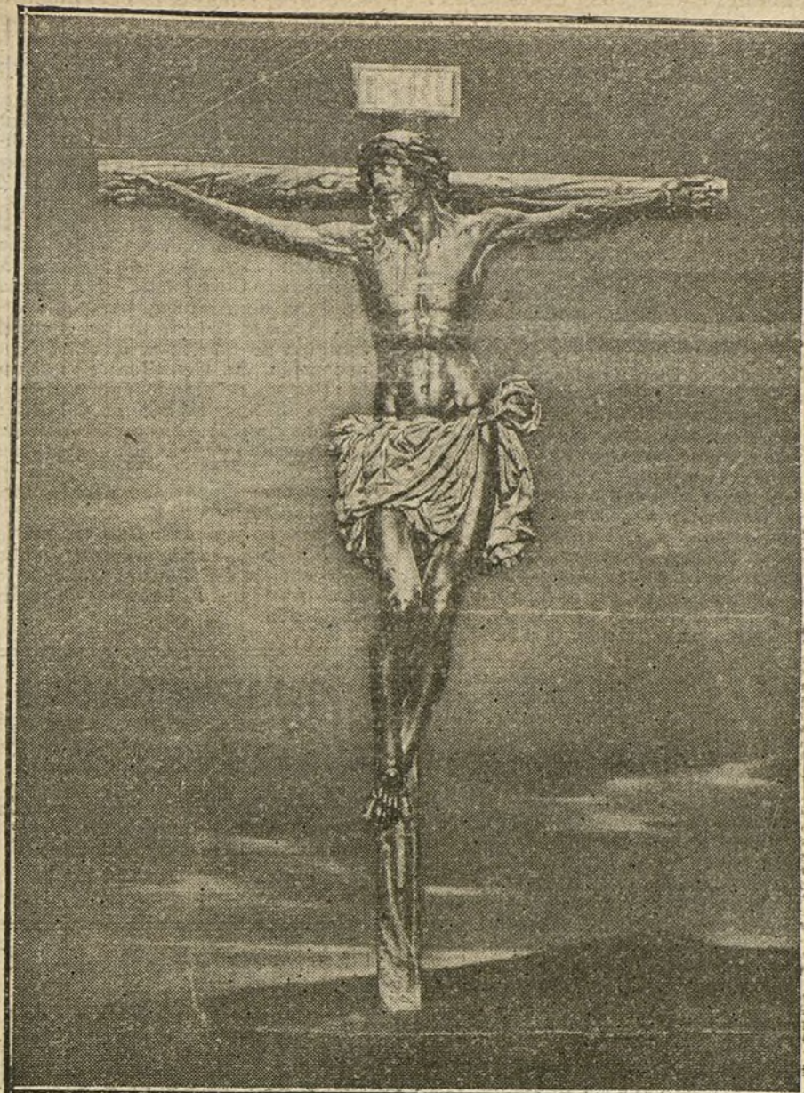
Santísimo Cristo de Vergara, célebre escultura de Montañés.

hijos para curar sus enfermedades, cubrir las necesidades y enjugar las lágrimas; por eso, y en vista de los favores recibidos, es en Madrid respetado, querido y venerado por todas las personas de las diferentes clases y condiciones.