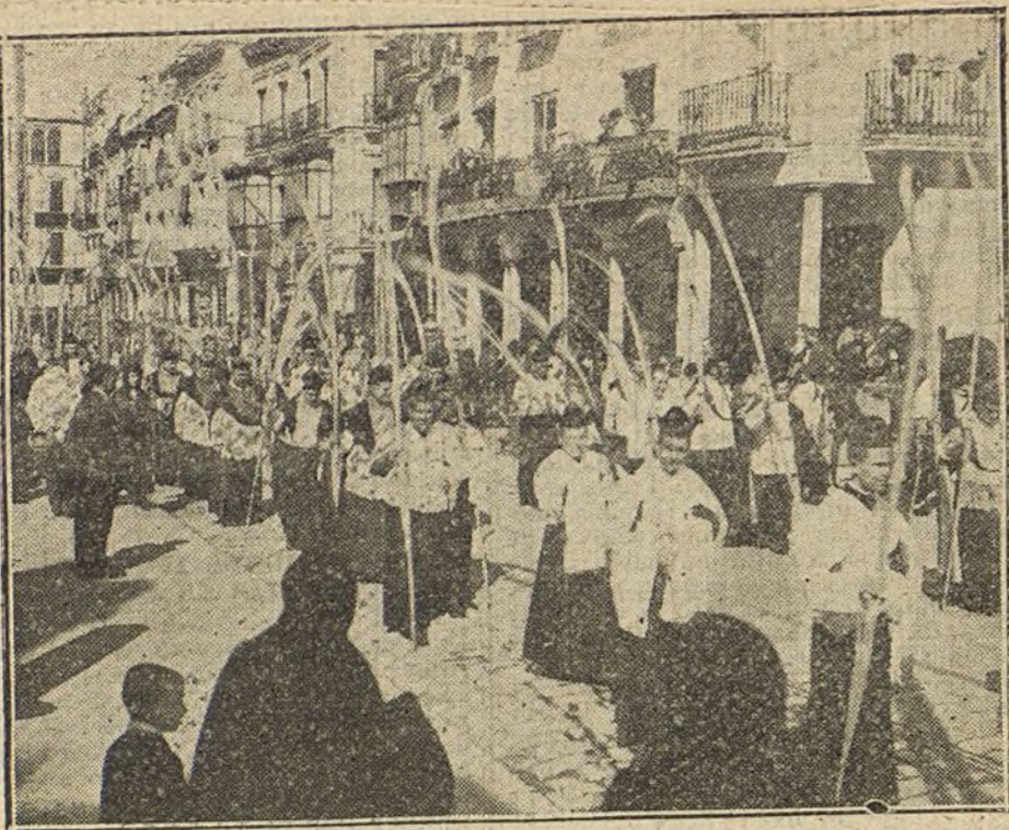
LA SEMANA SANTA EN SEVILLA. —La típica procesión de las Palmas, á su paso por la calle de Moret.

Al llegar estos días, en los que la Iglesia conmemora la pasión de Jesucristo, y en los que LA TRIBUNA prepara sus números á rememorar aquel cruento sacrificio de Nuestro Señor para redimirnos, este año nos parece mejor tratar de algunas de las imágenes de Jesús Crucificado que, por su aspecto histórico, artístico ó piadoso, son veneradas en España.