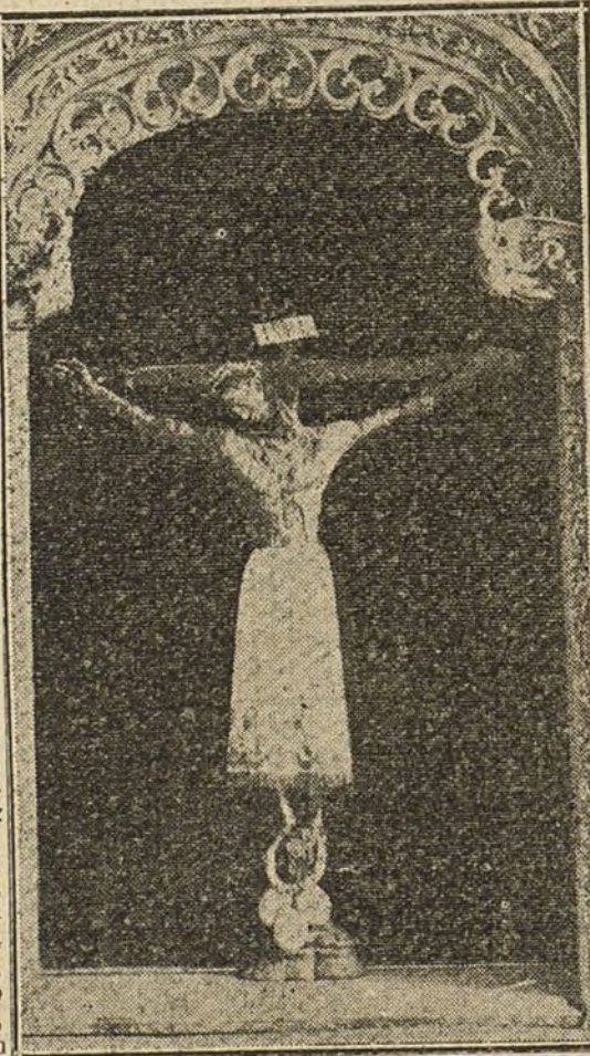
Santo Cristo, que se venera en la catedral de Burgos.

Recogido por los padres Carmelitas, y abierto que fué el cajón, vieron los numerosos circunstantes con infinita emoción y gran pasmo que un padre tomó en sus manos un Santo Cristo que traía un rótulo que decía: «Voy destinado para la Santa Vera Cruz de Toledo.» (La Congregación posee un documento, firmado por el obispo auxiliar en 1784, que así lo dice.)