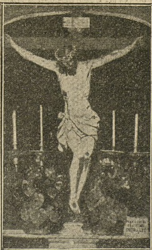
Santísimo Cristo de la Fe, que se venera en la iglesia parroquial de San Luis.

¿Que se han conseguido muchas mercedes de esta tierna devoción? ¿Quién lo duda? Muchas personas pregonan públicamente el agradecimiento al Señor de la Fe por haber atendido sus ruegos y remediado sus necesidades en todas las formas en que éstas se presentan. Hoy, el Santo Cristo de la Fe es considerado como el amante padre que vela por sus