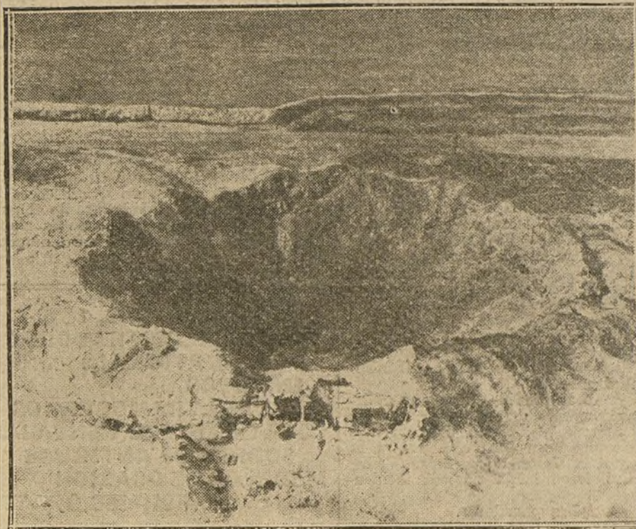
Efecto causado por la explosión de un obús alemán en las cercanías del frente de Verdun.

No sólo es Irlanda un ejemplo viviente, palpable de la absoluta incapacidad de la raza inglesa para organizar sociedades mixtas de ella con cualquiera otra, sino una demostración asombrosa de la vitalidad de la raza céltica,