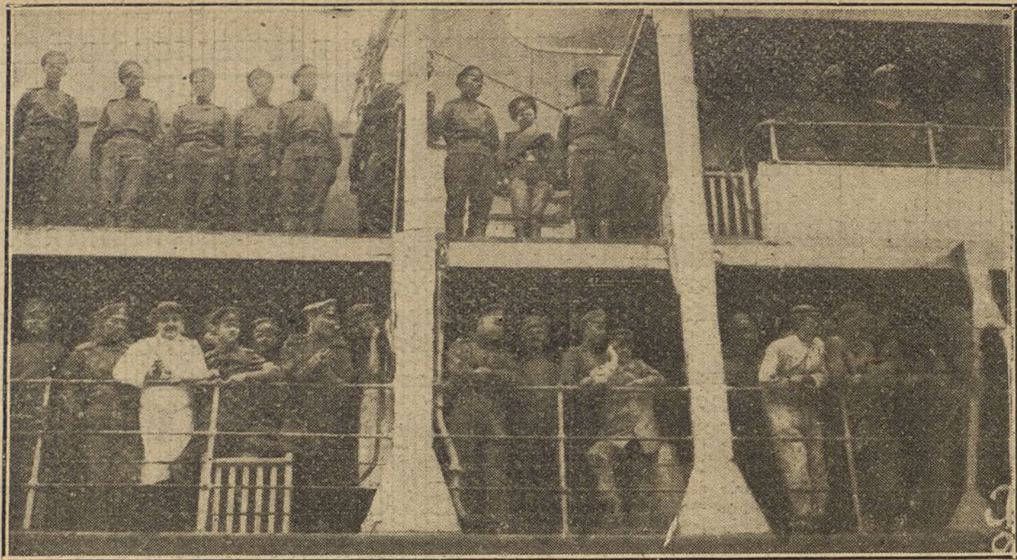
Los soldados rusos que han llegado a Francia para nutrir las filas de los aliados, a bordo del vapor que los condujo a Marsella.

Un avión enemigo lanzó cuatro bombas sobre Inemo (lago de Garde), sin causar víctimas ni daños. Un intento de incursión sobre nuestro territorio por parte de una escuadrilla enemiga fué rechazado por el fuego de nuestra Artillería y la pronta intervención de nuestras escuadrillas de aeroplanos.