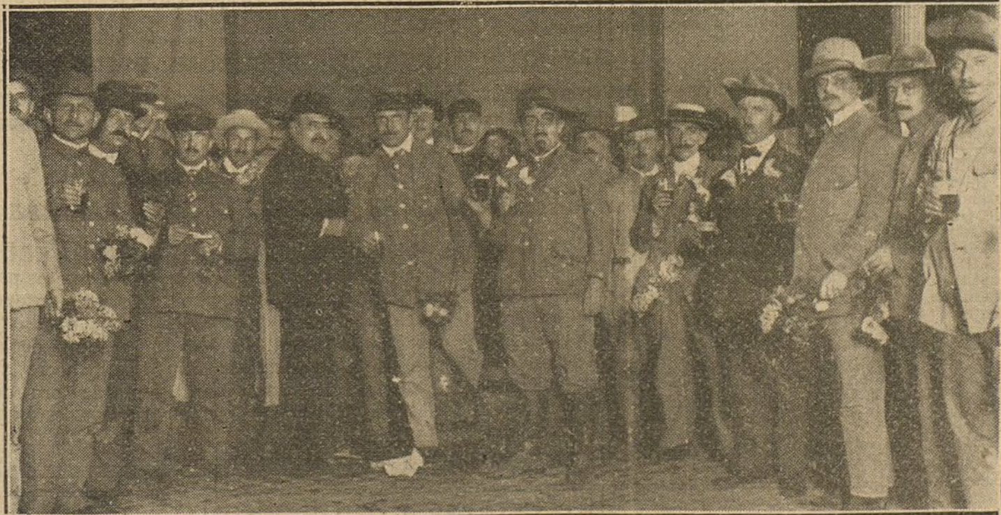
LOS ALEMANES INTERNADOS EN ESPAÑA.—Grupo de soldados alemanes de Camarones, en la estación de Metrópoli, bebiendo cerveza antes de embarcar en el tren que les ha conducido á Zaragoza.