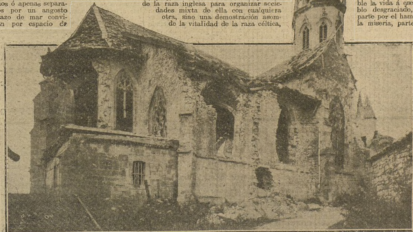
Efectos del bombardeo de franceses y alemanes en un pueblo de las proximidades de Verdun, cuya posición se disputan enconadamente los beligerantes.