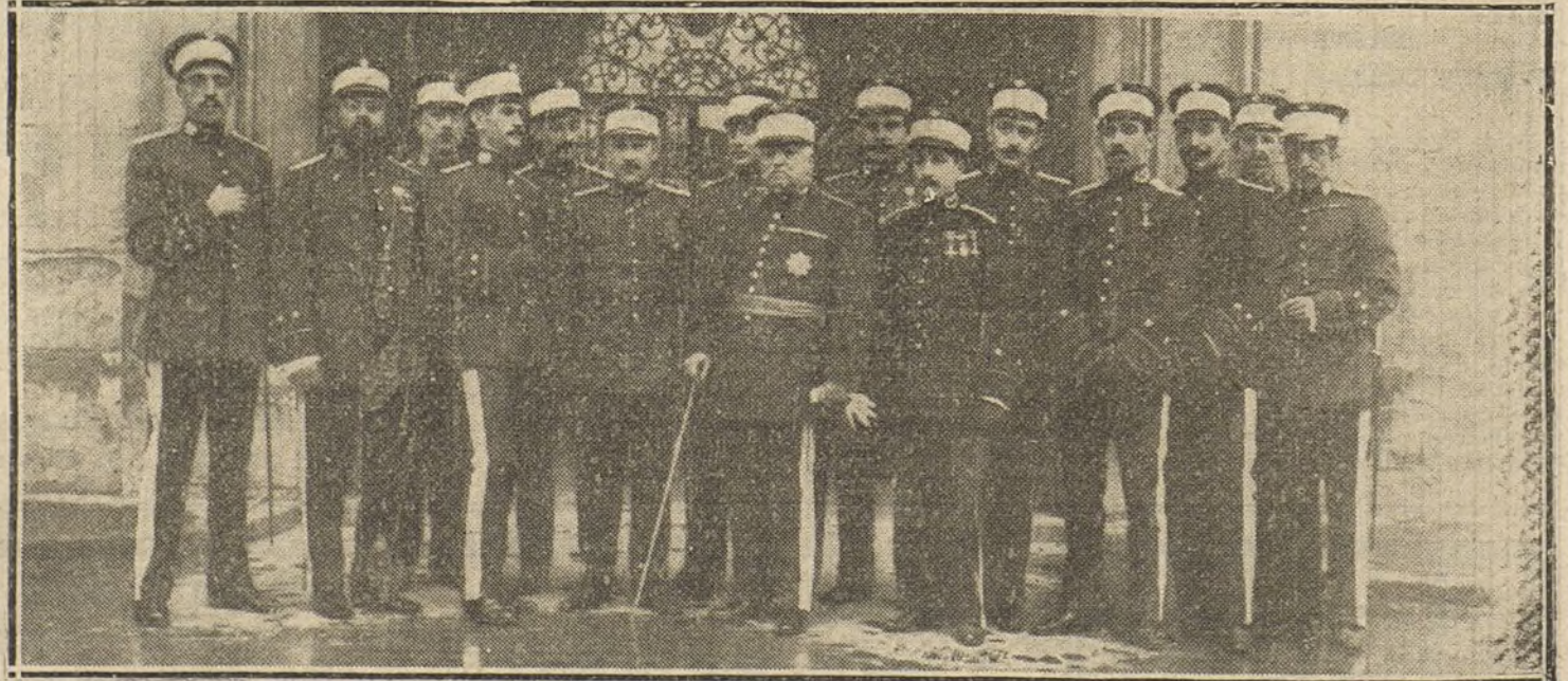
El general jefe de Intervención Militar con su ayudante y los oficiales de distintas Armas, que han ingresado en dicho Cuerpo en la última convocatoria.