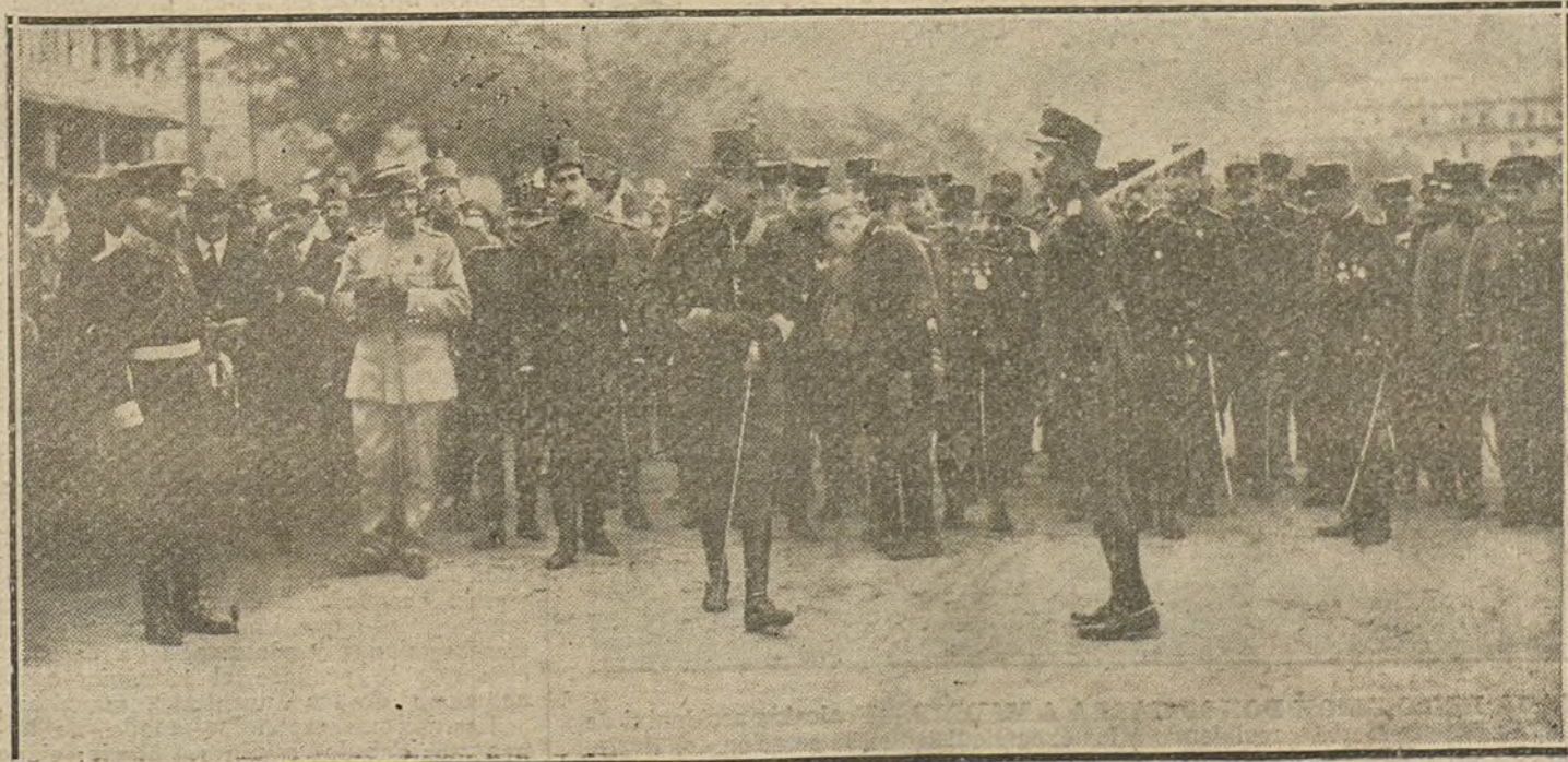
EL REY EN SAN SEBASTIAN.—S. M. el Rey revistando las tropas que tomaron parte en las maniobras militares celebradas en el campo de Andarrieta.