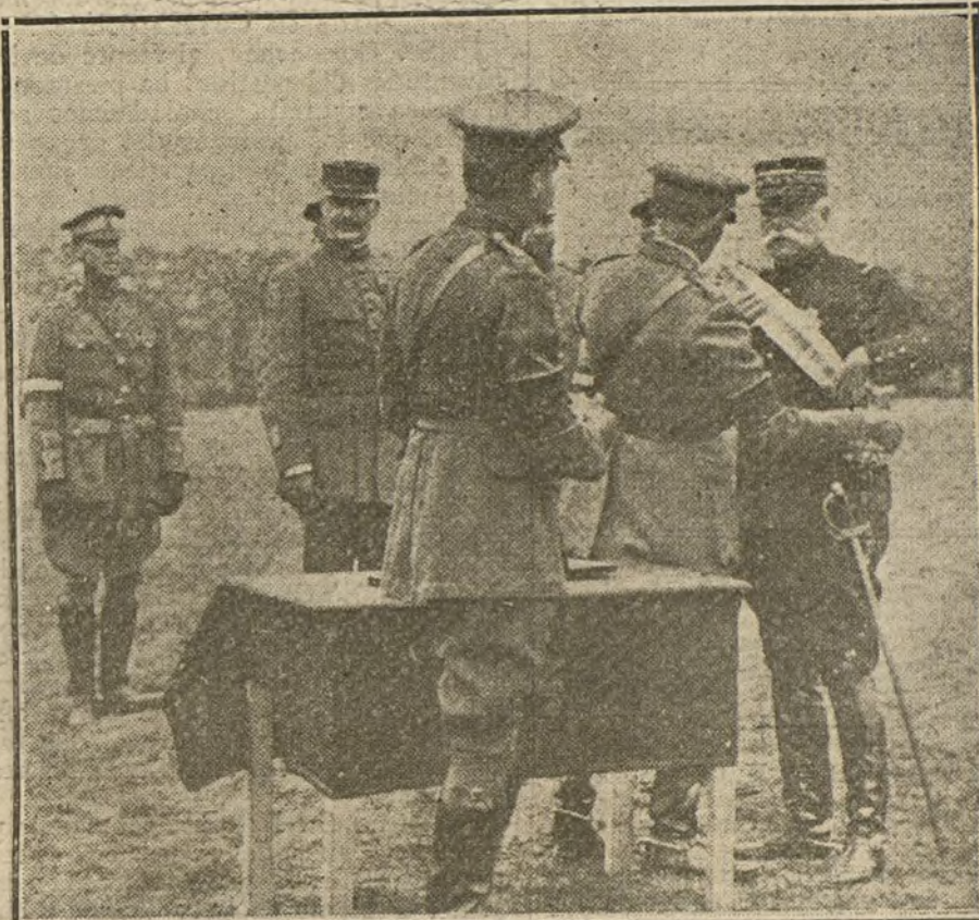
El general francés Serrail imponiendo al general Mahon el cordón de la gran cruz de San Miguel y San Jorge.

manófila en España tenía como principio una reserva discreta y correcta, basada en hechos históricos, en vez de hacer frases vacías, a nadie podrá extrañar que en adelante salga de ese prudente estado, procediendo del mismo modo como lo ha hecho la propaganda aliada, bajo la protección del Gobierno neutral.