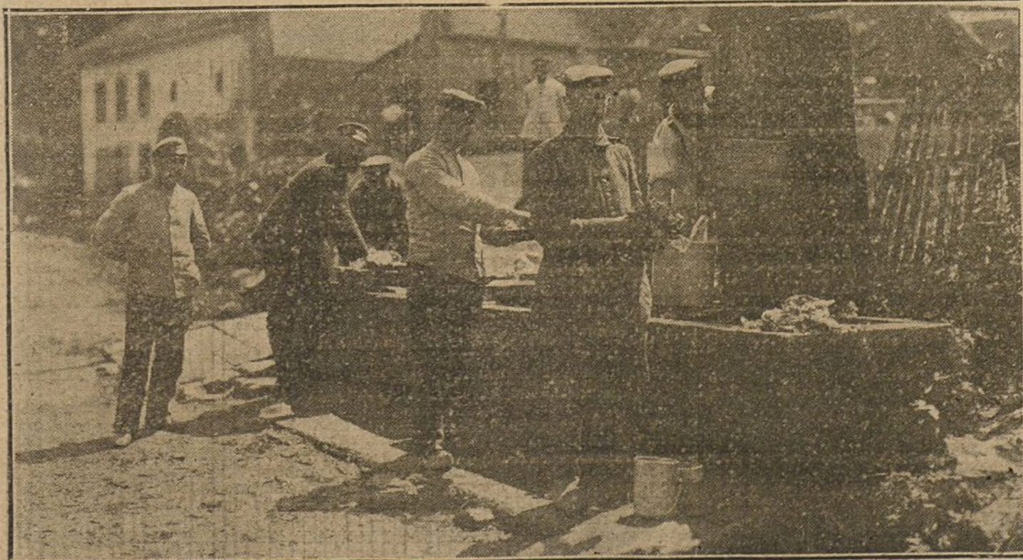
Soldados alemanes lavándose en una fuente de un pueblo de los Vosgos.

«No creo que haya gastado mucho tiempo—dice Mella—en andanzas y especulaciones metafísicas. En la ciencia del Derecho, su hermosa inteligencia profesa la arqueología jurídica del Uransismo. En opiniones religiosas, no milita en ninguno de los dos grandes misterios de la im-