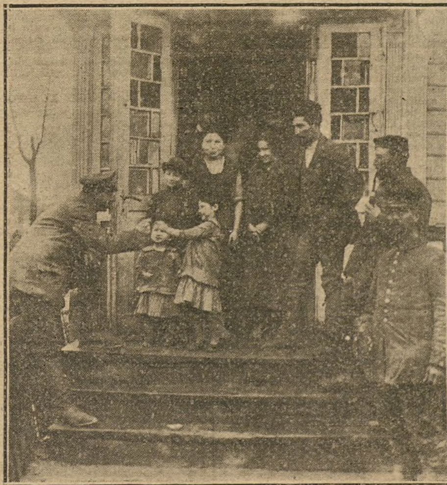
EN LA POLONIA RUSA.—Soldados alemanes conversando con una familia polaca

La vista del proceso instruido contra el diputado irlandés sir Roger Casement comenzará el lunes.—Chovil.