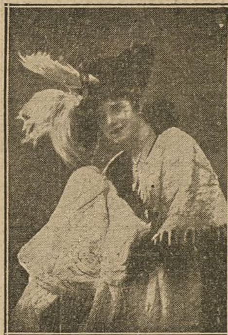
Señorita GINA MONTES, bellísima actriz cinematográfica.