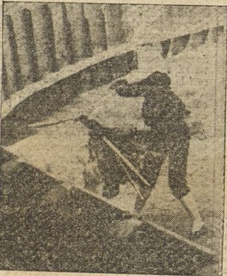
Gaona descabellando al primer toro de la tarde.