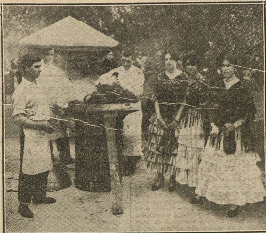
Señoritas de la aristocracia madrileña encargadas de la venta de flores, juguetes y horchatas en el festival benéfico celebrado ayer en el Botánico.

samente de las necesidades de la población; reanimó a ésta, infundiéndola alientos, y pudo, al fin, ver realizado su anhelo generoso, algún tiempo antes frustrado, cuando queriendo ir a Murcia por motivos análogos, hubo de refrenar sus nobles impulsos ante consideraciones de alto interés nacional hechas por su Gobierno.