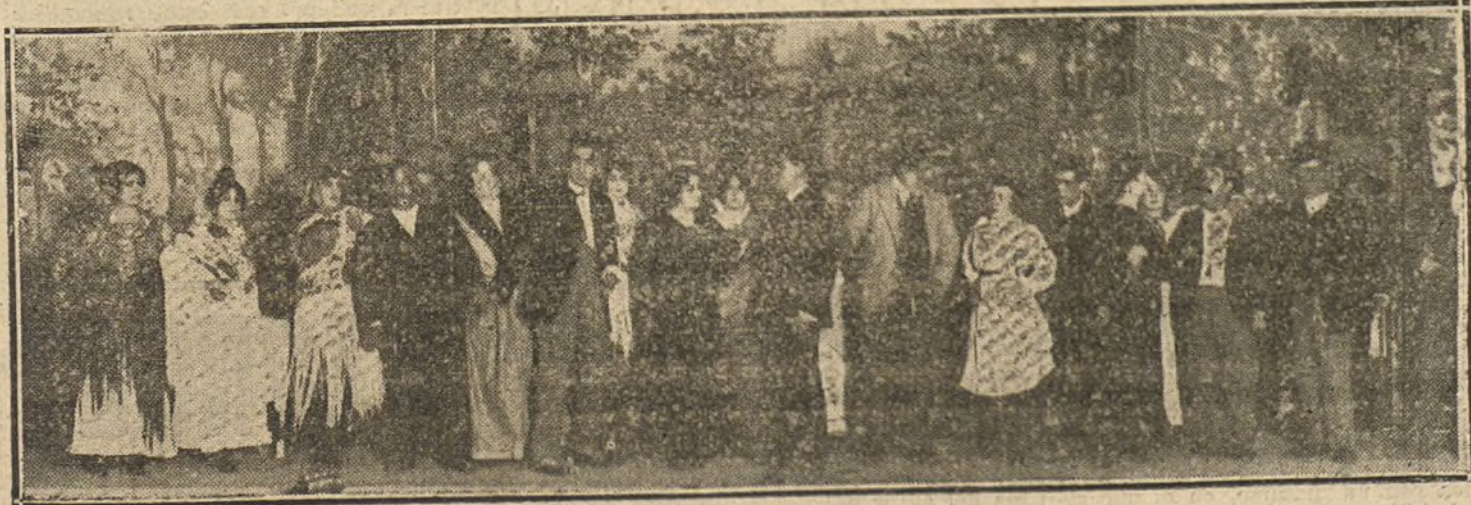
Una escena de la obra «Serafín el pinturero» estrenada anoche en el teatro Apdo.