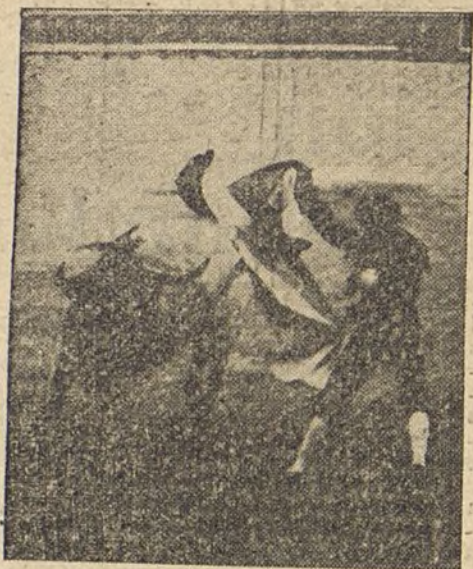
faona al dar una verónica a su primer toro.

Dura el tercio más que un drama po- ético con seis actos y un epílogo. ¡Cómo nos aburrirán, camará!