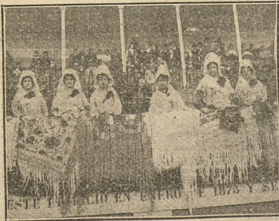
Presidencia de la hermandad benéfica celebrada esta mañana en la Plaza de Toros de Madrid.

Entre un diluvio de capotazos, ponen los cohetes Chiquilín y otro «amigo de la pipa». Y los ponen poquito á poco, y en el suelo, para no cansarse mucho. (Pitos de San Isidro y de los otros.)