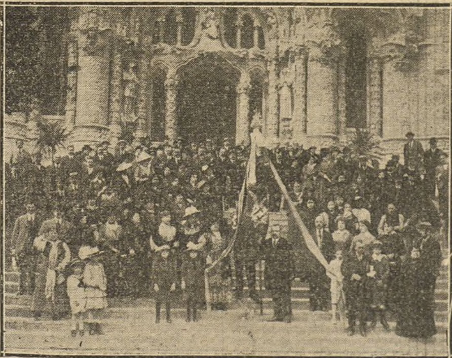
LA BANDERA DEL CENTRO DE PASTELEROS Y CONFITEROS DE BARCELONA.—Los socios del Centro saliendo del templo del Tibidabo, después de asistir a la misa cantada de su bandera.

A las dos de la tarde comunica el mismo buque que se encuentra a salvo por haber cesado la persecución del submarino, después de haberle disparado éste tres granadas, que no le alcanzaron.