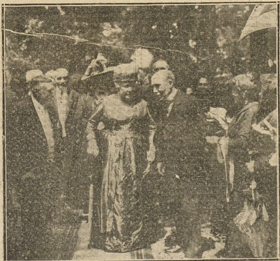
La Infanta Doña Isabel en la fiesta del «bollu», celebrada esta mañana por los asturianos.