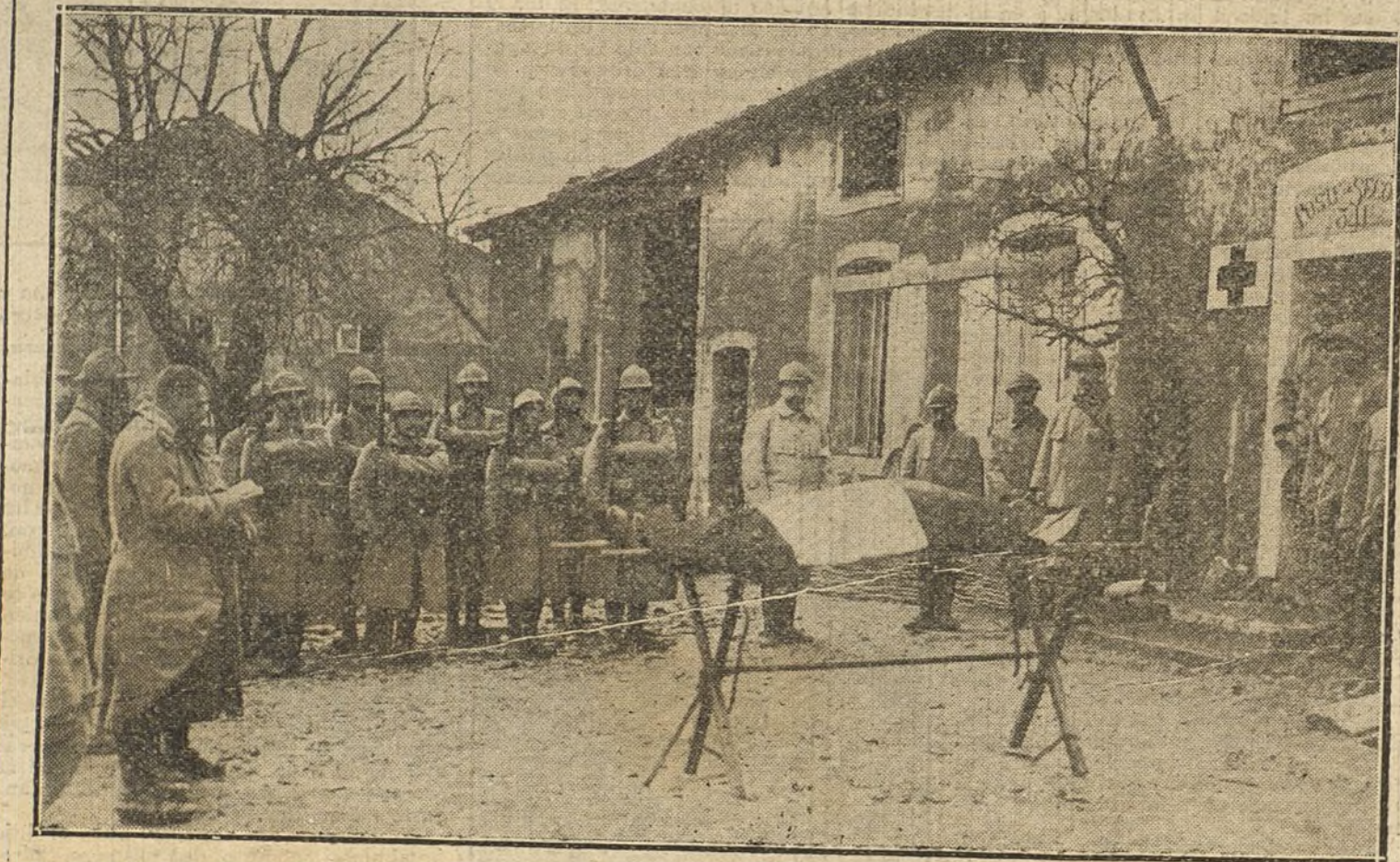
EN EL FRENTE FRANCES.—Funerales celebrados al amanecer por el alma de un jefe muerto durante la noche en las trincheras.

cantera al Oeste del bosque de Ablain, los franceses sufrieron considerables pérdidas en un fracasado ataque.»