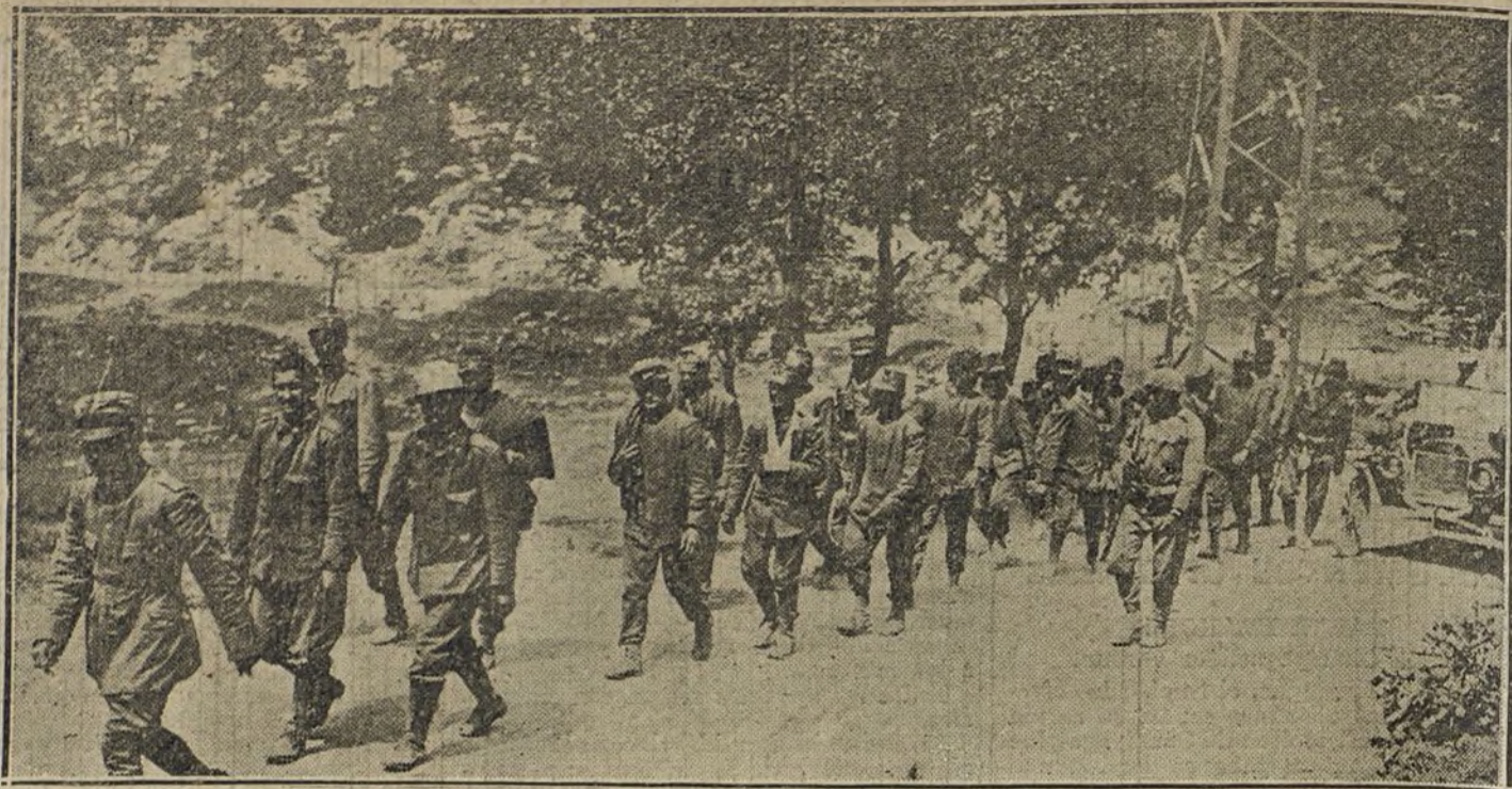
EL CONFLICTO EUROPEO.—Soldados italianos hechos prisioneros y conducidos por tropas austriacas.

Todas las fábricas de Cattana, centro de la industria jabonera italiana, cerraron por falta de materias primas, quedando en la calle miles de obreros.