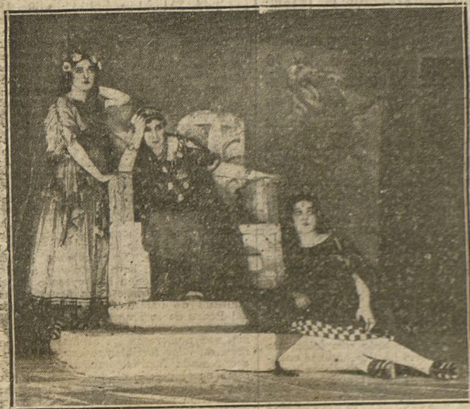
Una escena de la tragedia griega «Clitemnestra», estrenada anoche en el teatro de la Princesa.

Decíamos en nuestros anteriores artículos, é insistimos hoy, al comentar el problema de los metalúrgicos, que la prosperidad de las industrias siderúrgicas era una cosa momentánea y perjudicial.