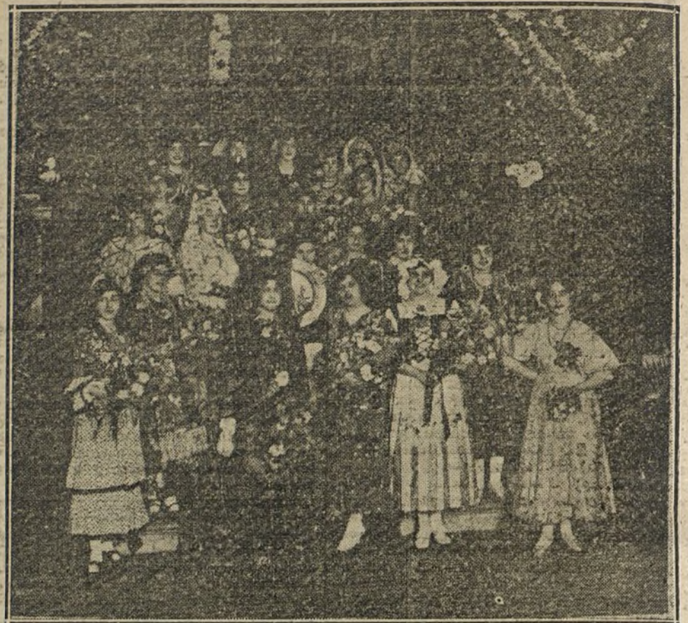
LA FIESTA DEL SAINETE.—Señoritas que, vistiendo típicos trajes españoles, ofrecían flores a las damas que han asistido a la Fiesta del Sainete, celebrada esta tarde en el teatro de Apolo.

El jefe de los socialistas, Sr. Iglesias, visitó esta tarde en el Congreso al conde de Romanones para anunciarle la visita