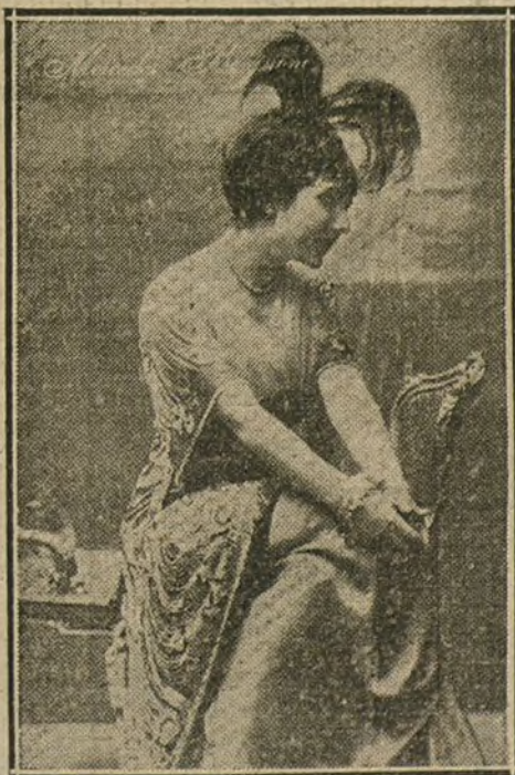
MERCEDES BRIGNONE, actriz cinematográfica de gran mérito.

MADRID BARCELONA Paseo Recoletos, 33 Plaza Cataluña, 9