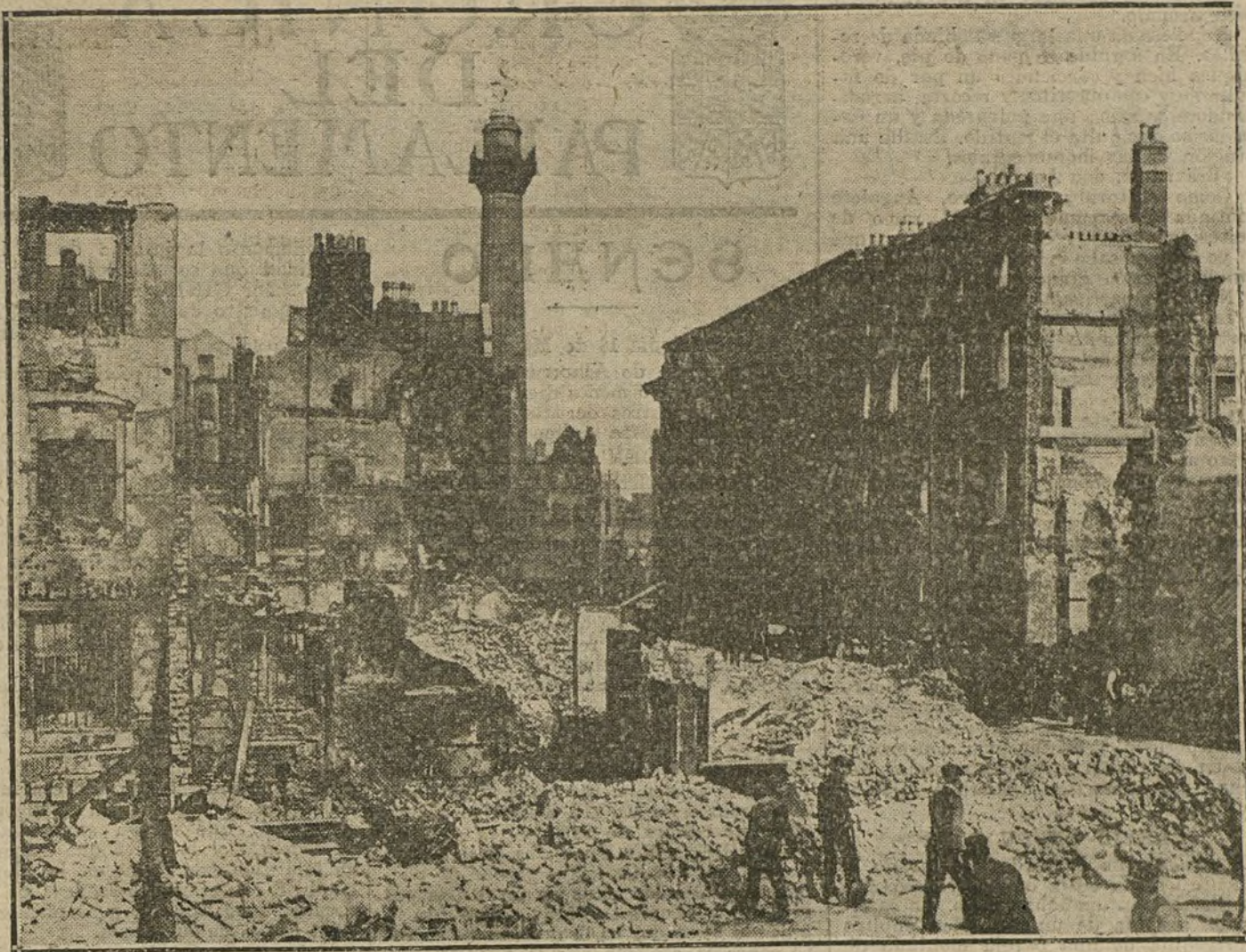
DUBLIN, DESTRUIDO POR LOS INGLESES.—Estragos producidos por la Artillería inglesa en la Casa de Correos y en el Hotel Metrópoli, de la ciudad irlandesa.