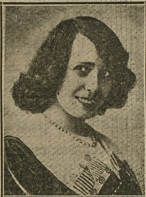
MLLE. MISTINGUETT, eminente actriz cinematográfica.

EL VIERNES, ESTRENO EN LOS PRINCIPALES SALONES DE EL DETECTIVE SWIST DE PATHE-FRERES