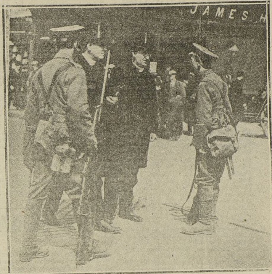
DUBLIN, «MANU MILITARE».—Soldados ingleses ejerciendo en las calles el derecho militar de detención ó inspección de los hombres civiles.

NUMERO DEL TELEFONO DE LA ADMINISTRACION DE «LA TRIBUNA» (PLAZA DE CAÑALEJAS, 6): 5.551